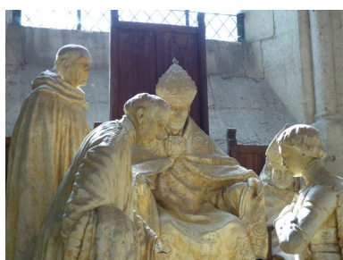
Vue de détail. IVR32_20166005004NUCA