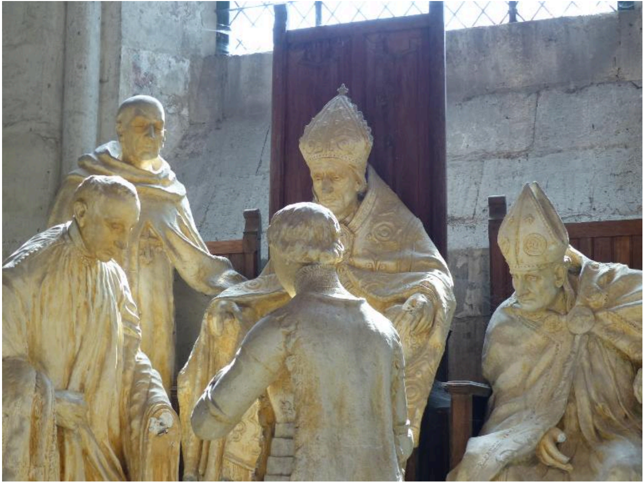
Vue de détail.