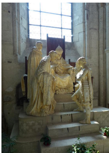
Vue générale. IVR32_20166005006NUCA