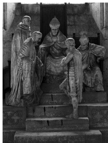
Vue de face. IVR22_19846000765X