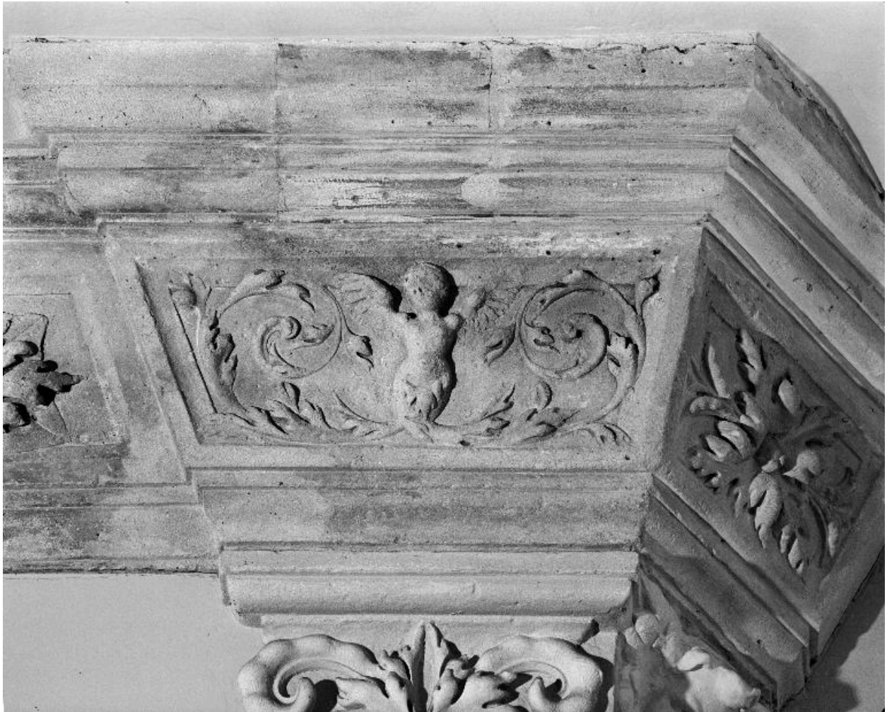
Détail de l'entablement de la hotte : femme ailée et rinceaux.