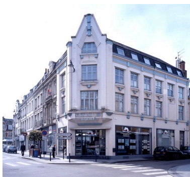
Vue générale. IVR31_20086200156VA