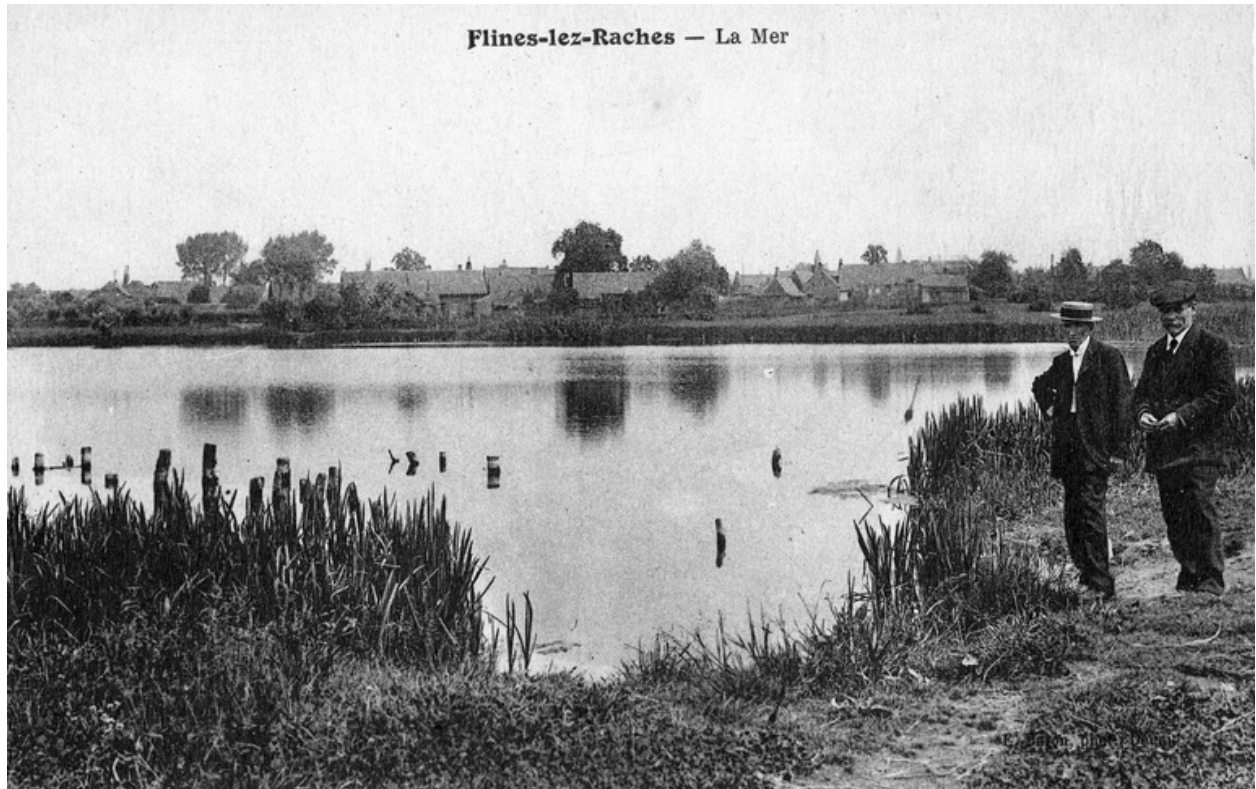
La Mer de Flines, début du 20e siècle.