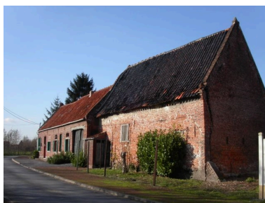
La bergerie de l'abbaye.