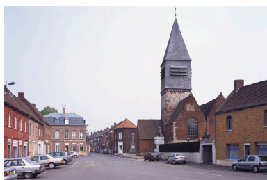
Vue générale de la place.