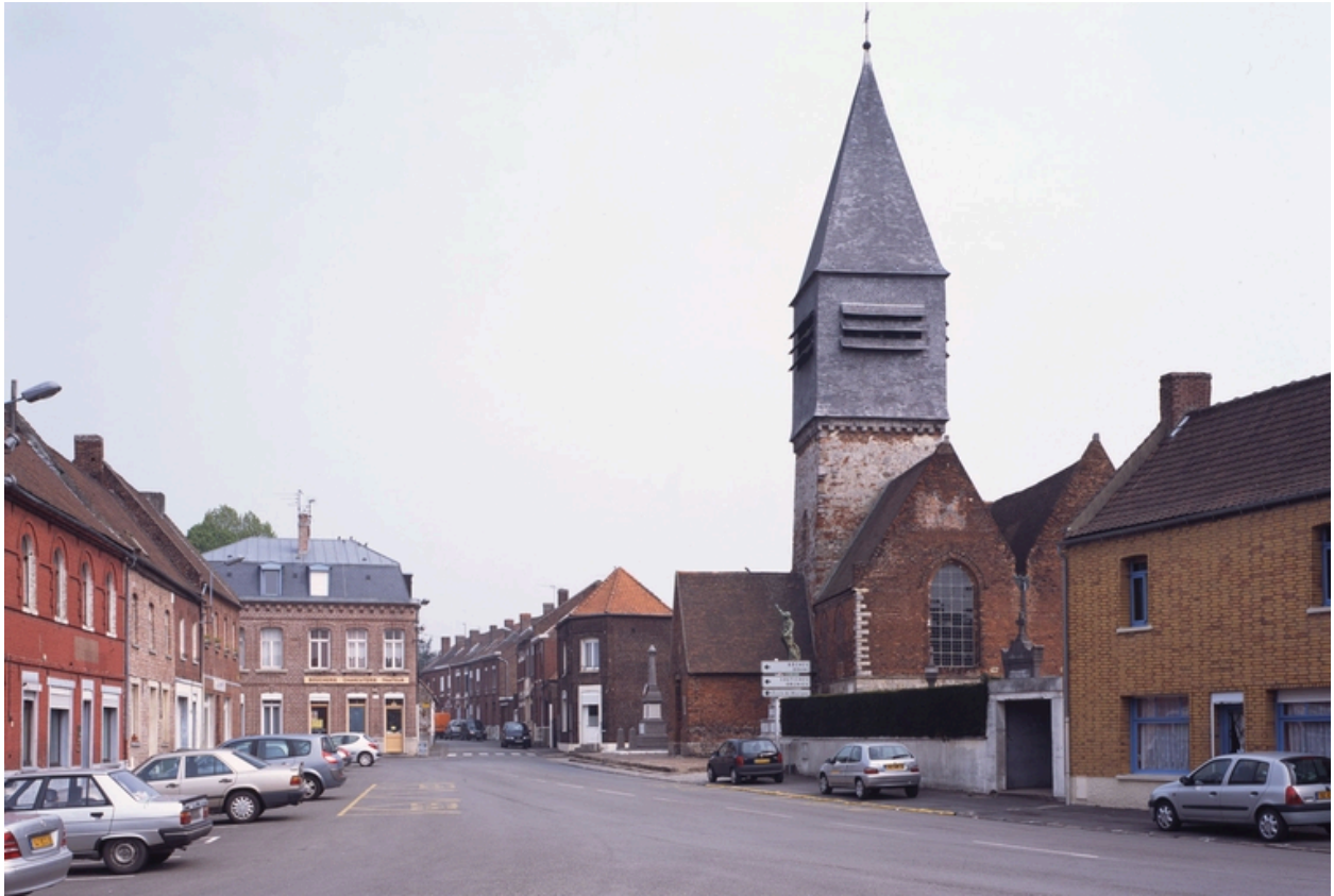
Vue générale de la place.