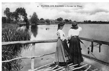
La Mer de Flines, début du 20e siècle. IVR31_20075900211NUCB