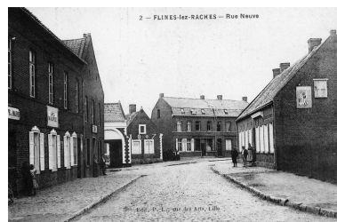
Vue générale de la rue Neuve au début du 20e siècle. IVR31_20075900214NUCB