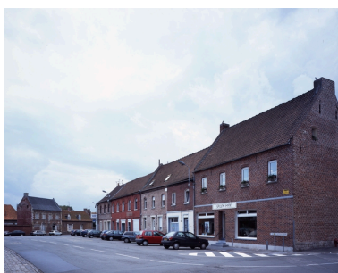
Alignement de maisons sur la place et l'ancienne auberge (au fond, à gauche).