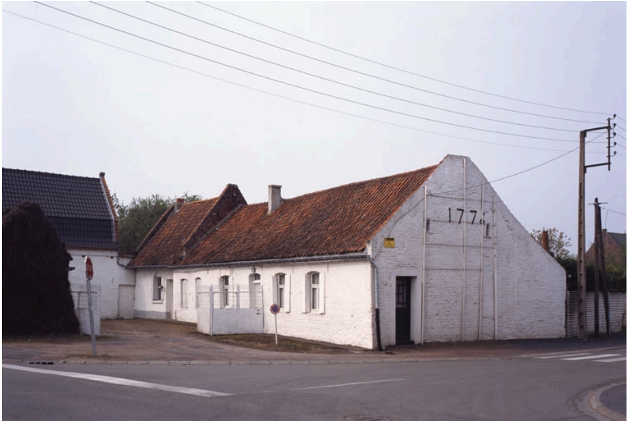
Vue partielle de la ferme située 64, rue du Moulin.