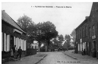
La place de la (nouvelle) mairie (au fond), début du 20e siècle (?).