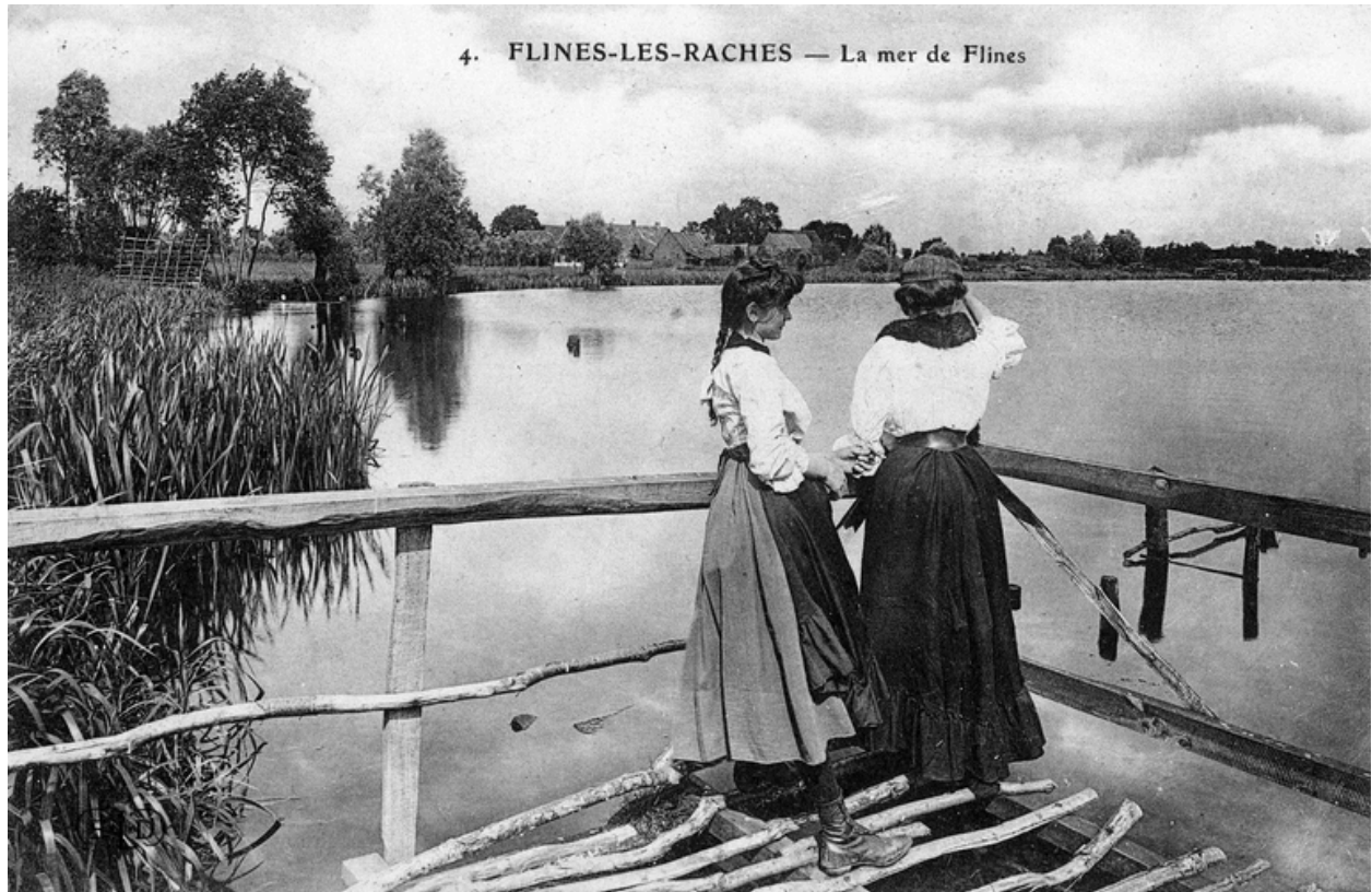
La Mer de Flines, début du 20e siècle.