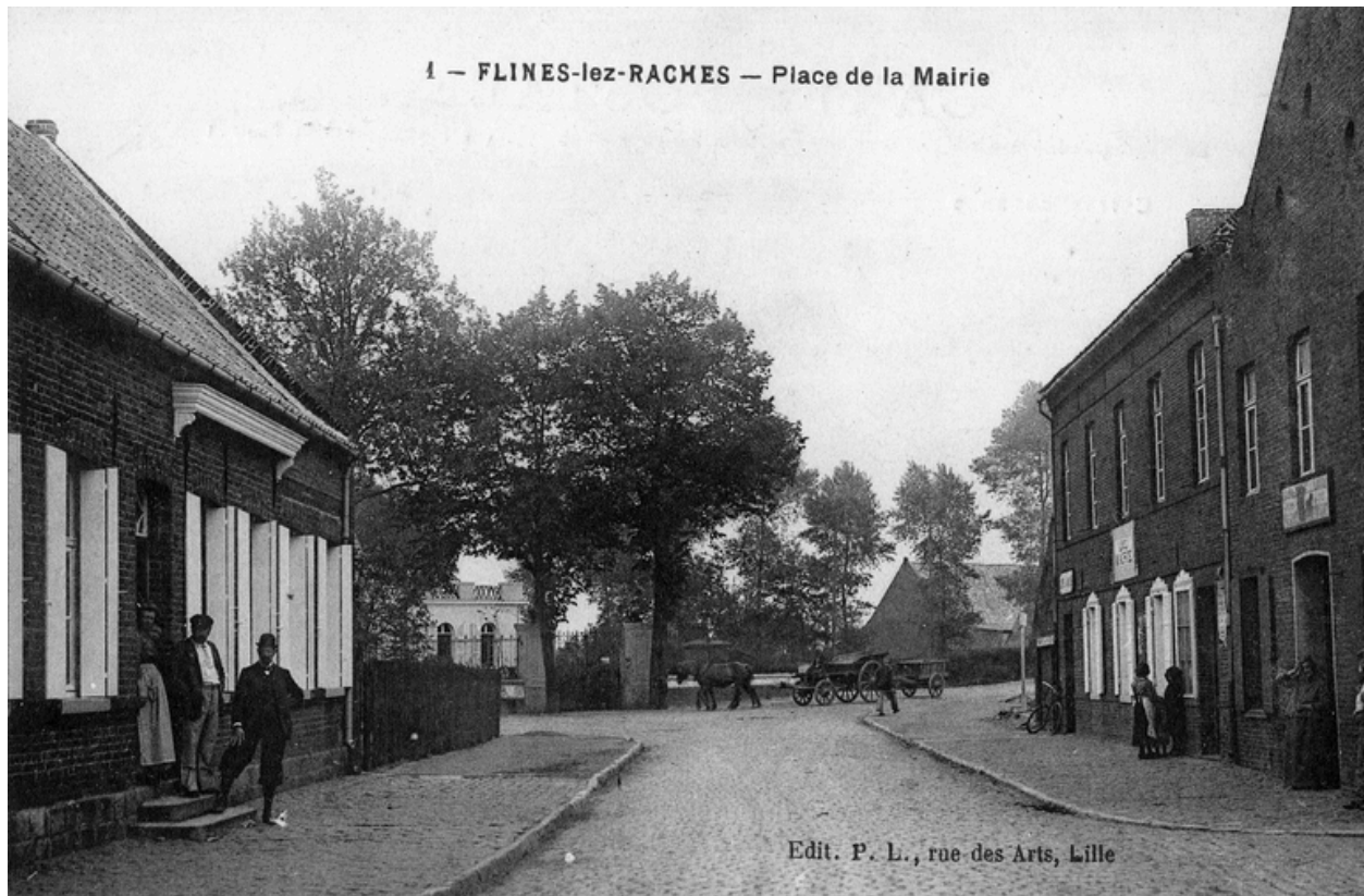
La place de la (nouvelle) mairie (au fond), début du 20e siècle (?).