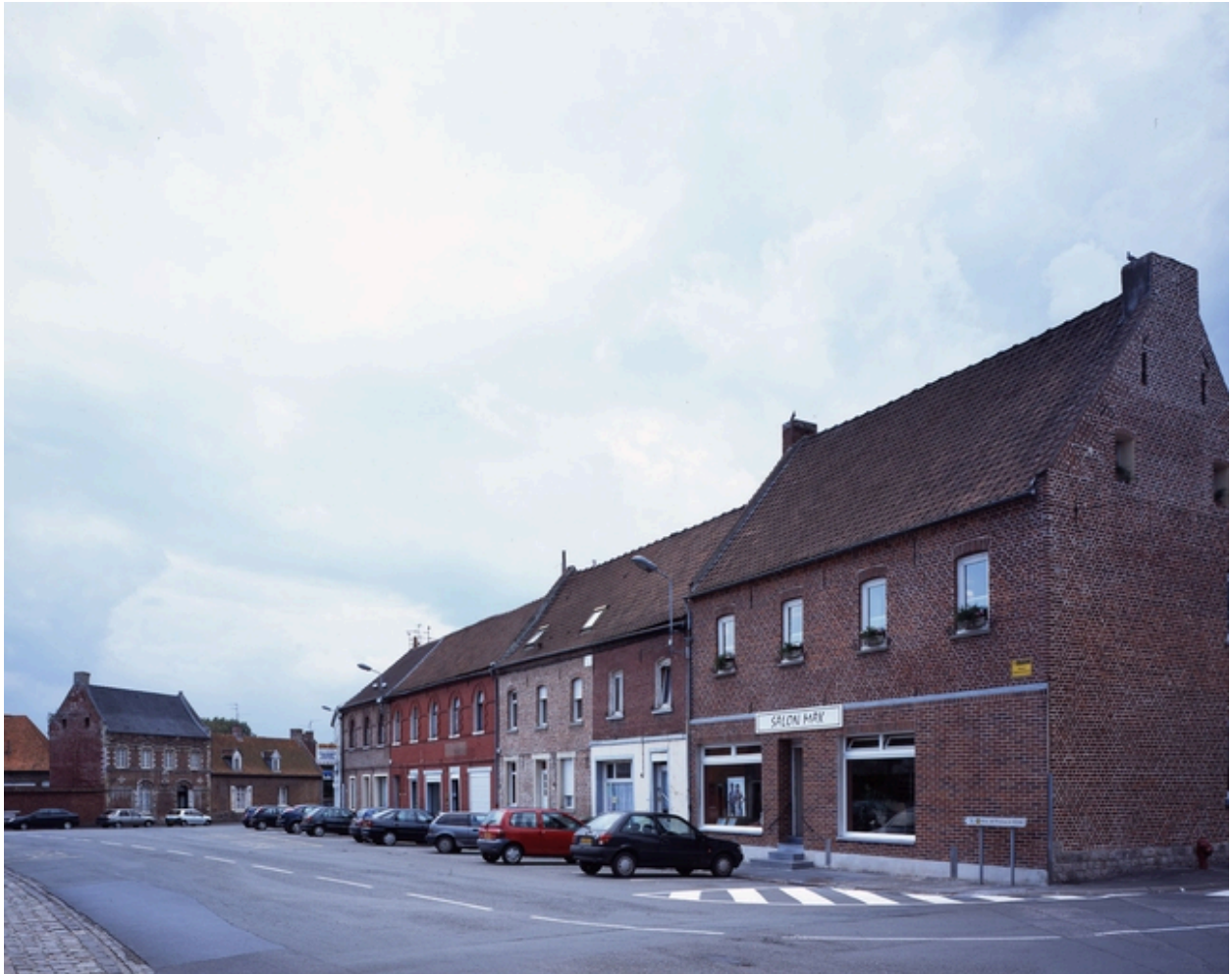
Alignement de maisons sur la place et l'ancienne auberge (au fond, à gauche).