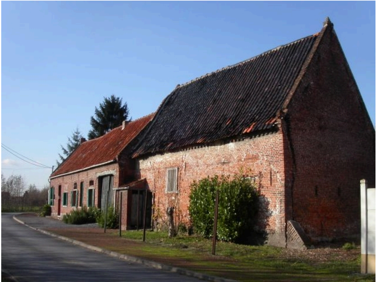
La bergerie de l'abbaye.