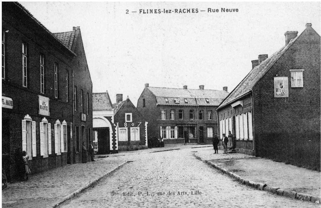
Vue générale de la rue Neuve au début du 20e siècle.