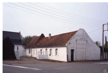
Vue partielle de la ferme située 64, rue du Moulin. IVR31_20085900372XA