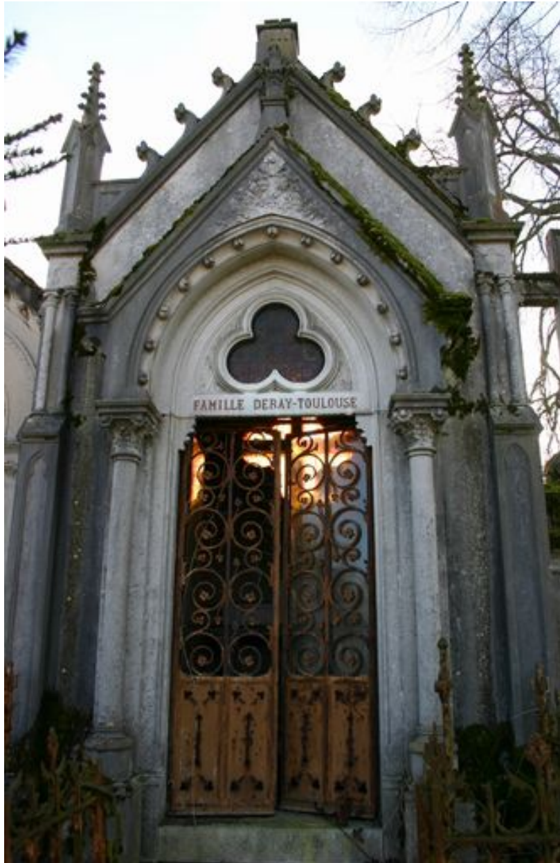
Tombeau en forme de chapelle.