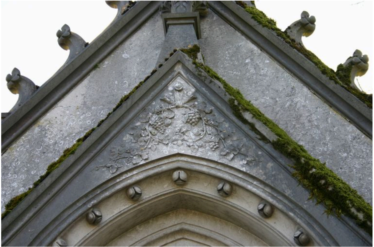
Détail du décor supérieur sculpté : feuilles de vigne et grappes de raisin.