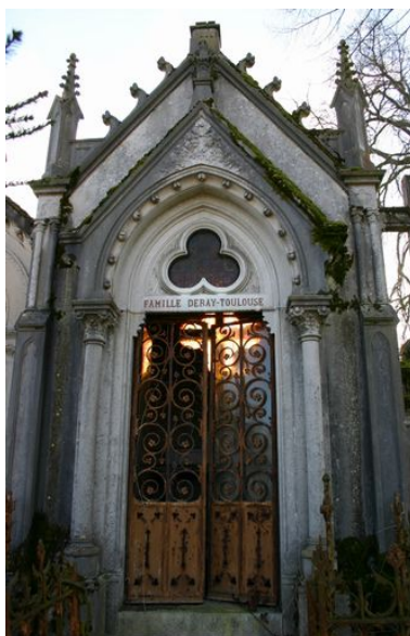
Tombeau en forme de chapelle.