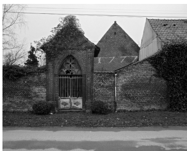
L'oratoire.