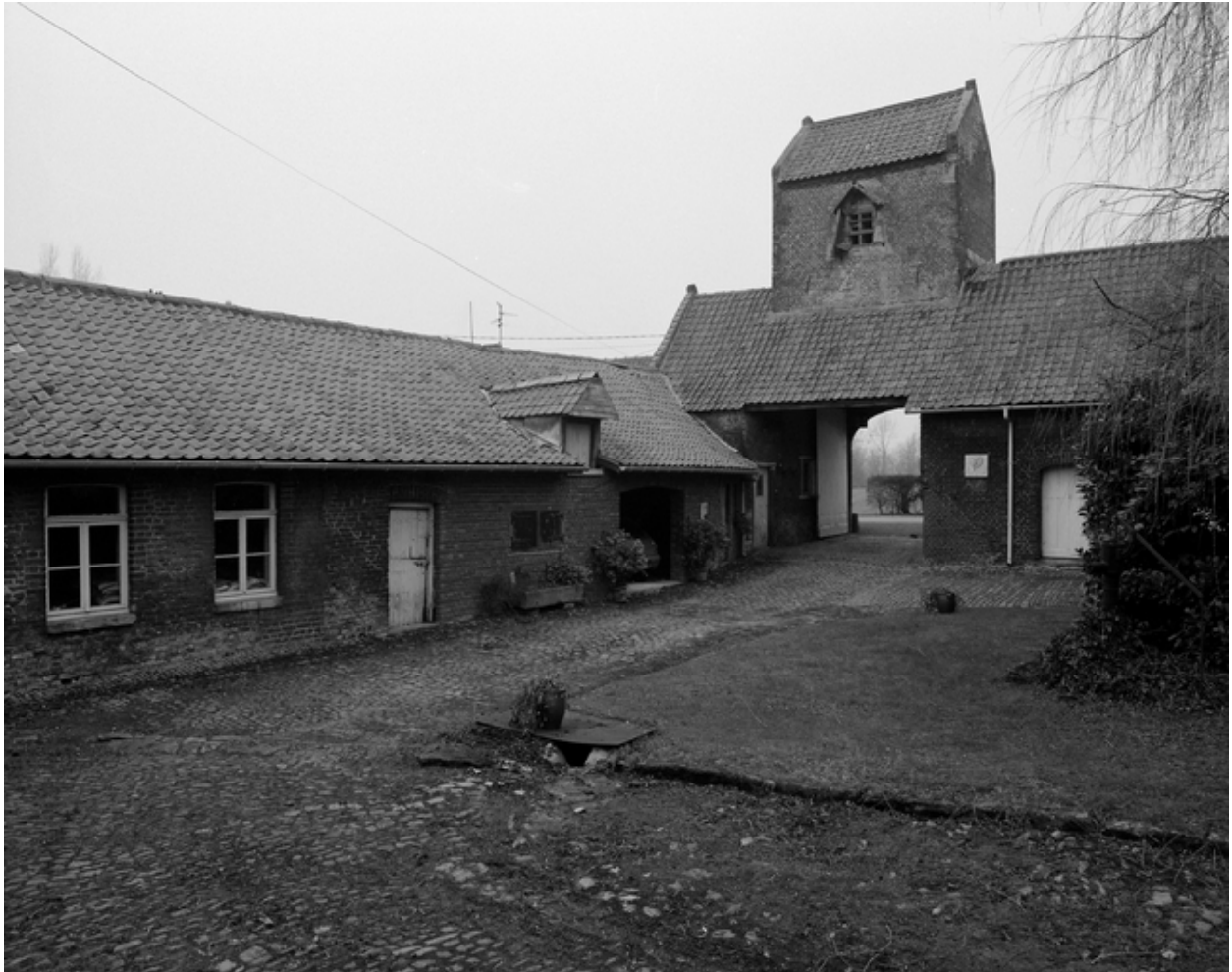
Vue générale de la cour : les communs et le pigeonnier-porche.