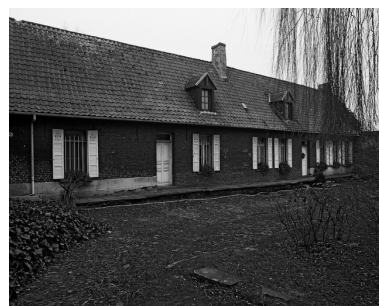
Vue générale de la façade du logis sur cour. IVR31_20045900630X