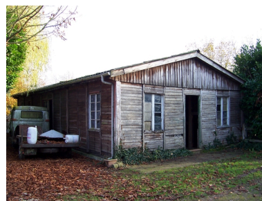
Le baraquement. IVR31_20055907082NUC