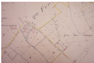
Situation sur le cadastre de 1912 (AD Nord : Série P : P31/ 624). IVR31_20055907388NUC