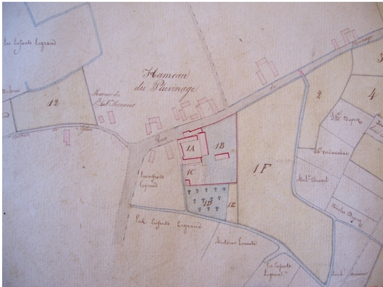
Plan géométrique des propriétés de Jean-Baptiste Lemaire, 1826.