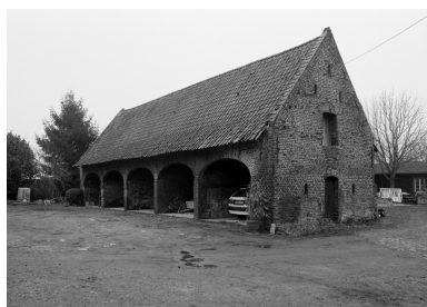
Le chartil. IVR31_20055900151X