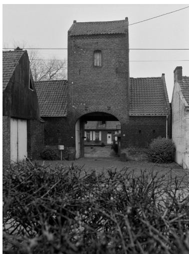
Le porche-pigeonnier depuis la cour.