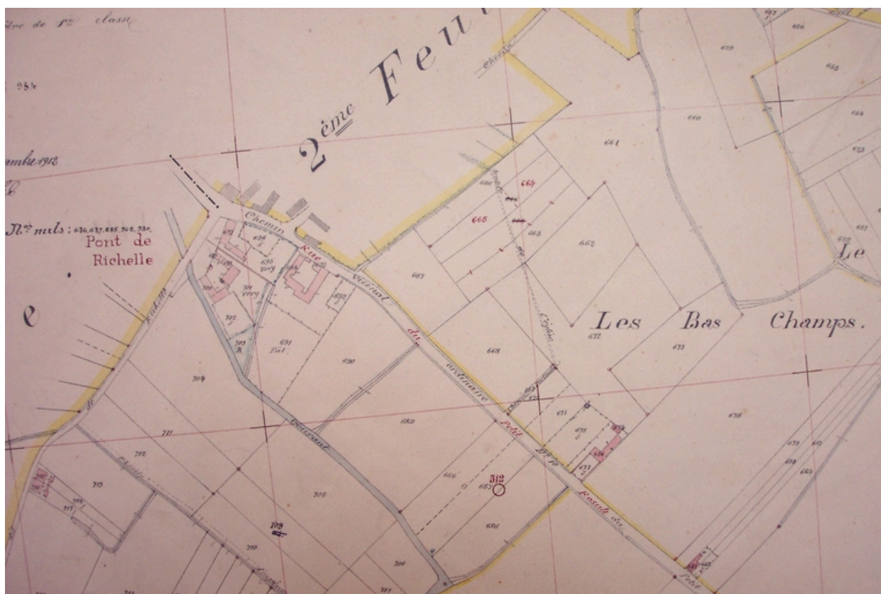
Situation sur le cadastre de 1912 (AD Nord : Série P : P31/ 624).