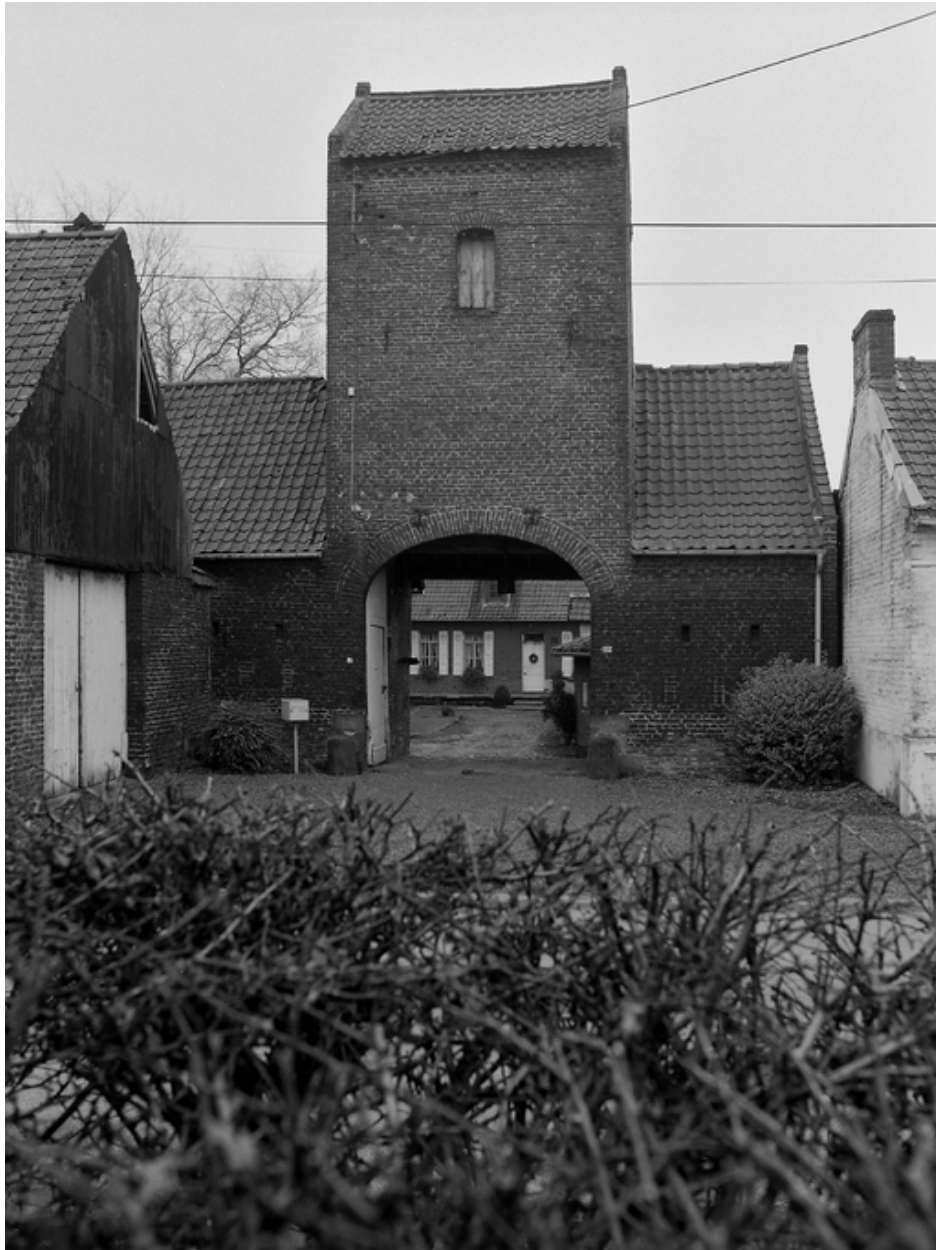
Le porche-pigeonnier depuis la cour.