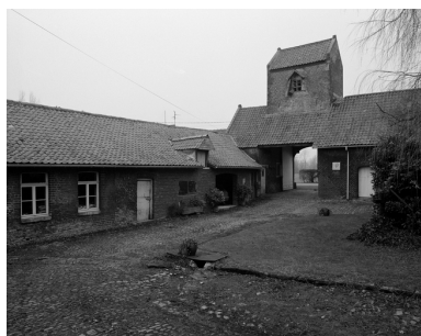
Vue générale de la cour : les communs et le pigeonnier-porche.