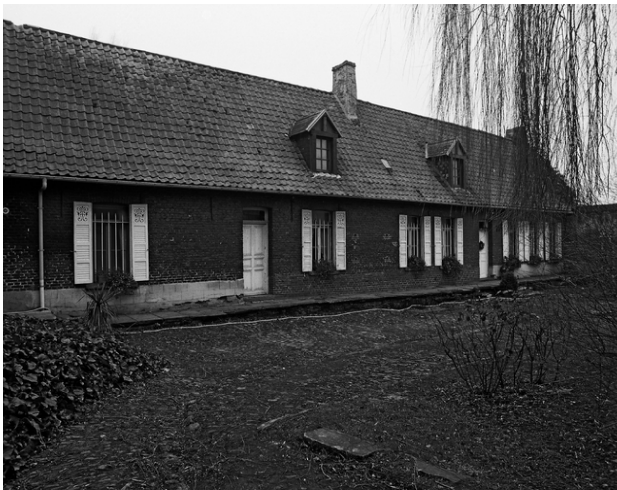
Vue générale de la façade du logis sur cour.