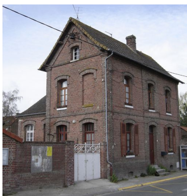
Vue générale. IVR22_20058005717NUCA