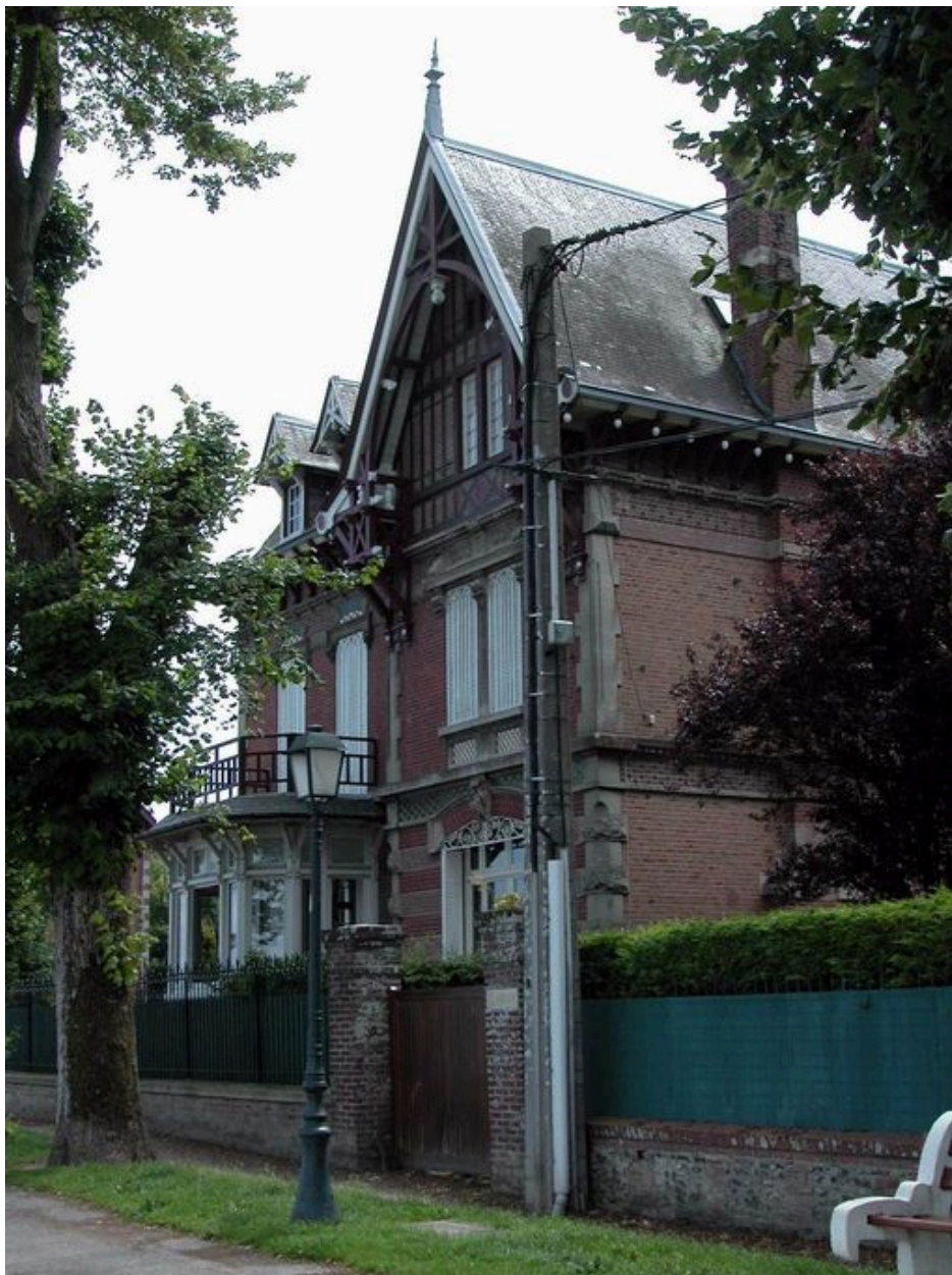
Vue d'ensemble, façade antérieure.