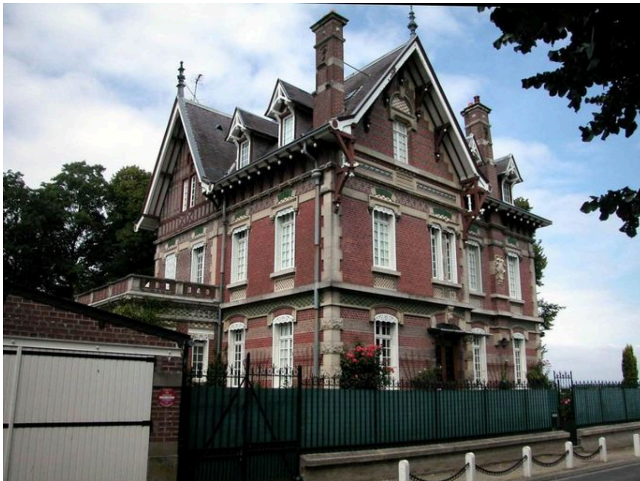
Vue de trois-quarts sur les façades postérieure et d'entrée.