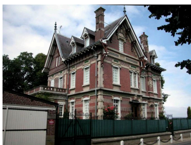
Vue de trois-quarts sur les façades postérieure et d'entrée.