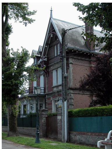
Vue d'ensemble, façade antérieure.