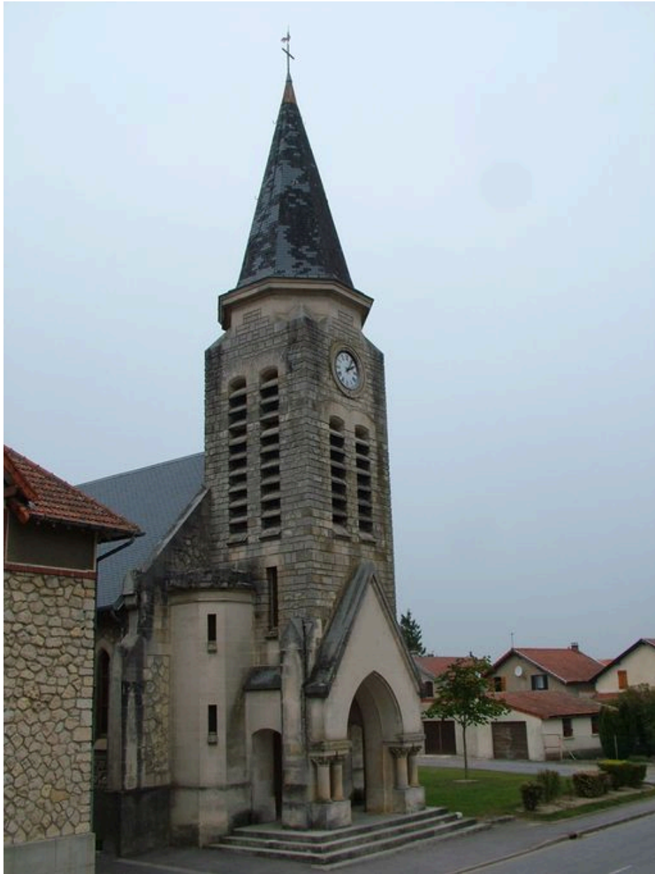
Vue de la façade ouest.