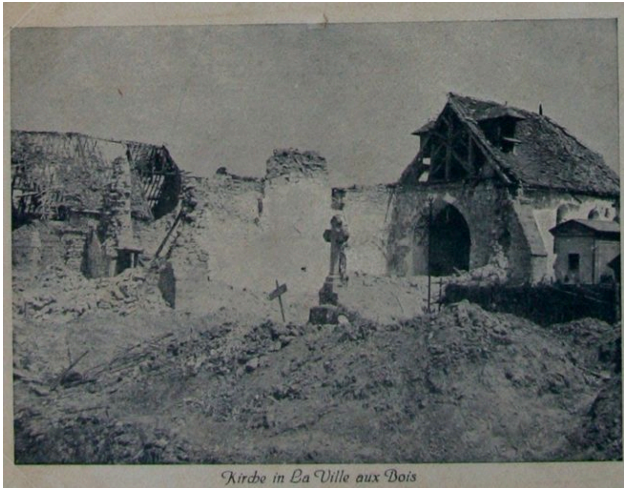
Ruines de l'église après 1916 (coll. part).