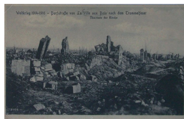
Ce qu'il reste de l'église à la fin de la guerre.