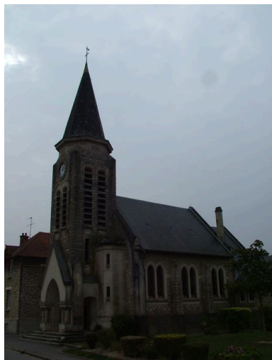
Vue générale. IVR22_20030203142NUCA