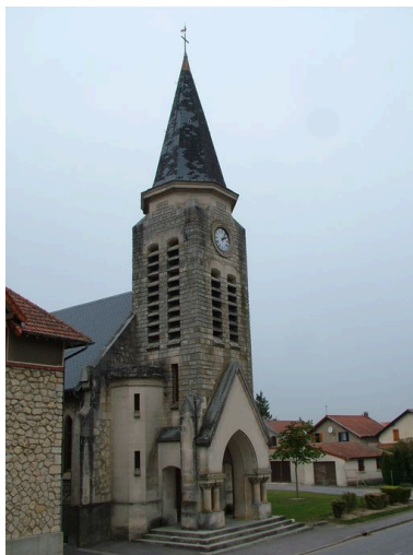
Vue de la façade ouest.