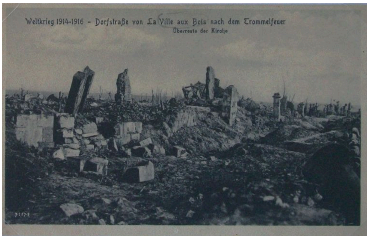
Ce qu'il reste de l'église à la fin de la guerre.