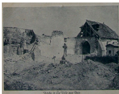
Ruines de l'église après 1916 (coll. part).