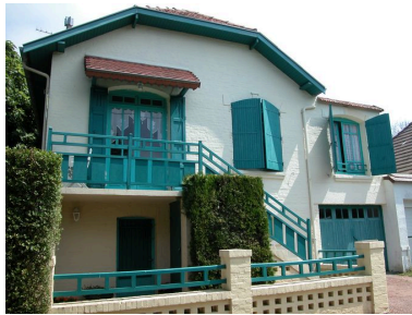
Vue d'ensemble. IVR22_20058003045NUCA