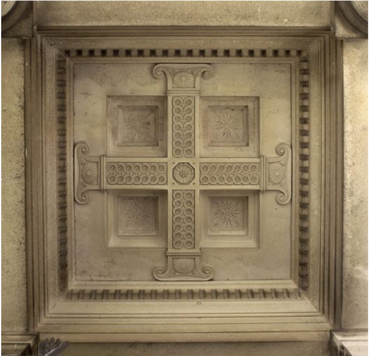
Vue du plafond à caissons.