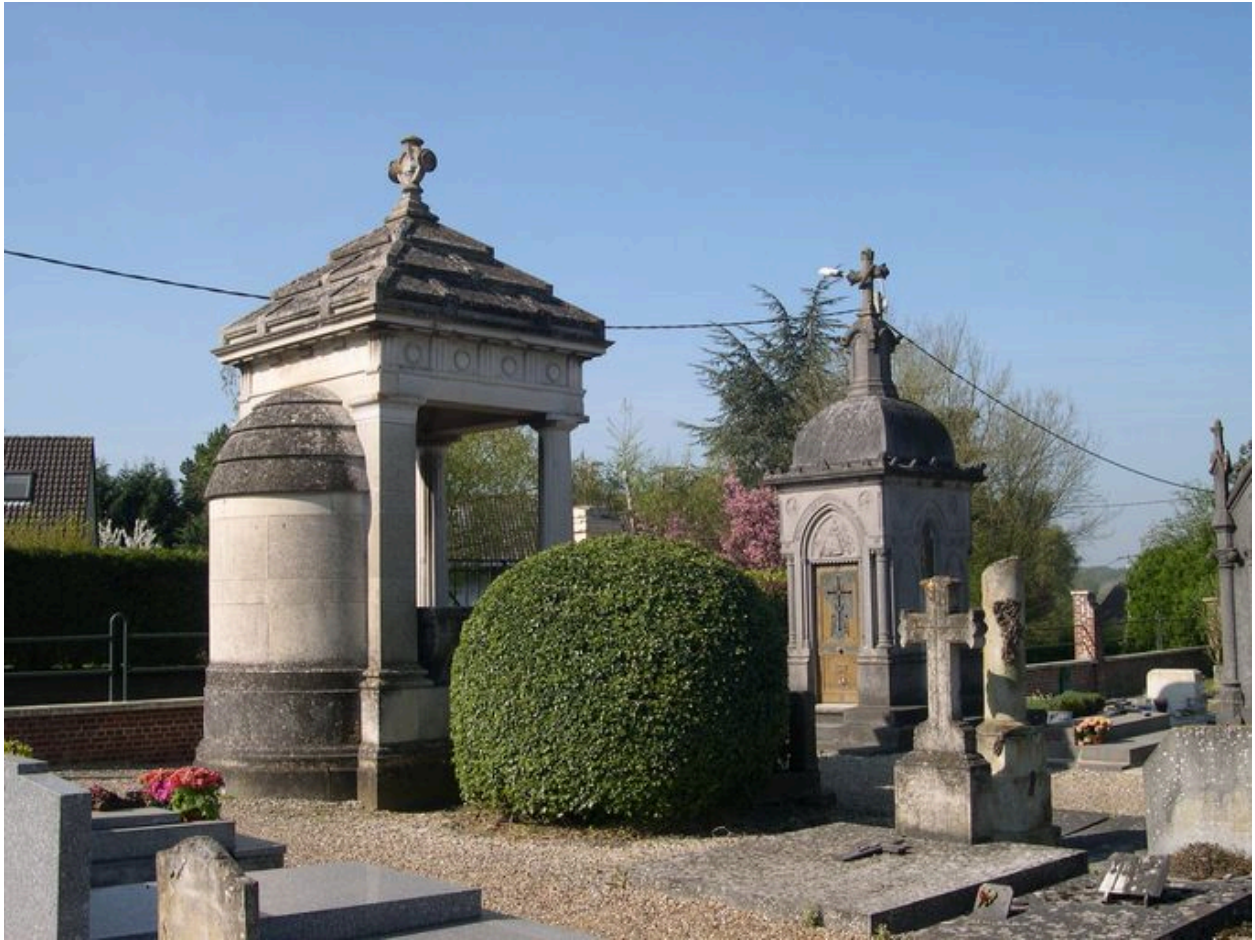
Vue générale depuis les nord-est.