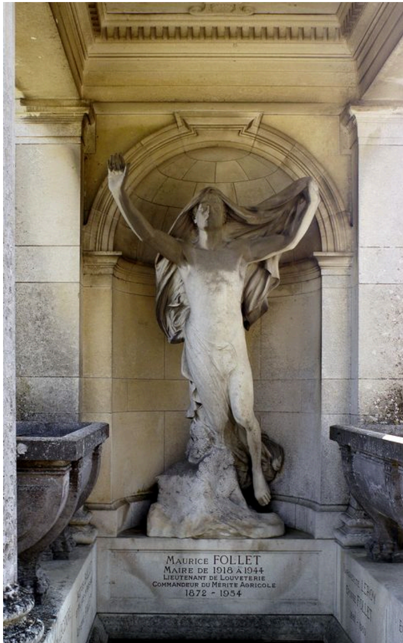
La Résurrection, statue en marbre, signée et datée : Albert Roze, 1898.