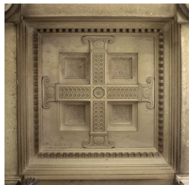
Vue du plafond à caissons. IVR22_20078000008NUCA