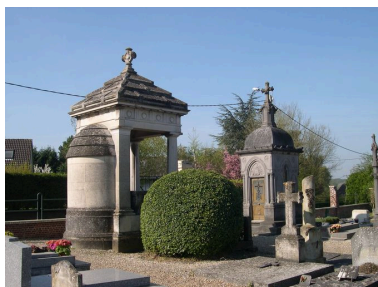
Vue générale depuis les nord-est. IVR22_20078010006NUCA