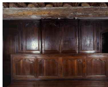
Vue de détail : placards au premier plan. IVR22_19966001805XA