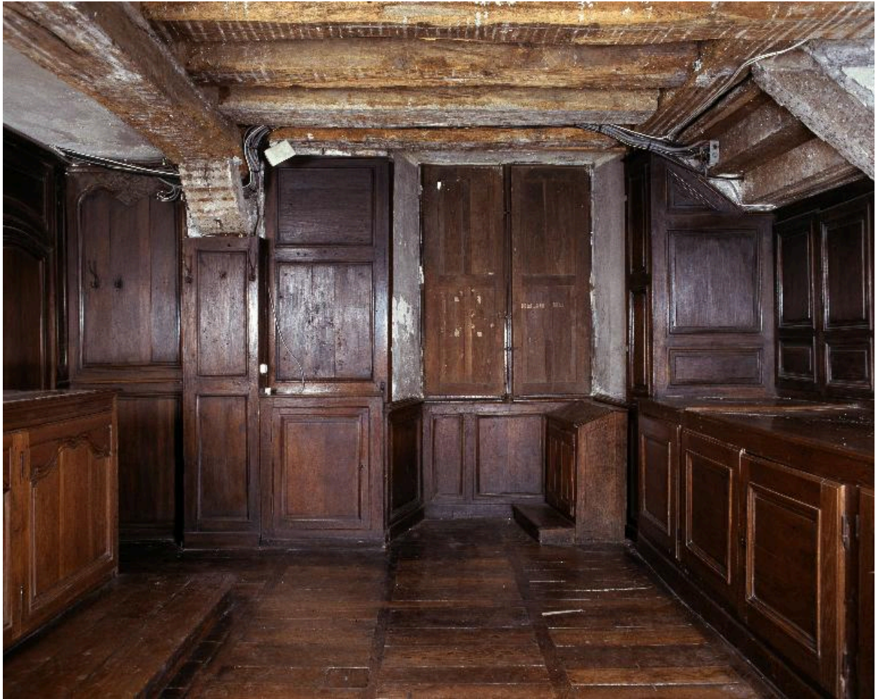
Vue des placards du fond de la sacristie avec les vantaux des fenêtres.