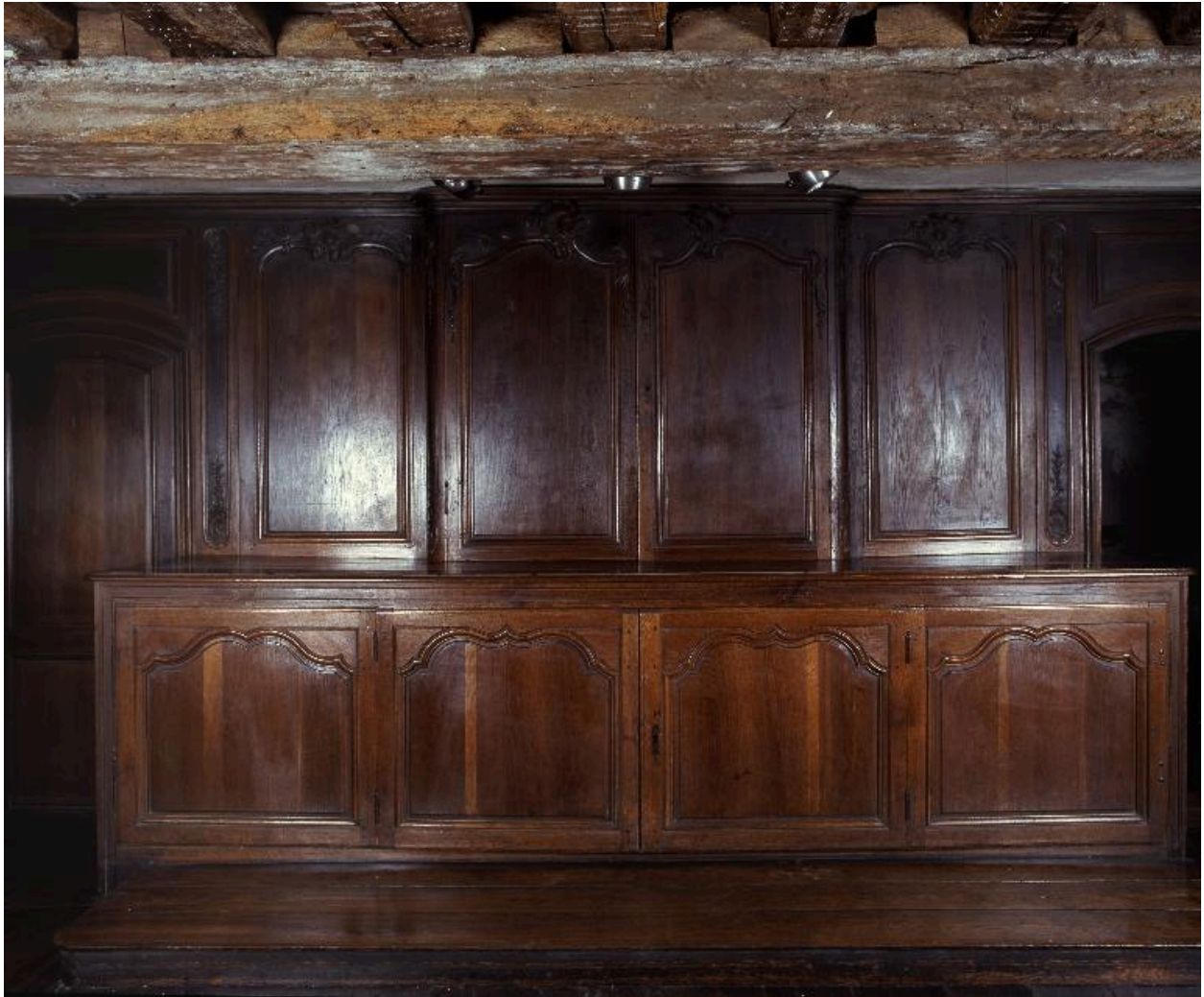
Vue de détail : placards au premier plan.