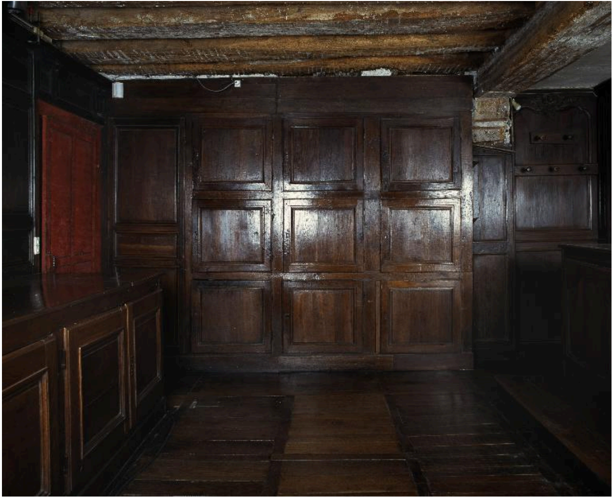
Vue des placards dans le fond de la sacristie.