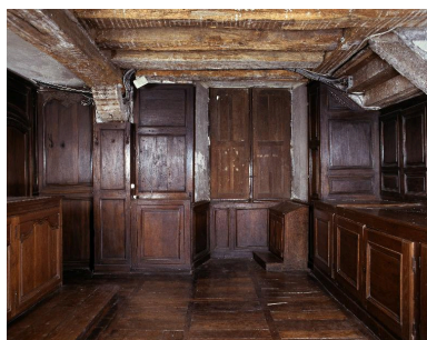
Vue des placards du fond de la sacristie avec les vantaux des fenêtres.