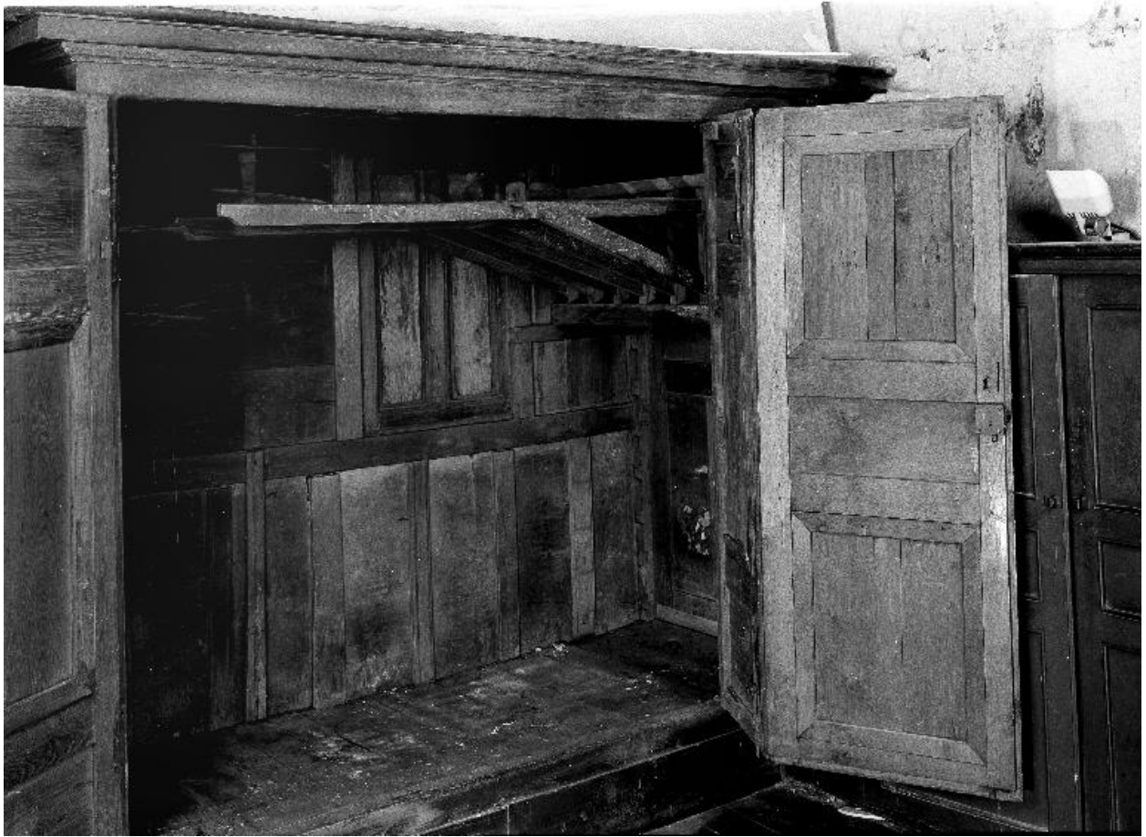
Vue du meuble porte ouverte, avec le système latéral de suspension des vêtements.