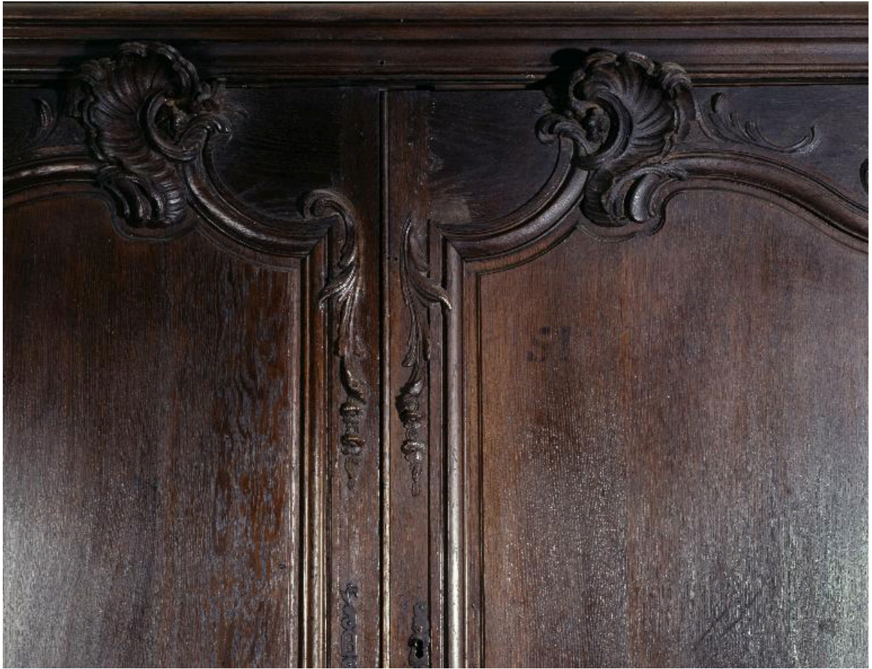
Détail du décor sculpté.