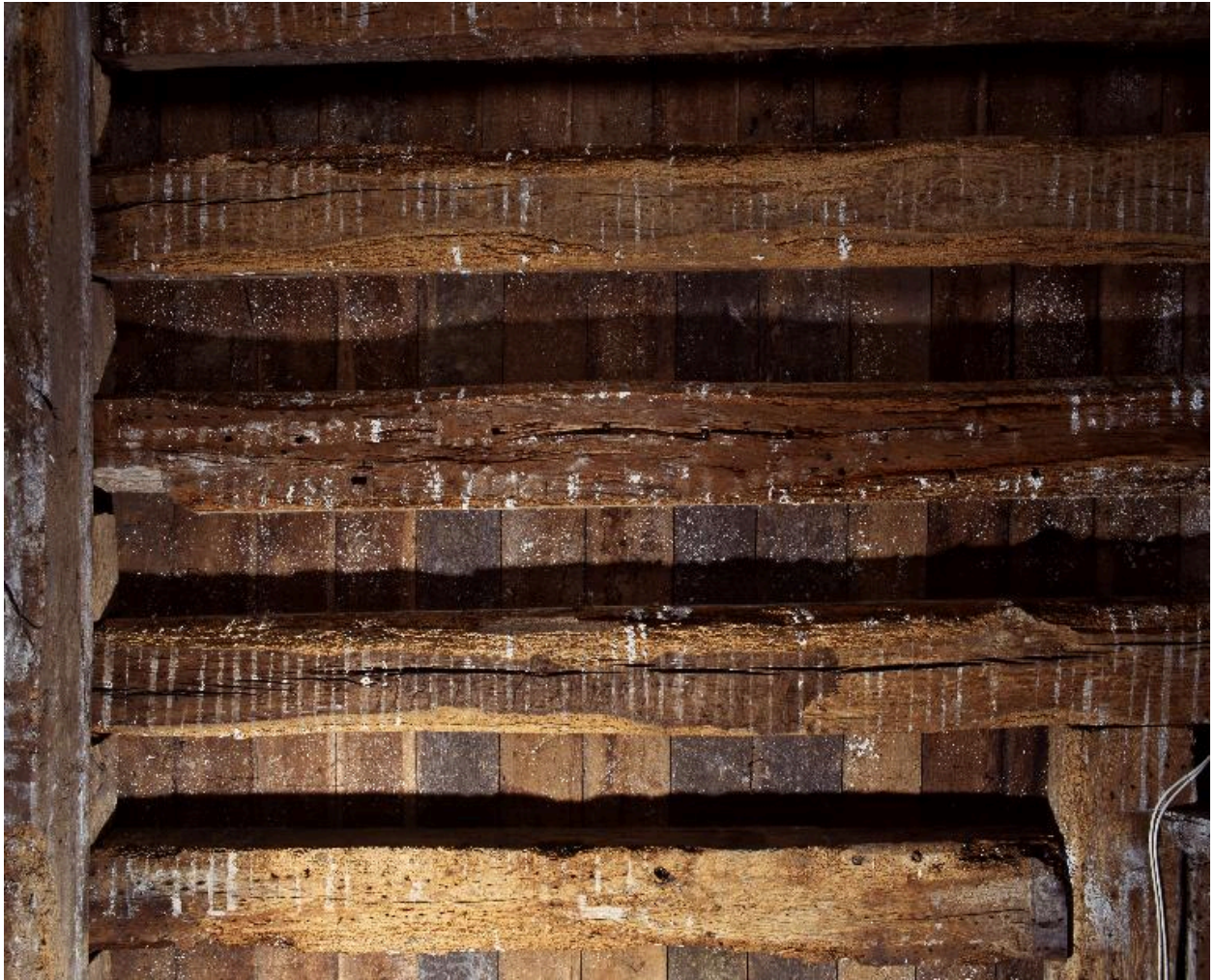
Vue des poutres du plafond de la sacristie.