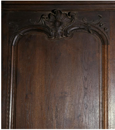
Détail des boiseries. IVR22_19966001803XA