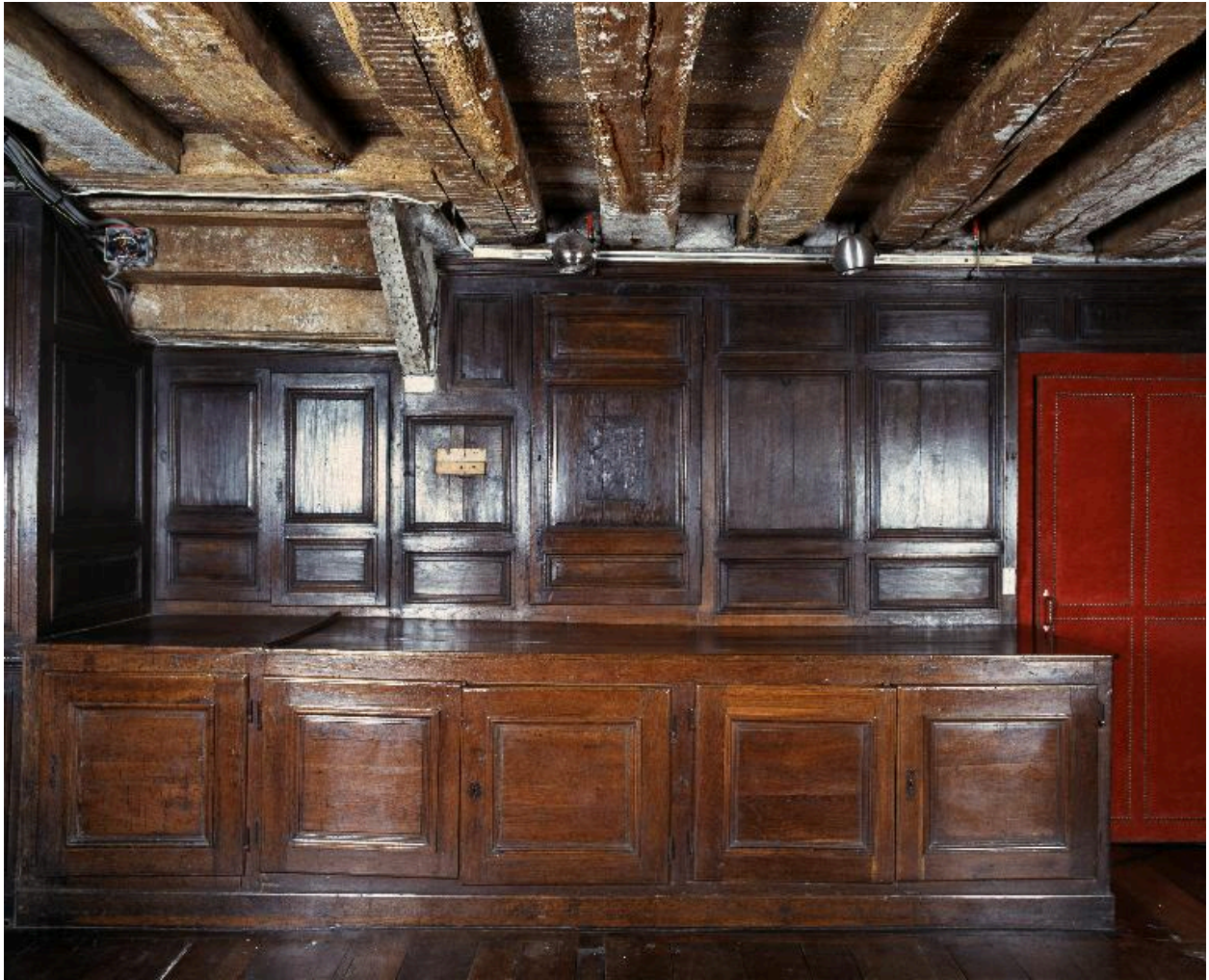
Vue des chapiers à tiroirs et placards.