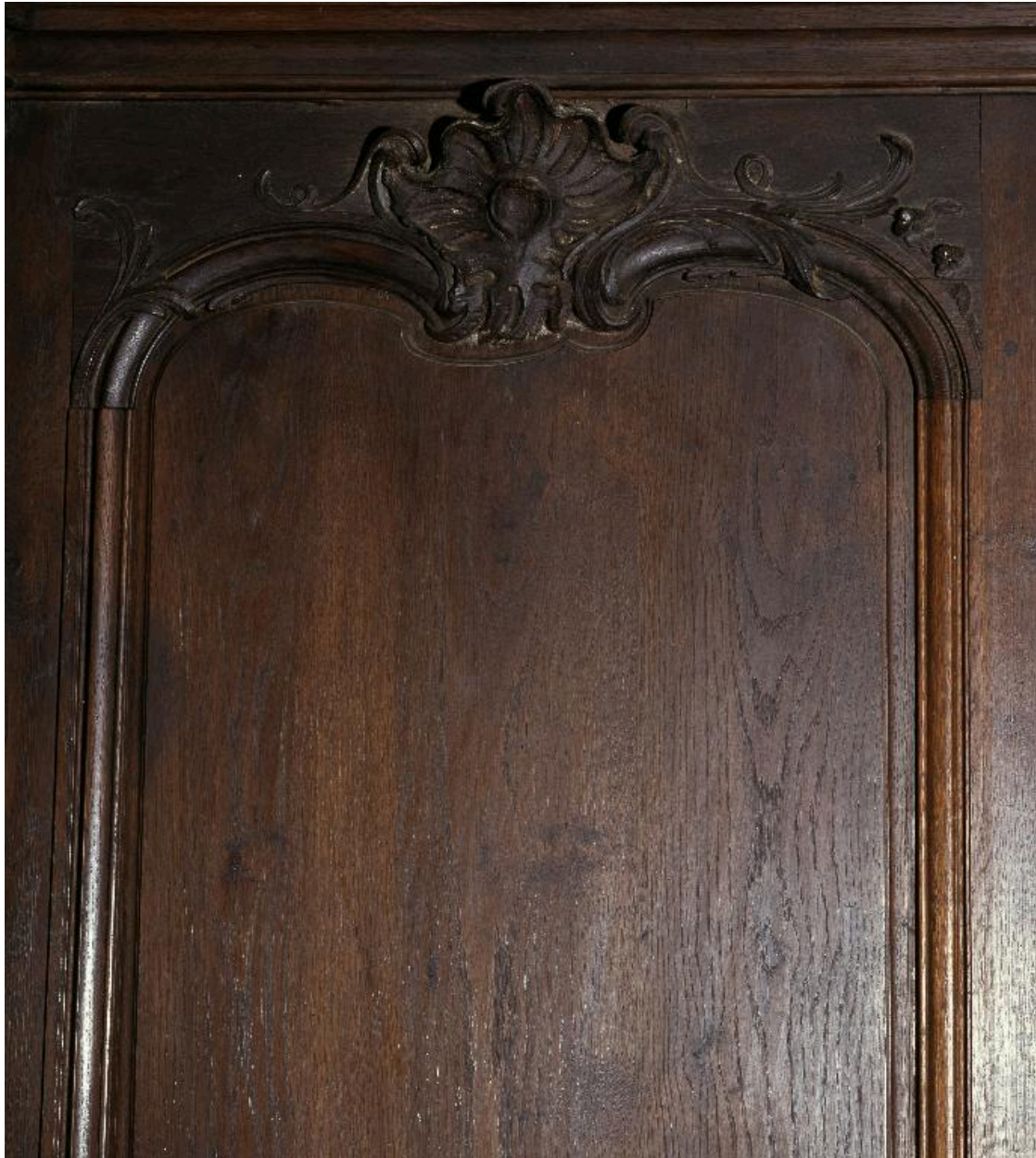
Détail des boiseries.