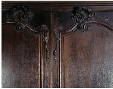
Détail du décor sculpté.