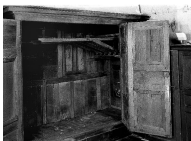
Vue du meuble porte ouverte, avec le système latéral de suspension des vêtements.