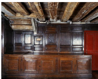
Vue des chapiers à tiroirs et placards.