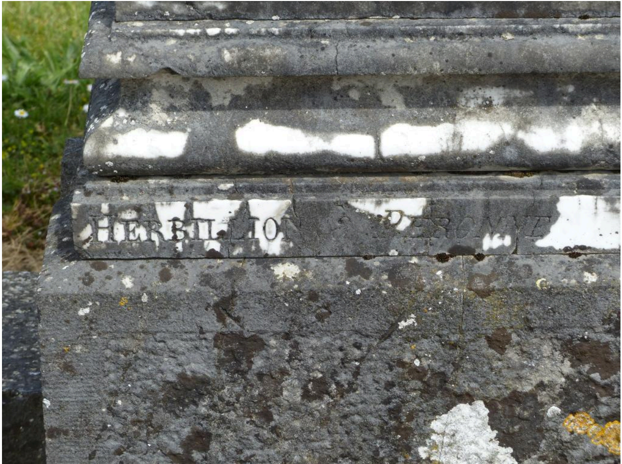
Vue de détail sur la signature du marbrier Herbillon.