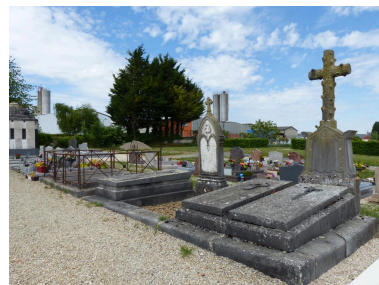
Vue générale de l'enclos funéraire. IVR32_20228005067NUCA