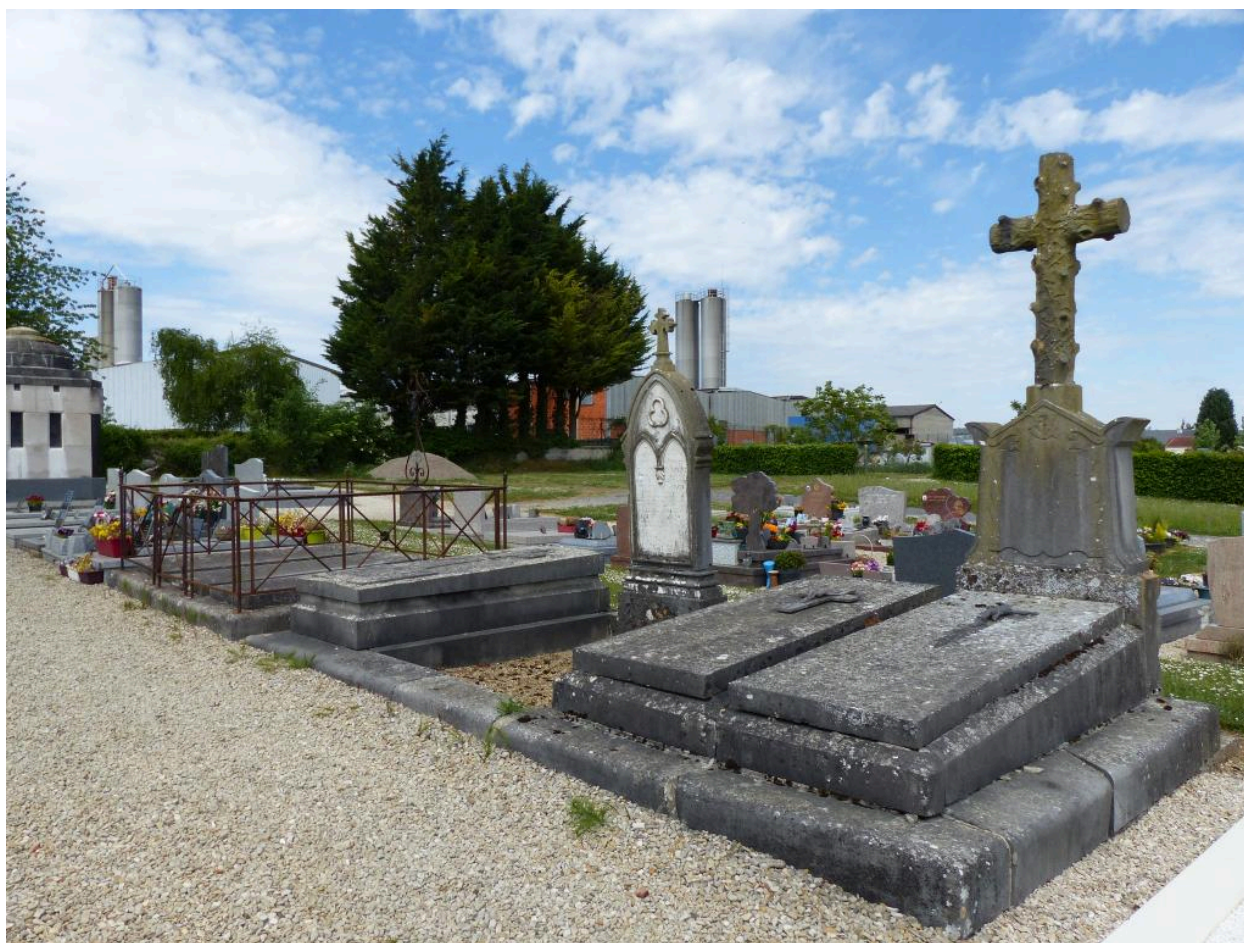
Vue générale de l'enclos funéraire.