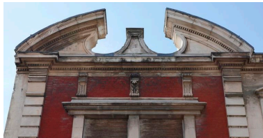
Vue sur le fronton curviligne interrompu.