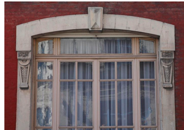
Vue sur l'encadrement sculpté d'une baie située au rez-de-chaussée.