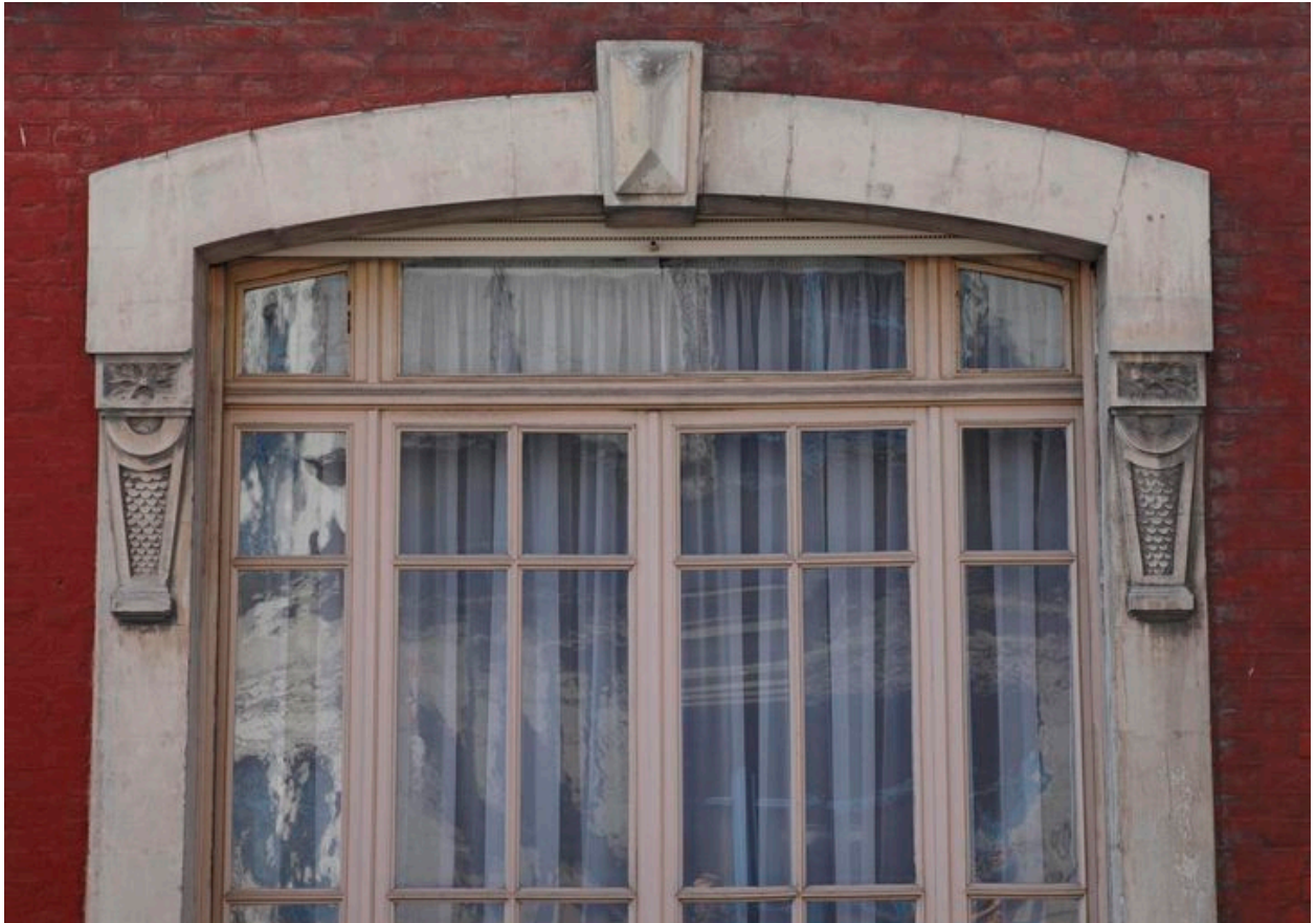
Vue sur l'encadrement sculpté d'une baie située au rez-de-chaussée.