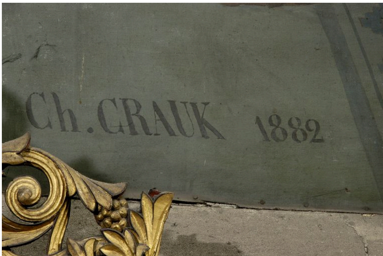
Tableau 1 (droite) : le voeu de Louis XIII, détail : date et signature.