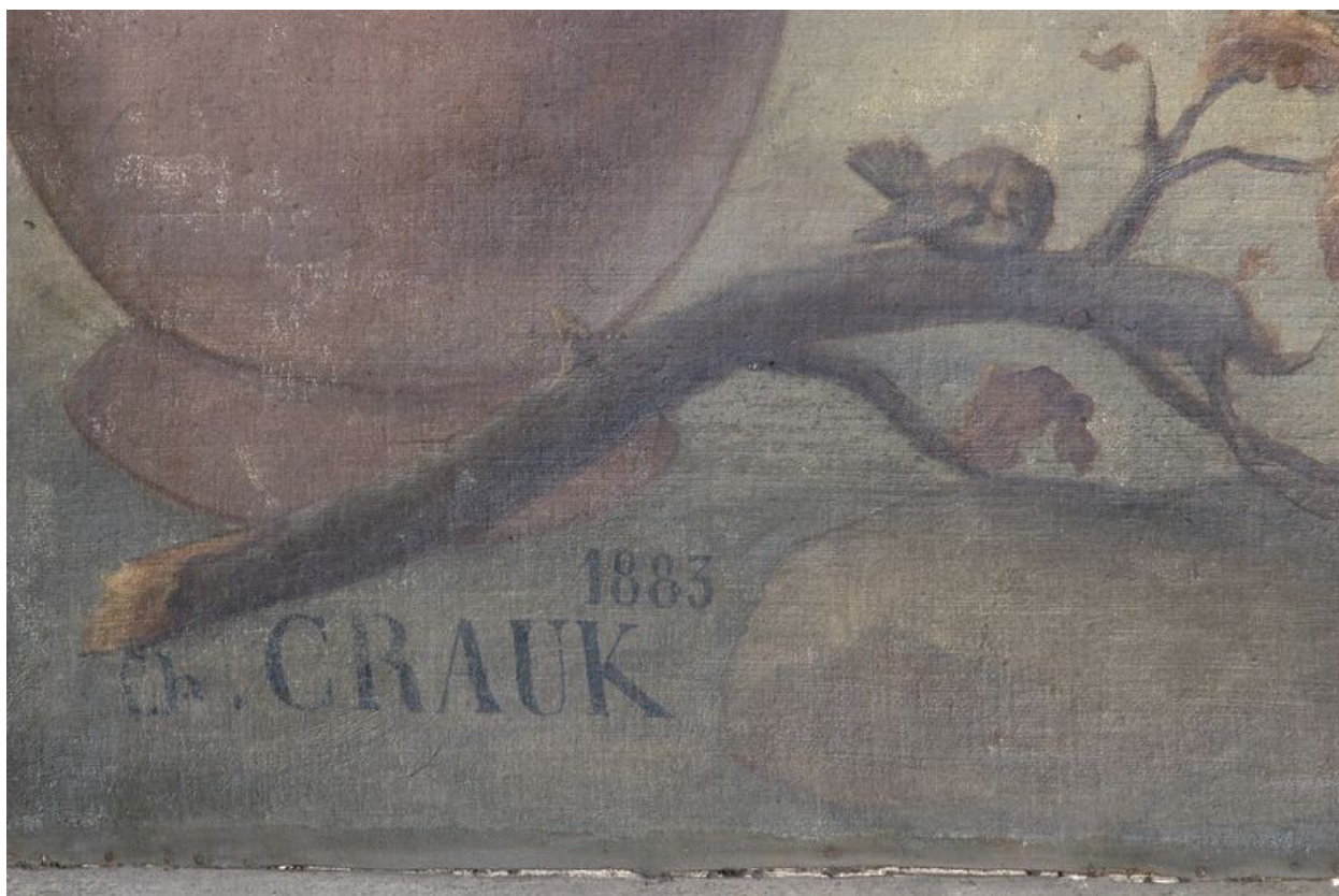
Tableau 1 (gauche) : l'enfance de la Vierge, détail : date et signature.