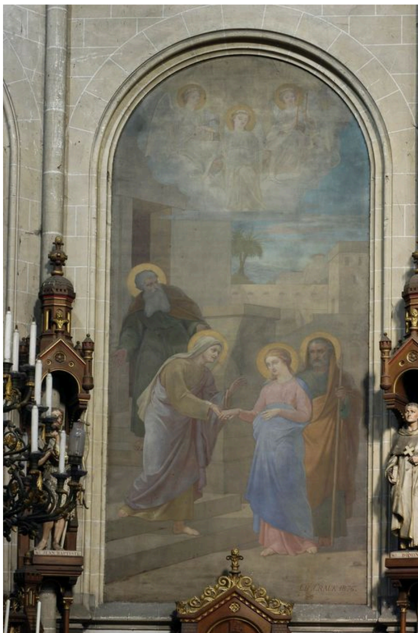
Tableau 2 (droite) : la Visitation, Ch. Crauk, 1876.