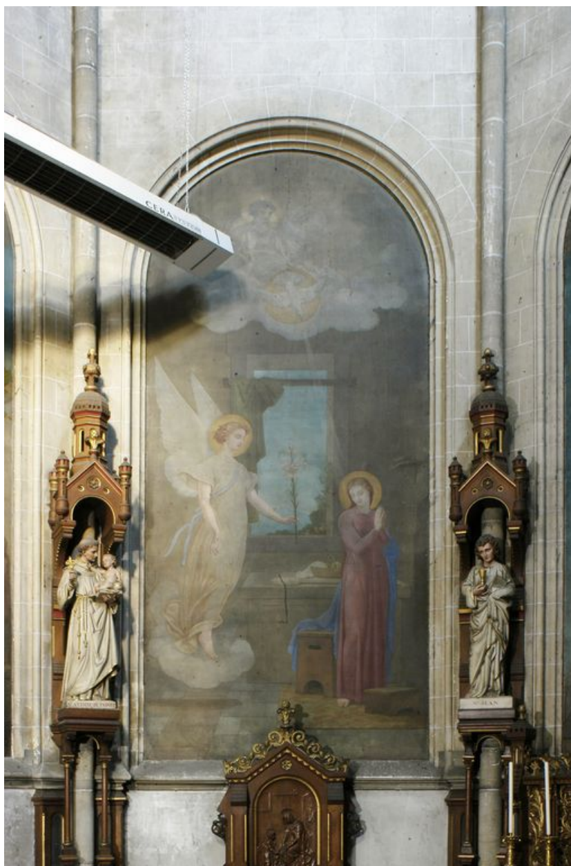
Tableau 2 (gauche) : l'Annonciation.