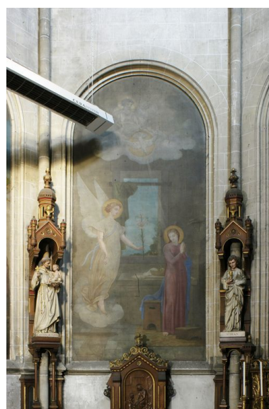
Tableau 2 (gauche) : l'Annonciation.