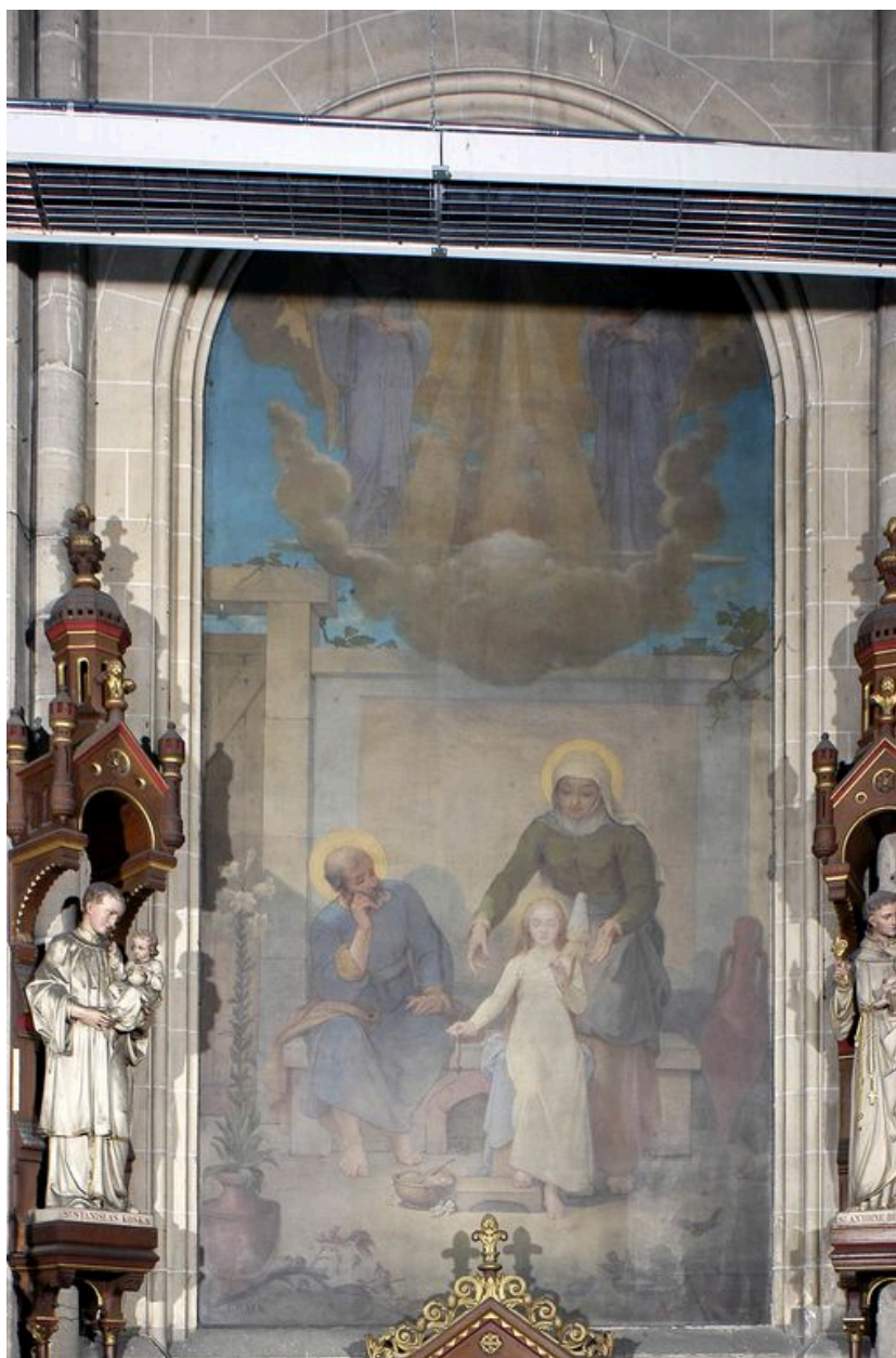
Tableau 1 (gauche) : l'enfance de la Vierge, Ch. Crauk, 1883.