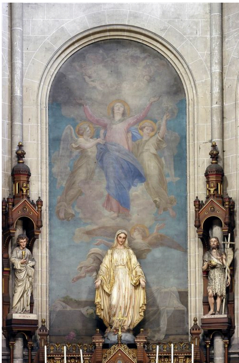
Tableau 3 (centre) : l'Assomption.