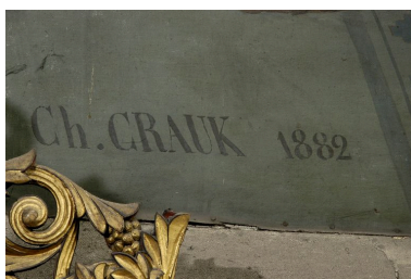
Tableau 1 (droite) : le voeu de Louis XIII, détail : date et signature.