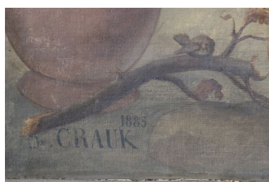
Tableau 1 (gauche) : l'enfance de la Vierge, détail : date et signature.