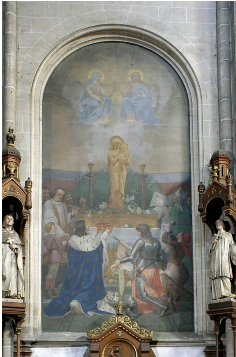
Tableau 1 (droite) : le voeu de Louis XIII, Ch. Crauk, 1882.