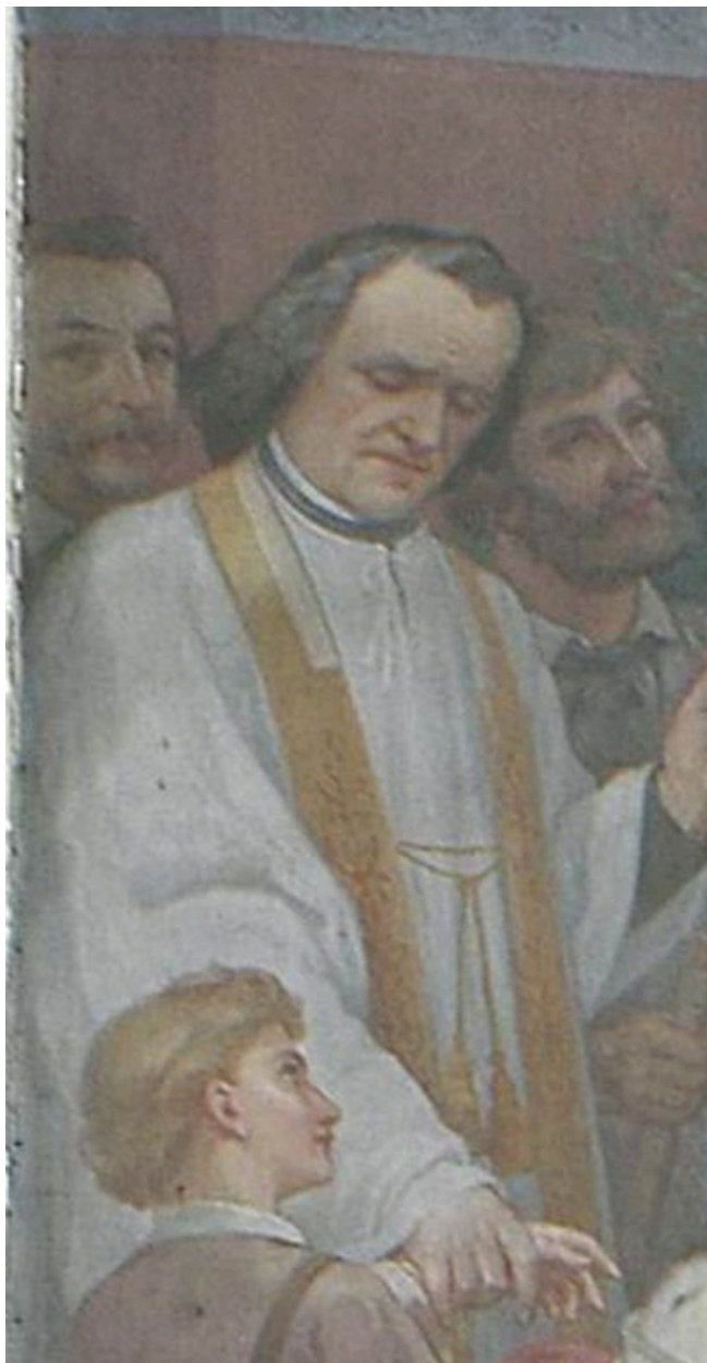
Tableau 1 (droite) : le voeu de Louis XIII, détail : portraits du père Aubert, du peintre et de l'architecte.