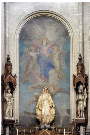
Tableau 3 (centre) : l'Assomption.