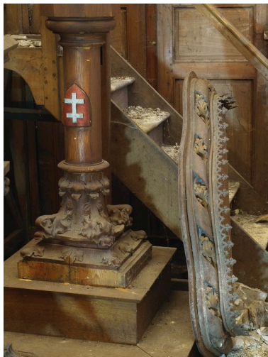
Vue générale IVR31_20106202230NUCA