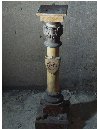
Socle avec blason et monogramme IVR31_20106202232NUCA