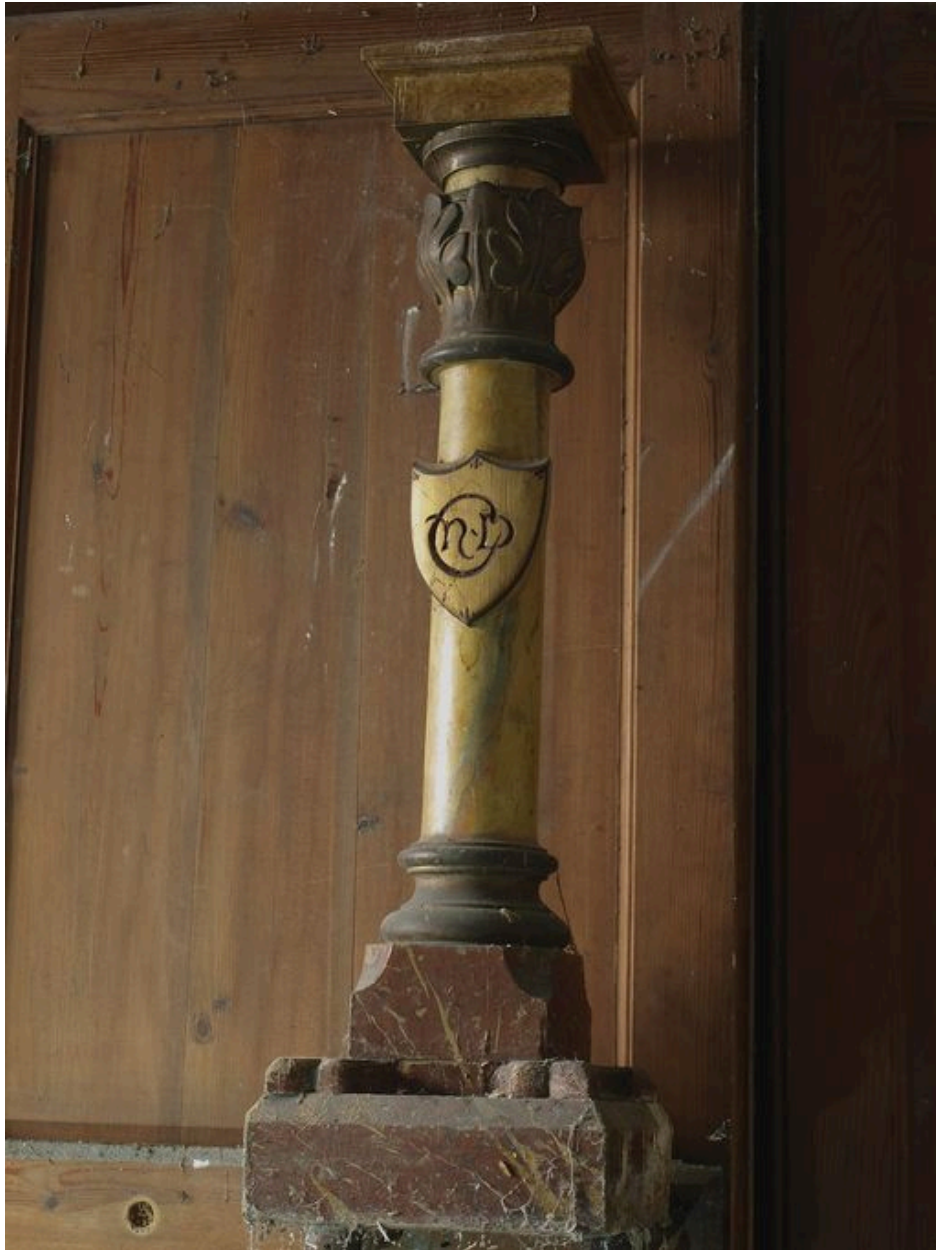
Socle avec blason et monogramme