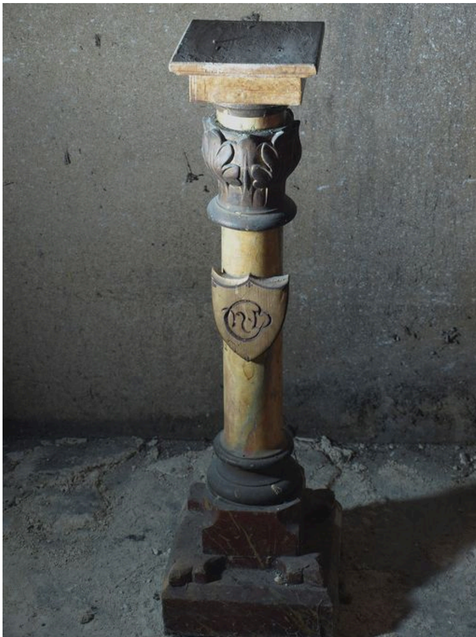
Socle avec blason et monogramme