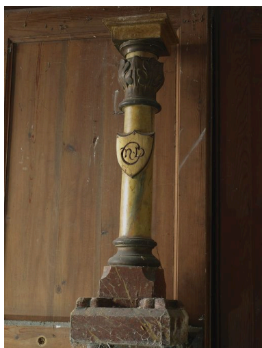
Socle avec blason et monogramme IVR31_20106202231NUCA