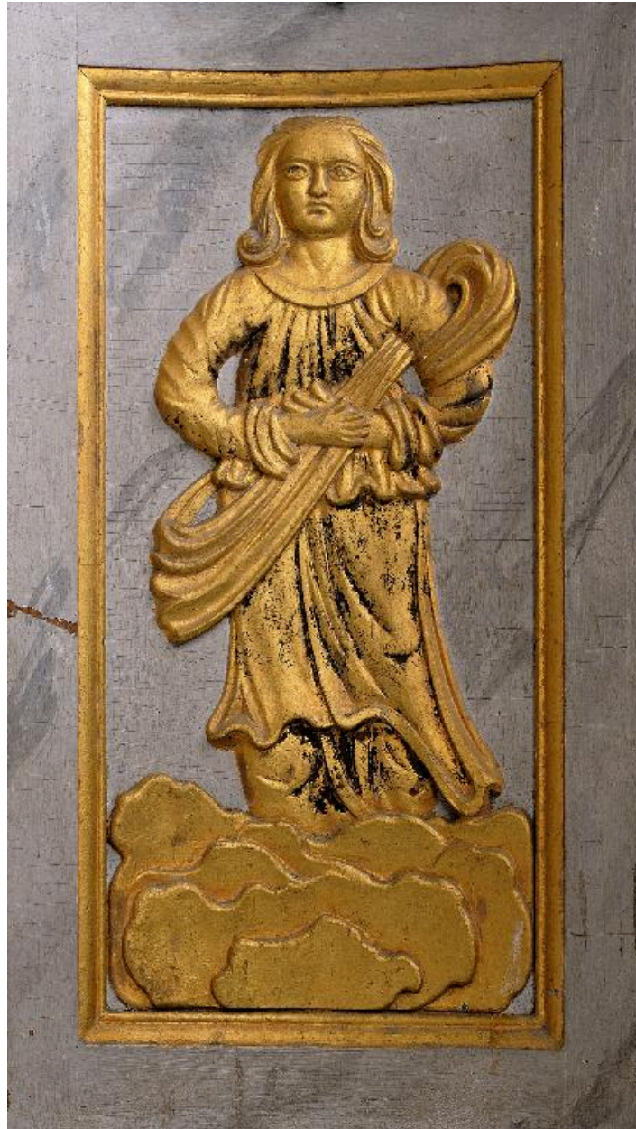
Figure féminine sur un panneau latéral du tabernacle.