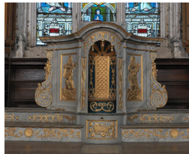
Tabernacle tournant : loge pour le rangement du ciboire.

IVR22_20148000082NUC2A