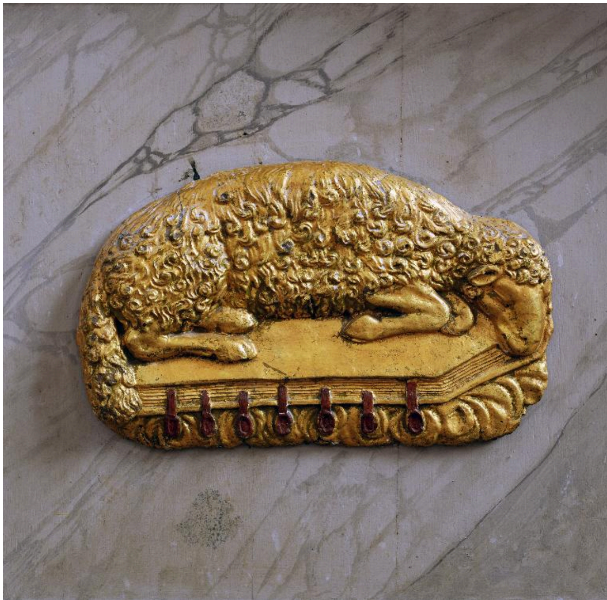
Détail du devant d'autel : agneau aux sept sceaux.