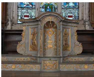
Tabernacle tournant : loge pour l'exposition de l'ostensoir.

Phot. Marie-Laure Monnehay-Vulliet IVR22_20128001344NUC2A