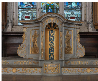
Tabernacle tournant : loge pour le rangement de l'ostensoir.

Phot. Marie-Laure Monnehay-Vulliet IVR22_20128001346NUC2A