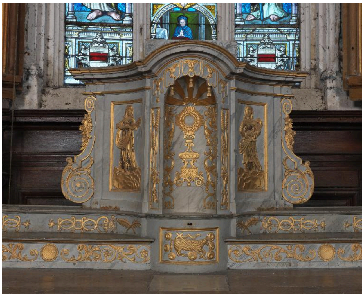
Tabernacle tournant : loge pour l'exposition de l'ostensoir.