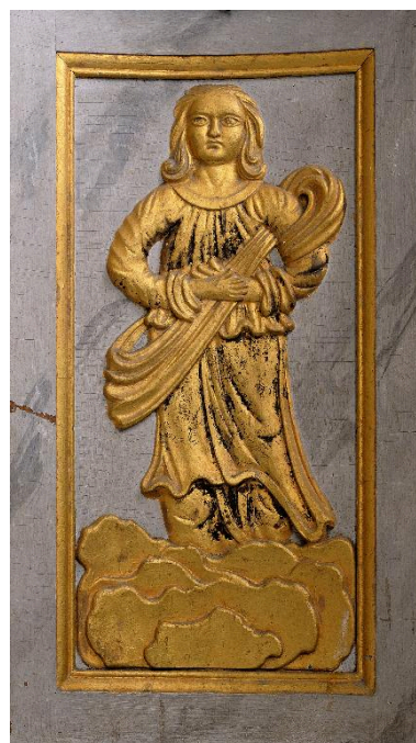
Figure féminine sur un panneau latéral du tabernacle.

IVR22_20128001345NUC2A