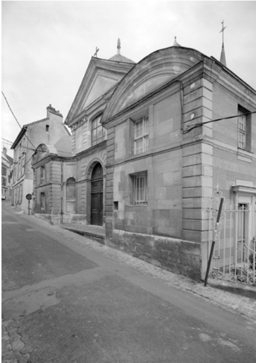
Façade de la chapelle sur la rue du Château.