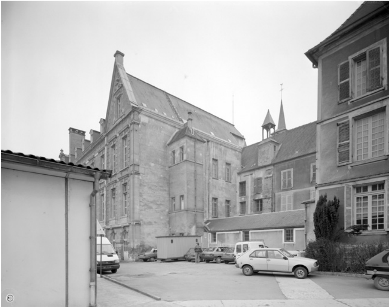
L'ancien bâtiment de la communauté des religieuses.