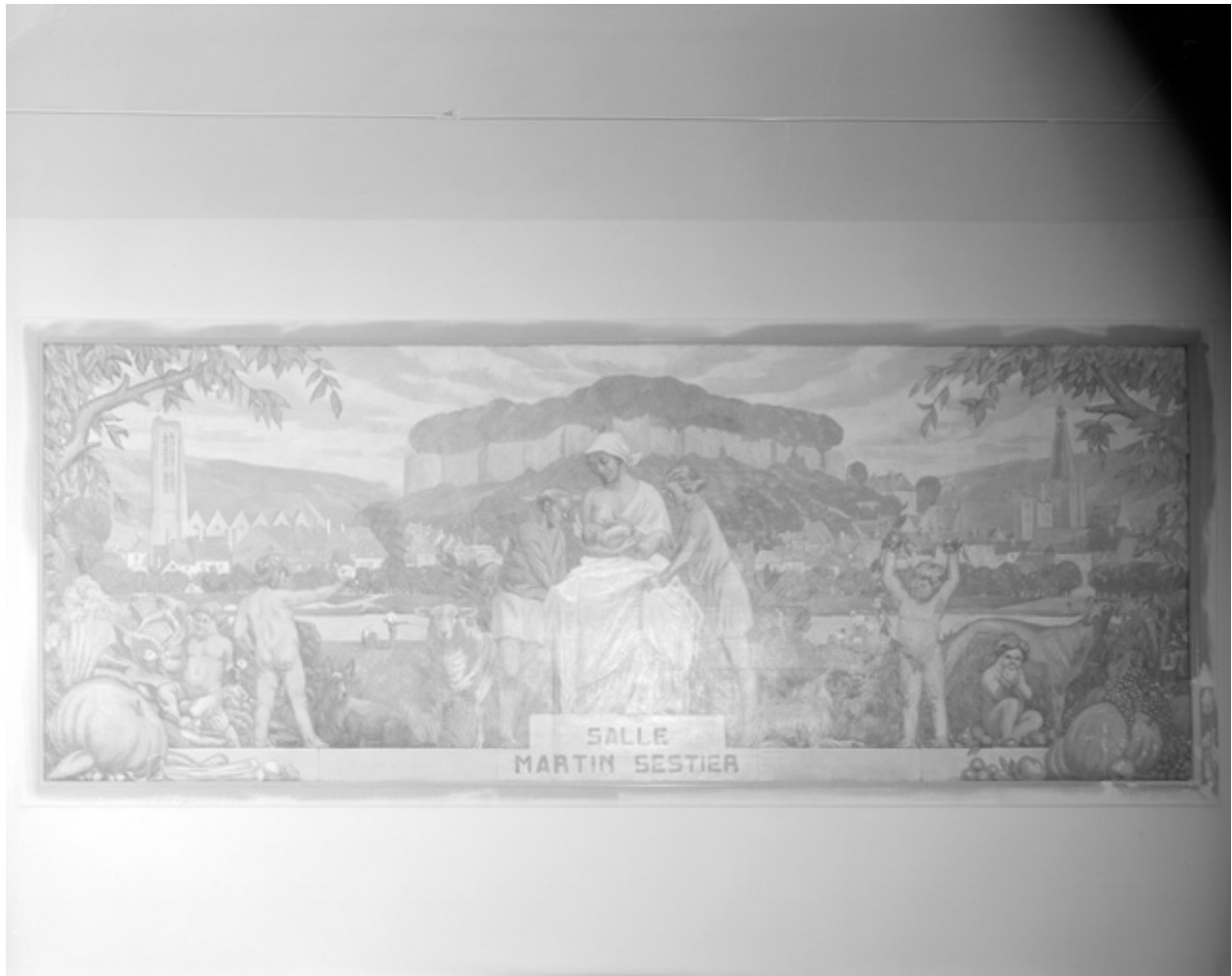
Oeuvre de Ladureau, 1937.