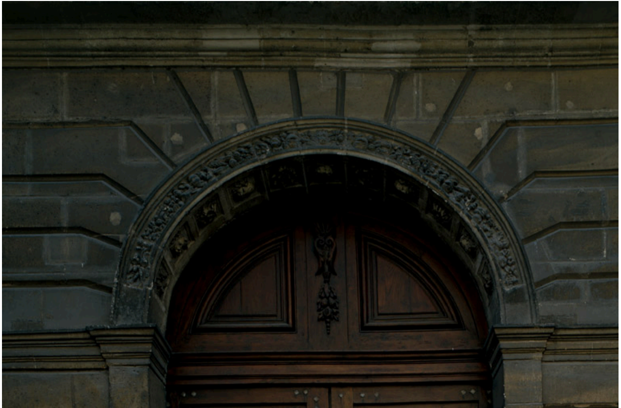
Le décor sculpté de l'arc surmontant la porte de la chapelle.