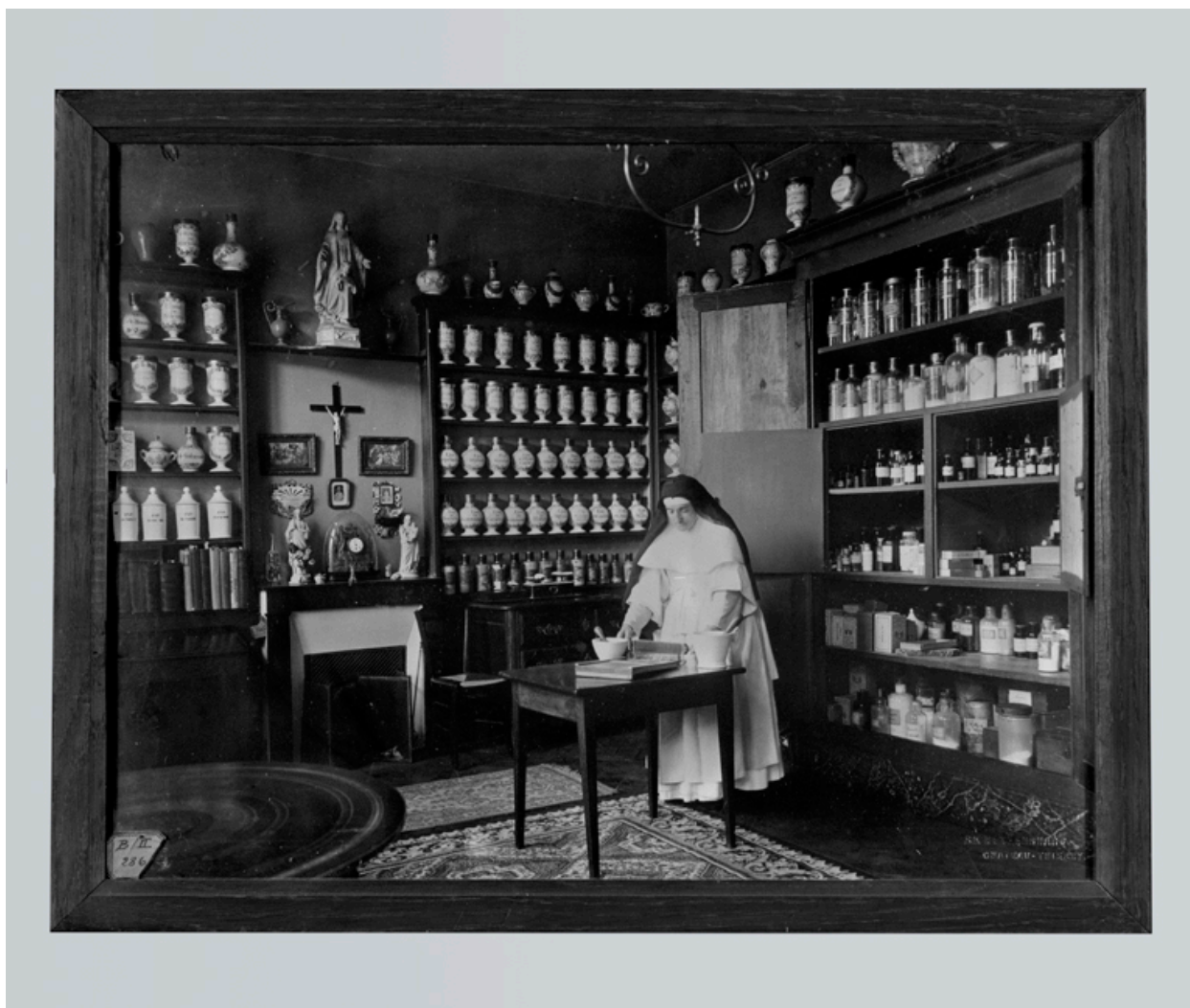
La pharmacie de l'Hôtel Dieu au début du siècle.