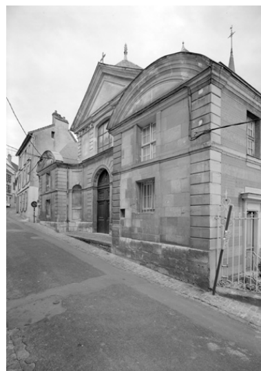
Façade de la chapelle sur la rue du Château.