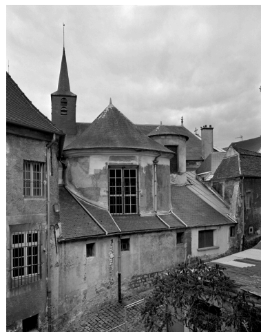
Les toitures de la chapelle.