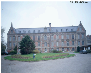
Façade méridionale du bâtiment achevé en 1879.