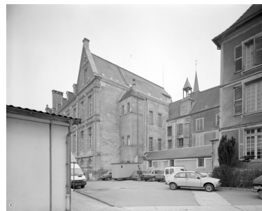
L'ancien bâtiment de la communauté des religieuses.