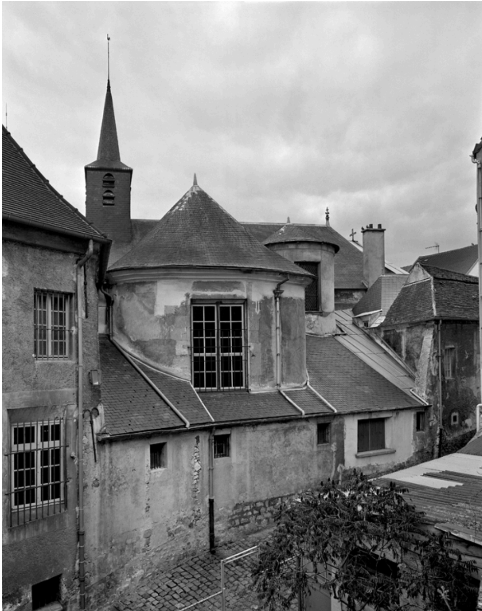
Les toitures de la chapelle.