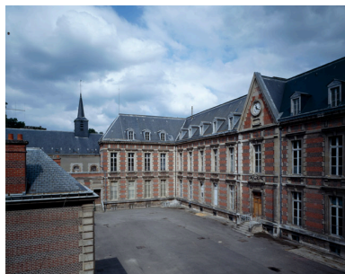
Le bâtiment de 1879, côté cour.