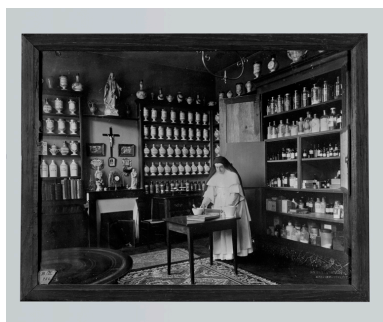
La pharmacie de l'Hôtel Dieu au début du siècle