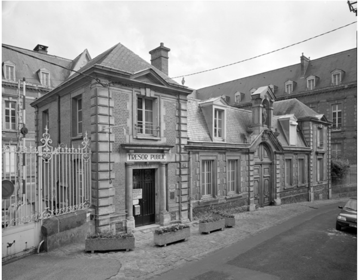
Le pavillon d'entrée sur la rue du Château.