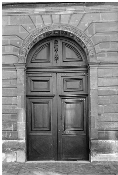
Le portail de la chapelle.