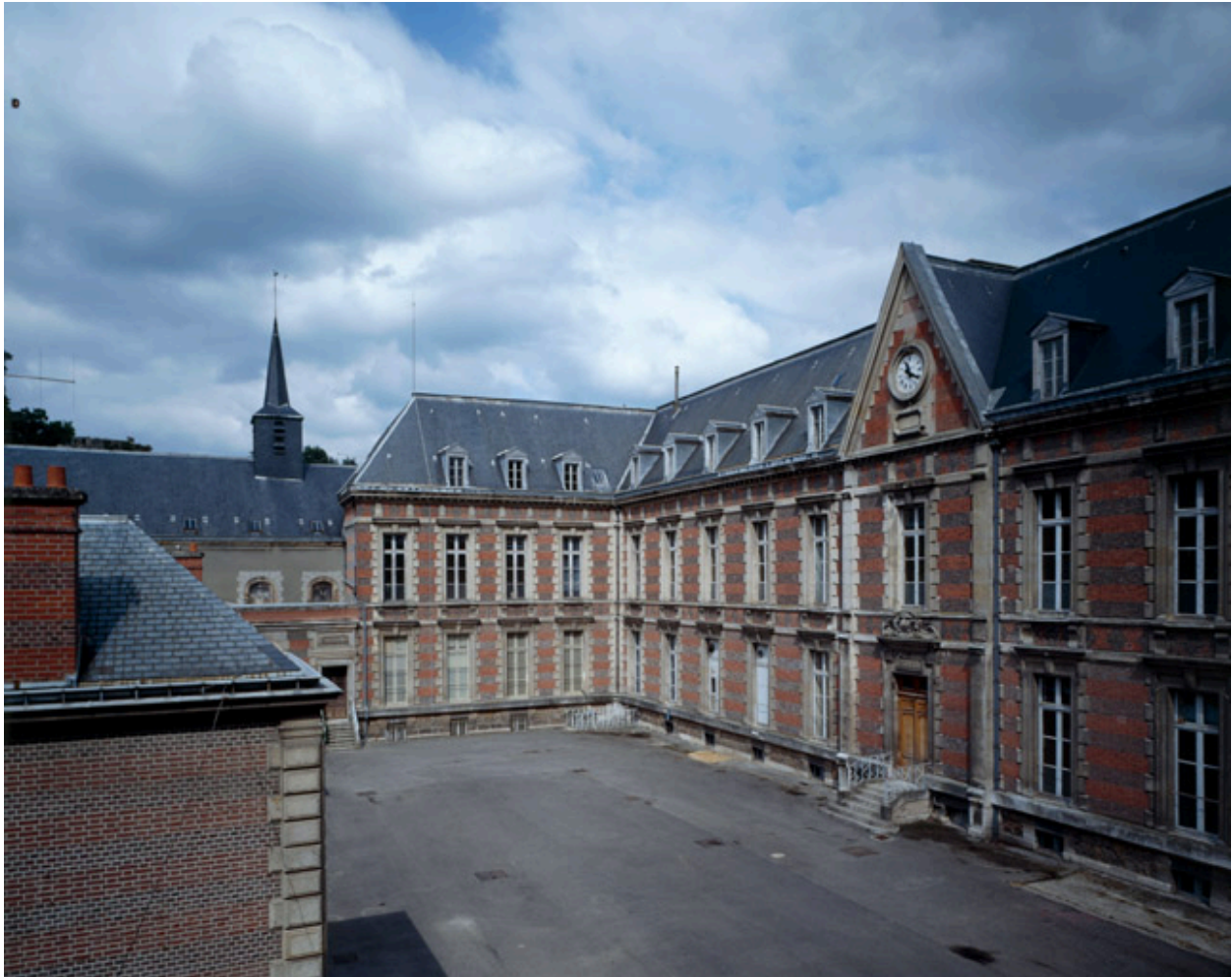
Le bâtiment de 1879, côté cour.