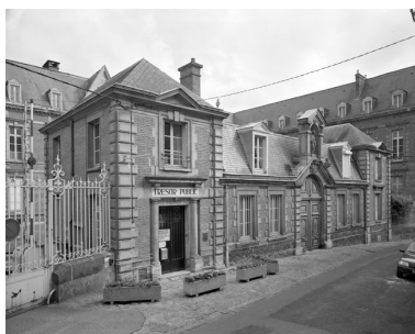
Le pavillon d'entrée sur la rue du Château.