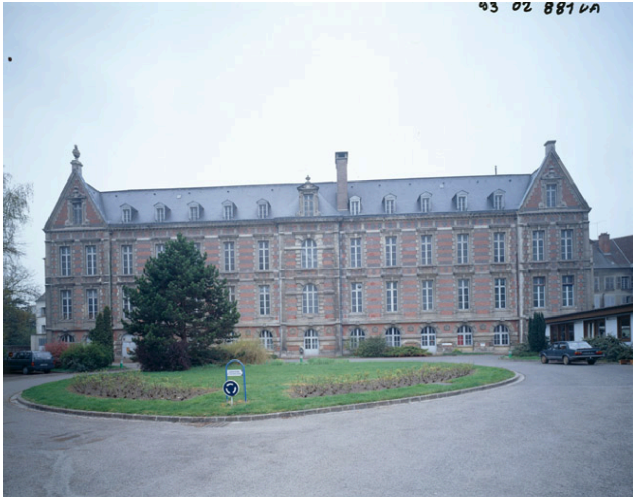
Façade méridionale du bâtiment achevé en 1879.