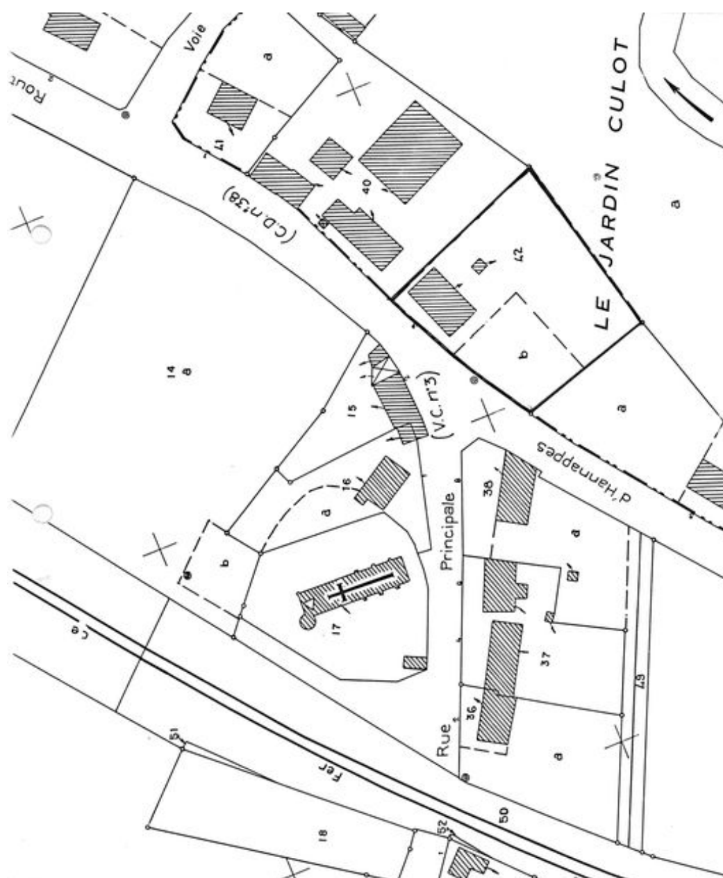
Plan de situation. Extrait du plan cadastral de 1986, section ZB.