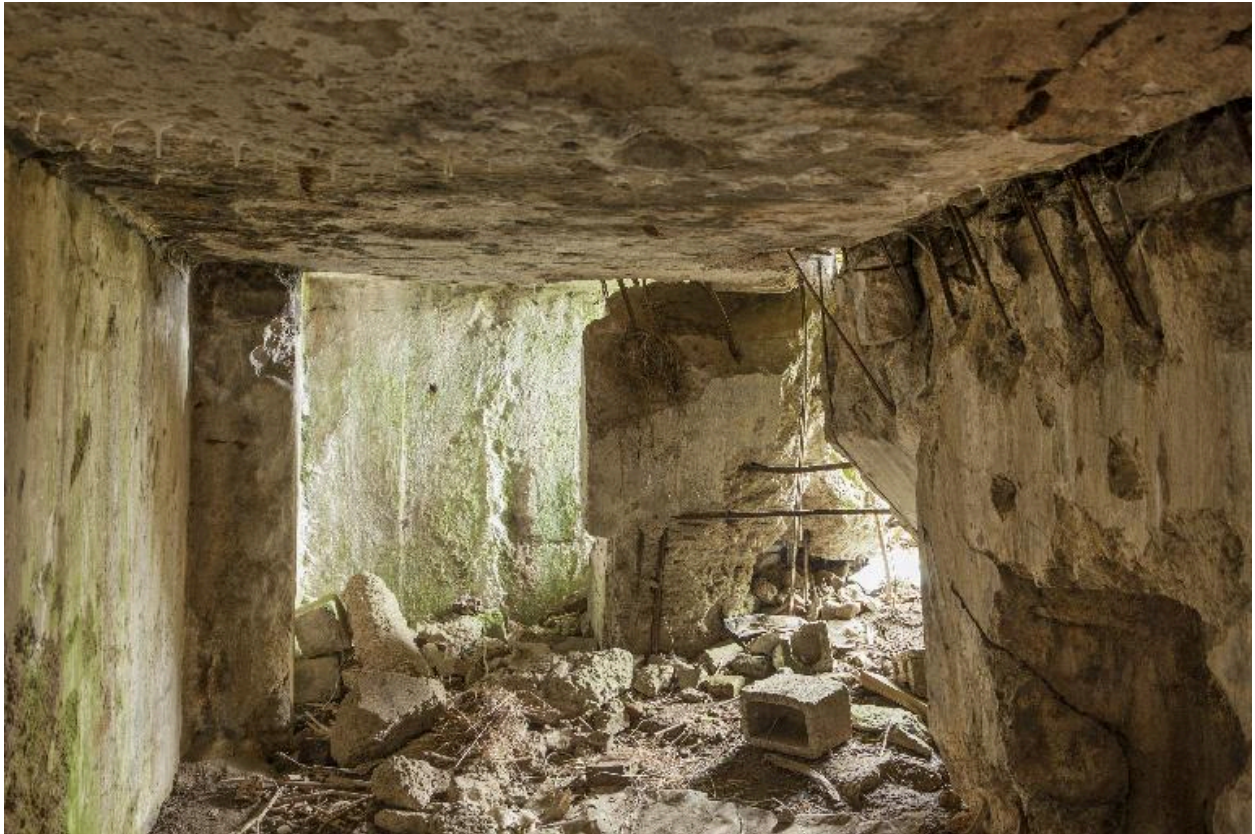
Casemate b. Casemate Vue intérieure, vers l'entrée.