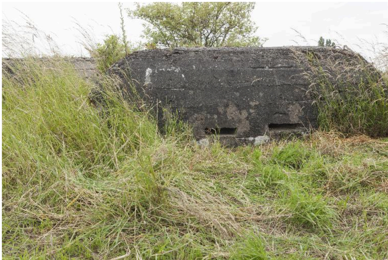
Casemate b. Elévation nord-ouest. Embrasures de surveillance