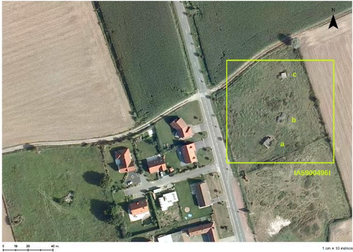
Situation des 3 casemates (a, b et c) sur une photographie aérienne de 2009