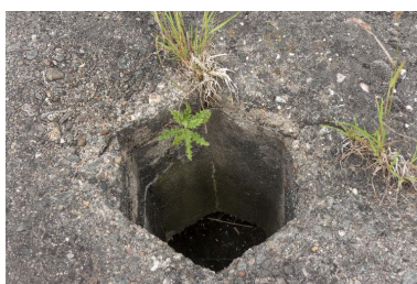
Casemate b. Cheminée du périscopier sur le couvrement IVR31_20145905596NUCA