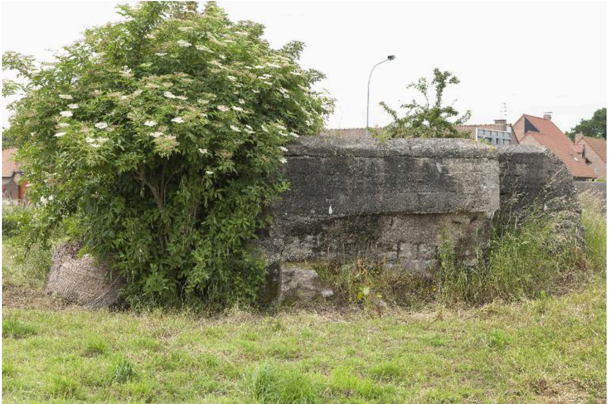
Casemate a, vers le sud-ouest