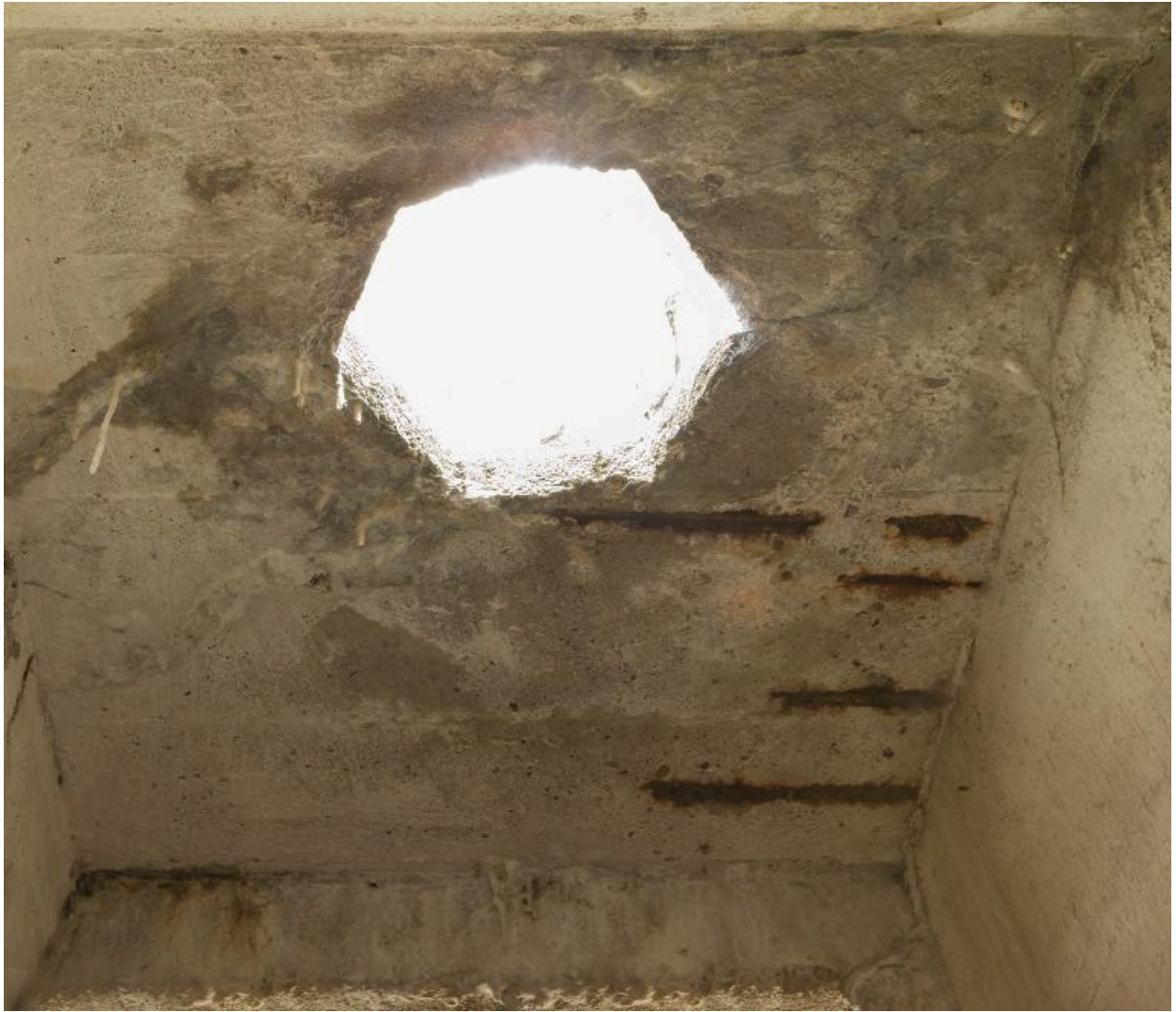
Casemate b. Vue intérieure de l'observatoire bétonné. Passage du périscope.