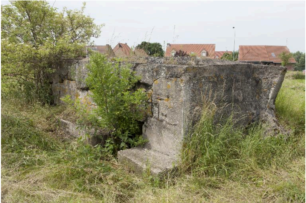
Casemate b. Banquette de tir, vers sud-ouest