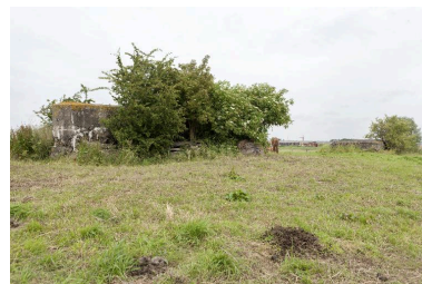
Casemates a, à gauche et b, vers le nord