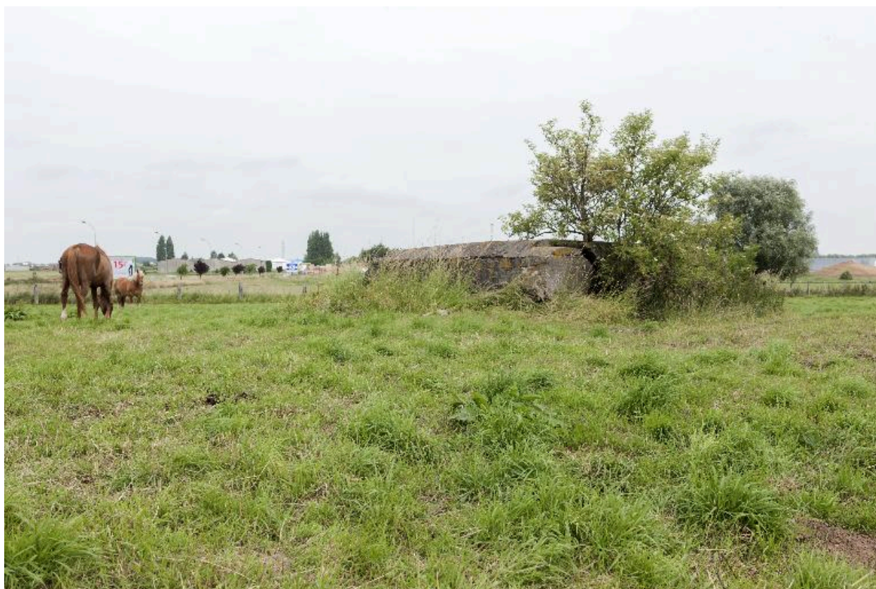
Casemate a, vers le nord-est