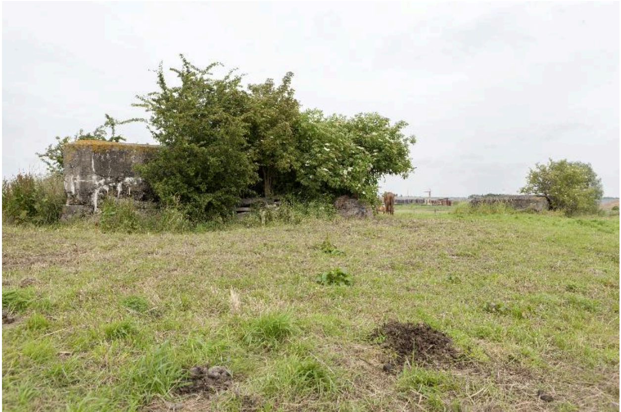
Casemates a, à gauche et b, vers le nord