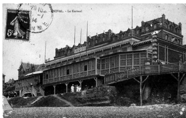
Le casino après son agrandissement, carte postale, 1er quart 20e siècle (coll. part.). IVR22_20008000300ZAB