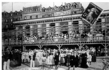
Le Kursaal lors de son inauguration, carte postale, 1er quart 20e siècle (coll. part.). IVR22_20008000303ZAB