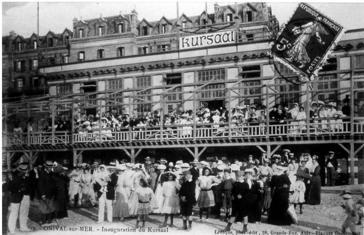
Le Kursaal lors de son inauguration, carte postale, 1er quart 20e siècle.