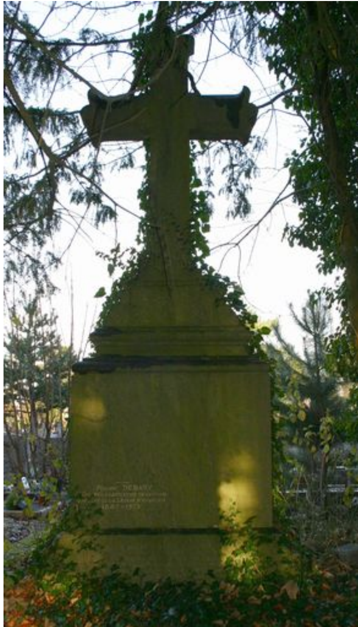
Stèle à croix.