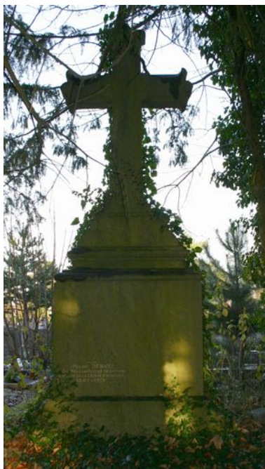
Stèle à croix.