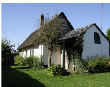
Vue générale de la maison.

Phot. Monnehay-Vulliet Marie-Laure IVR22_20068005114XAB