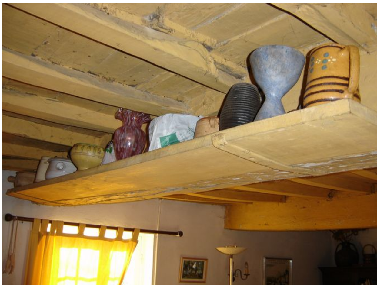
Vue de l'étagère fixée au plafond du salon.