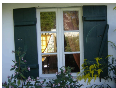
Vue détaillée d'un contrevent et de l'huissierie d'origine de la fenêtre.