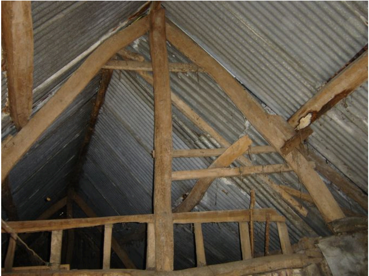
Vue détaillée de la charpente des dépendances.