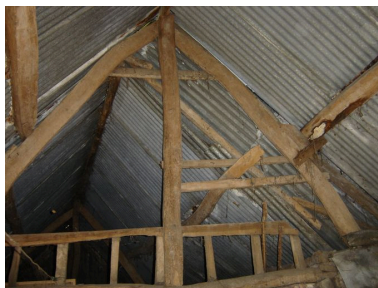
Vue détaillée de la charpente des dépendances. IVR22_20068005127NUCA