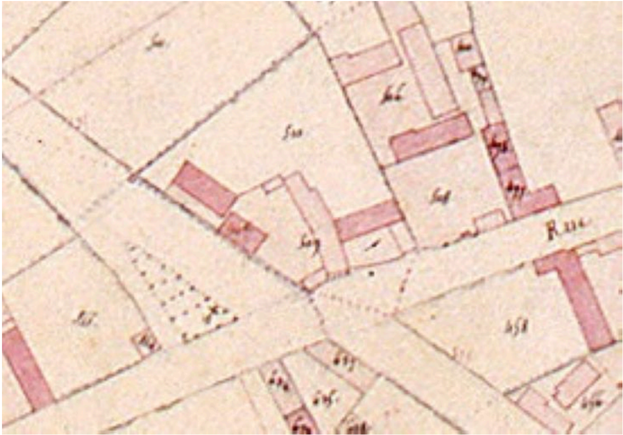
Détail de la section sur le cadastre napoléonien.