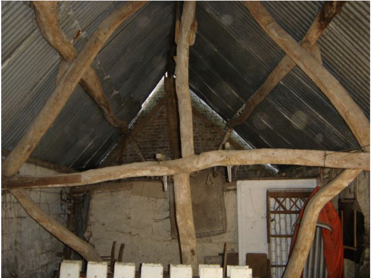
Vue d'une autre ferme de charpente.