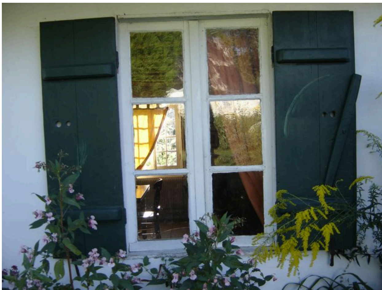
Vue détaillée d'un contrevent et de l'huissierie d'origine de la fenêtre.