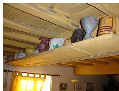
Vue de l'étagère fixée au plafond du salon.