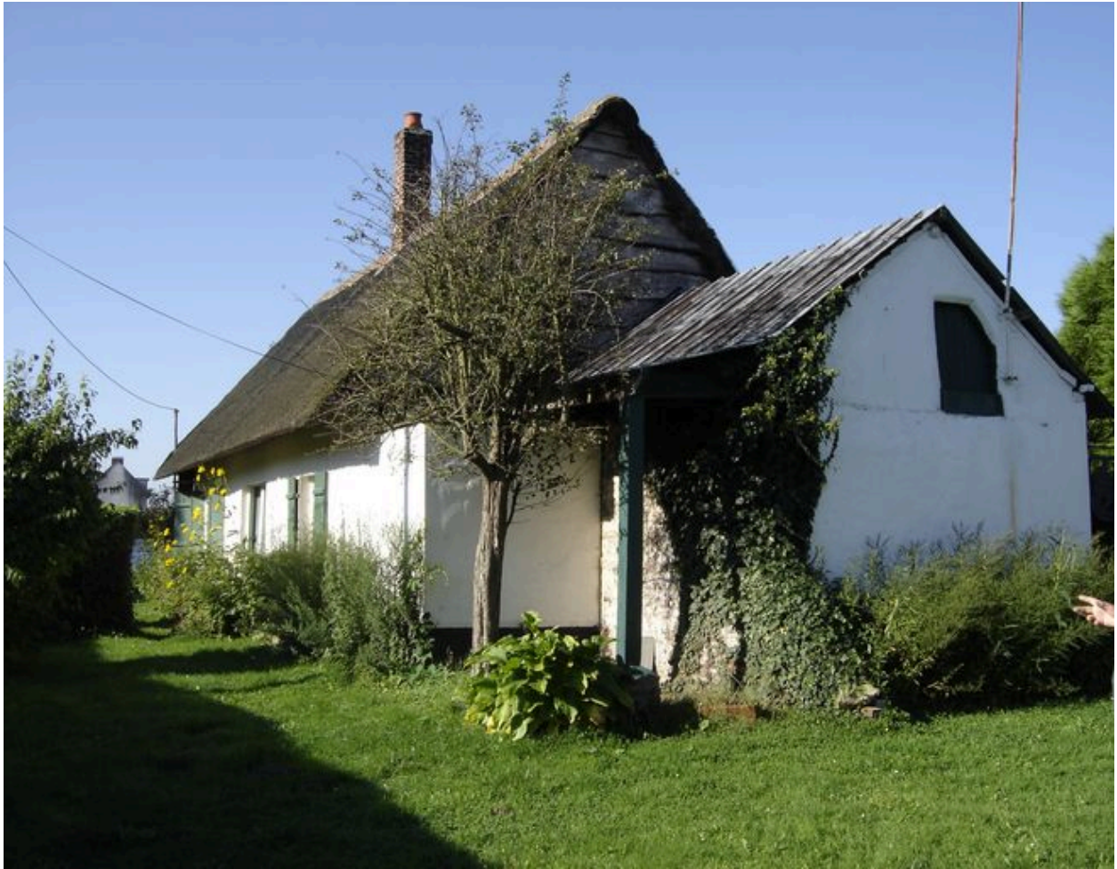
Vue générale de la maison.