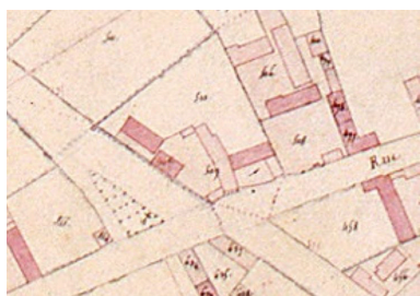
Détail de la section sur le cadastre napoléonien.

IVR22_20068005114XAB