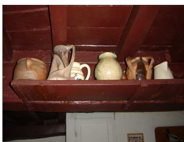
Tablette fixée au plafond pour la conservation des pots.