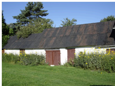
Vue des dépendances. IVR22_20068005126NUCA