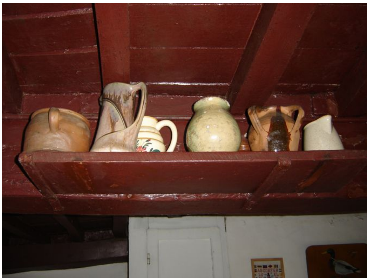
Tablette fixée au plafond pour la conservation des pots.