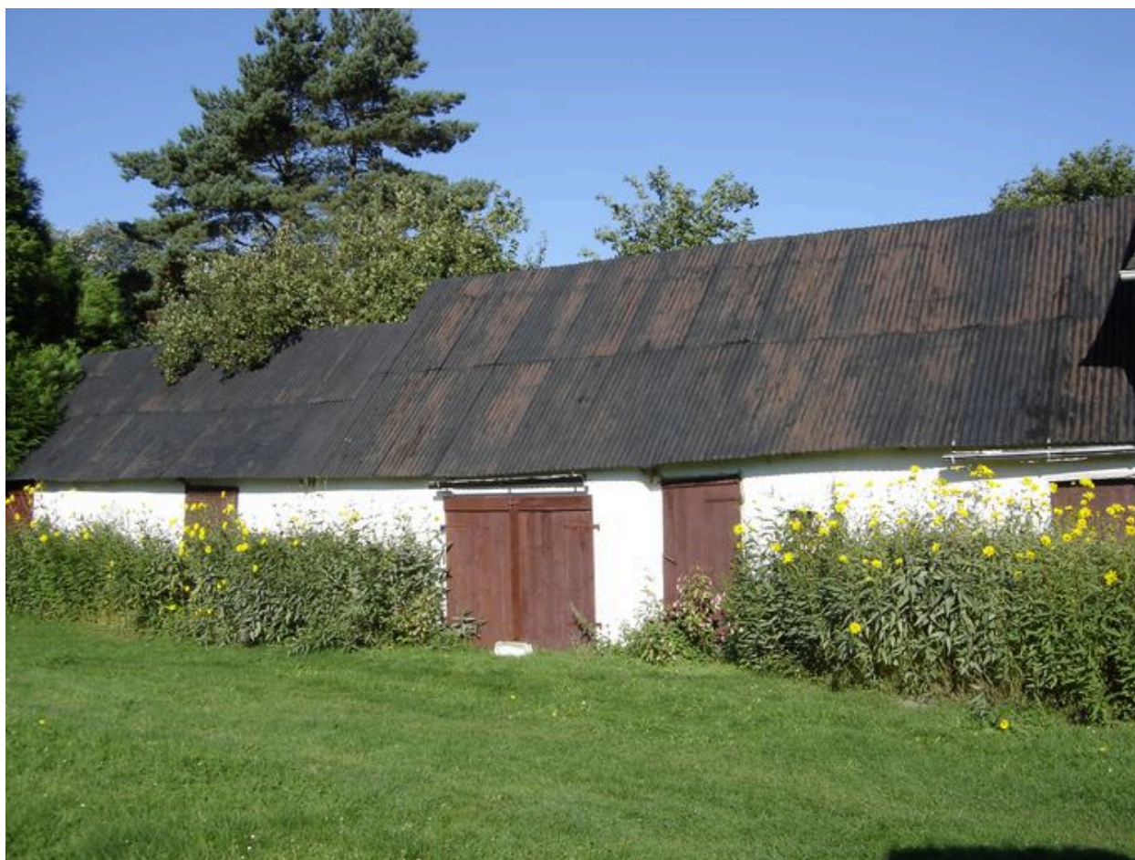
Vue des dépendances.