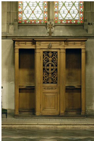
Vue générale. IVR22_20058001838NUCA