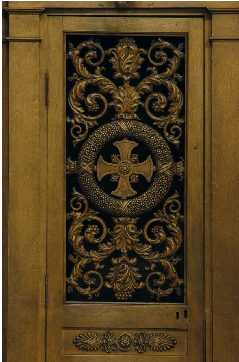
Détail de la porte.