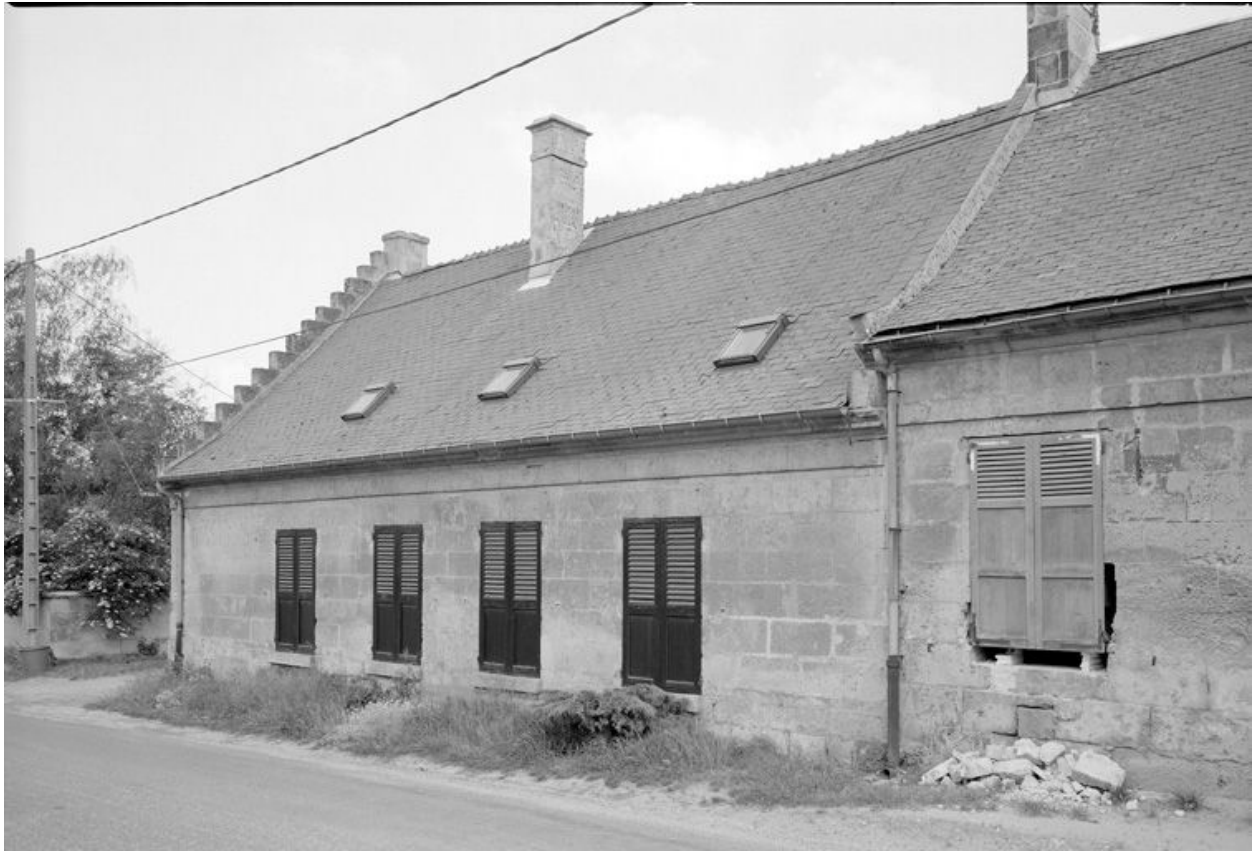
Logis. Elévation sur rue.