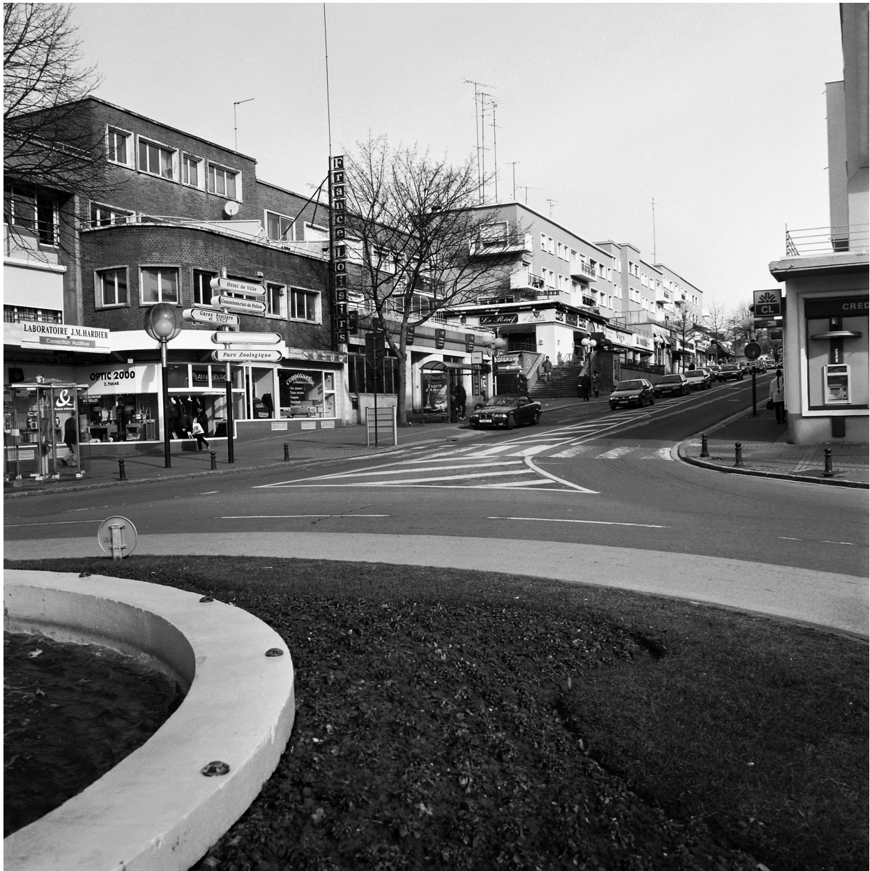
Vue générale de l'immeuble depuis l'avenue Jean-Mabuse