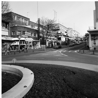
Vue générale de l'immeuble depuis l'avenue Jean-Mabuse IVR31_20035900283X