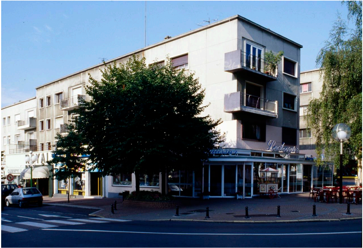
Vue de l'immeuble prise depuis le nord.