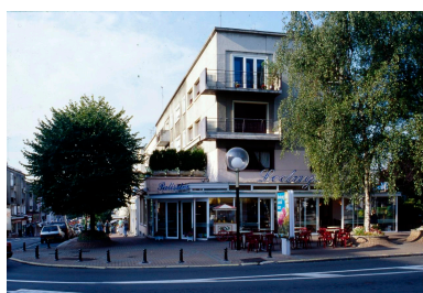
Vue de l'élévation Nord de l'immeuble prise depuis la place des Nations.