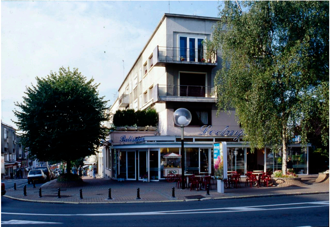
Vue de l'élévation Nord de l'immeuble prise depuis la place des Nations.