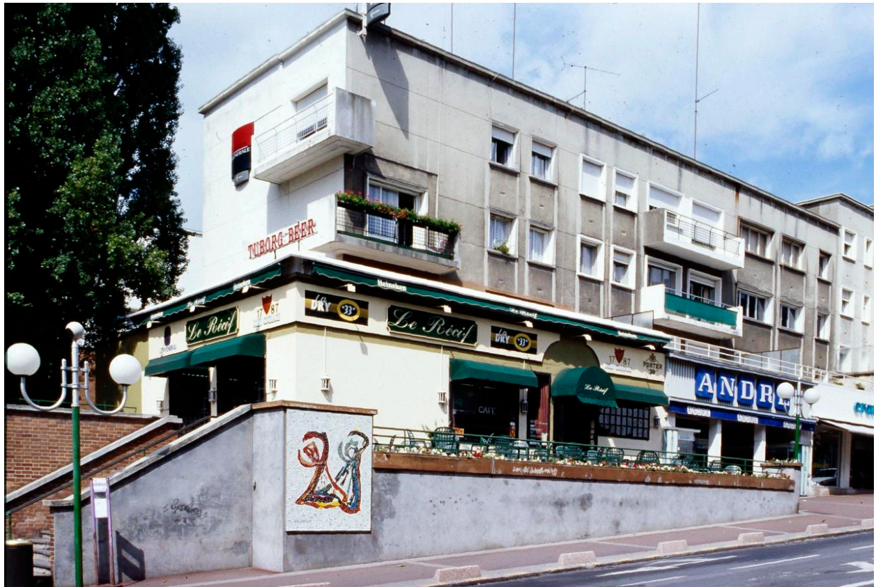
Vue de la partie sud de l'immeuble.