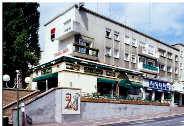
Vue de la partie sud de l'immeuble.