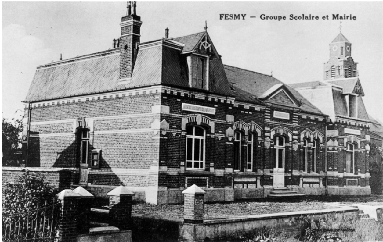
Vue sud-ouest, carte postale, [2e quart 20e siècle] (coll. part.).