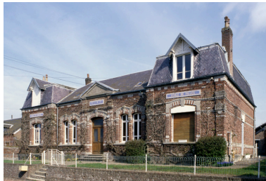
Vue générale sud-est.