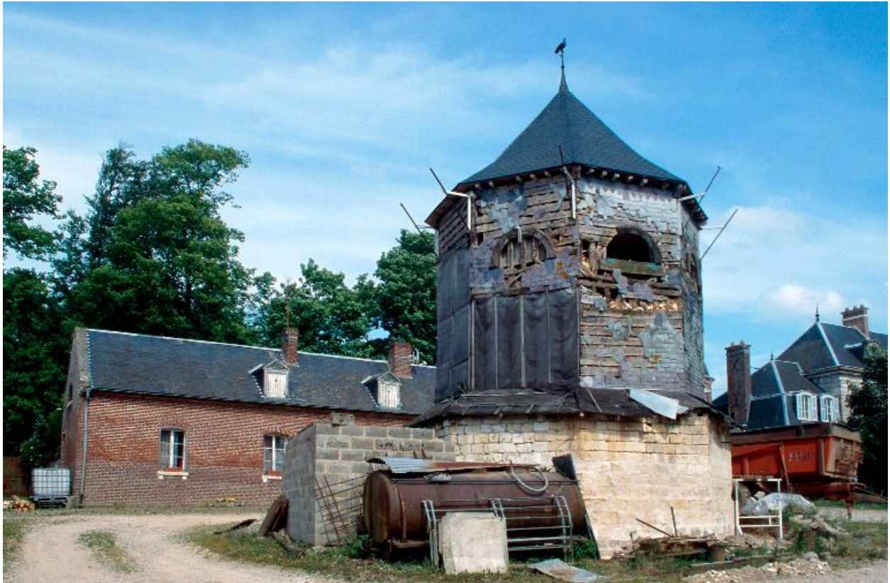
Ferme du château. Le pigeonnier.