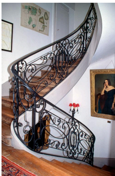
Vue de l'escalier intérieur.