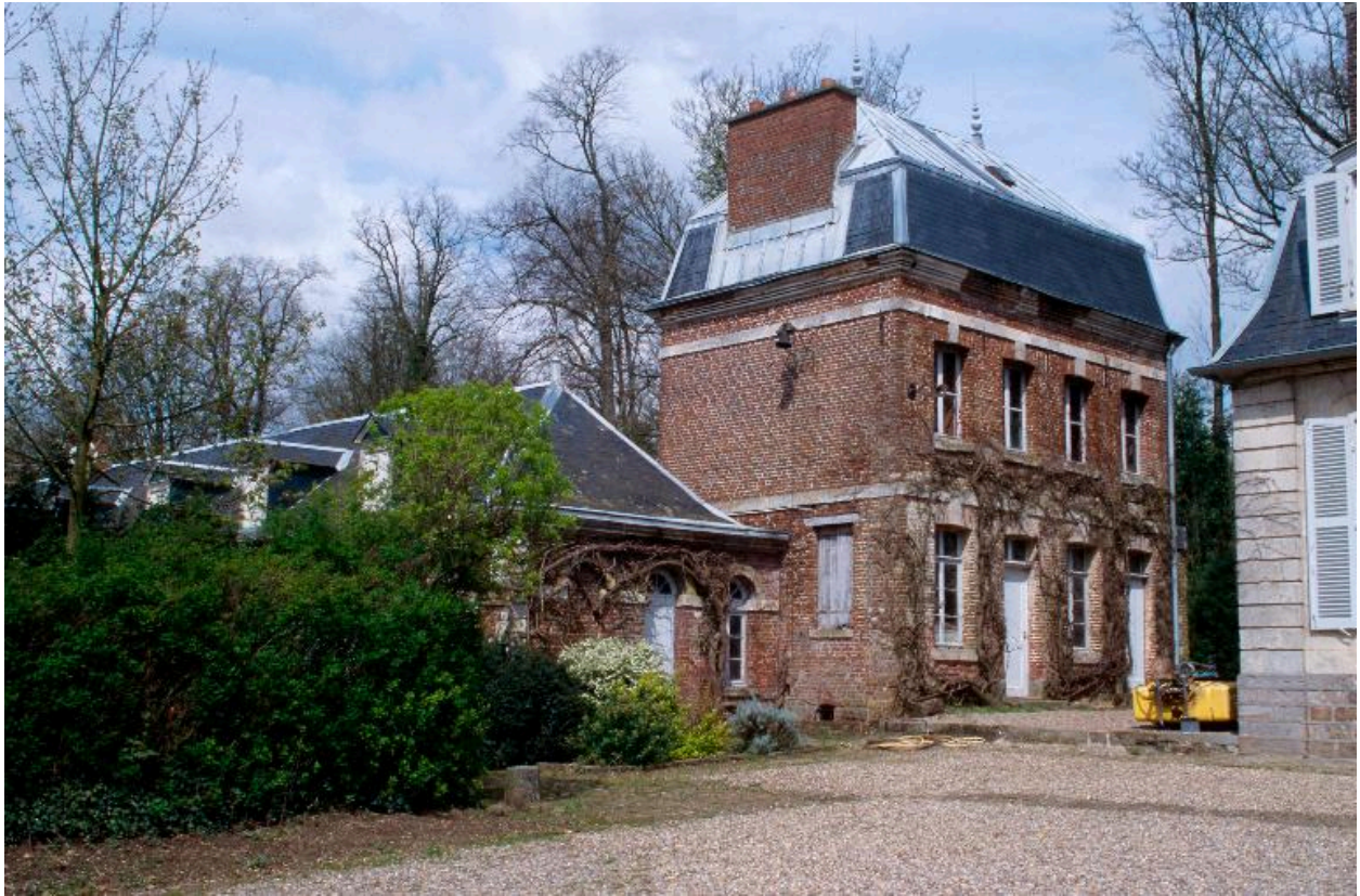
Communs en brique, au nord du château.