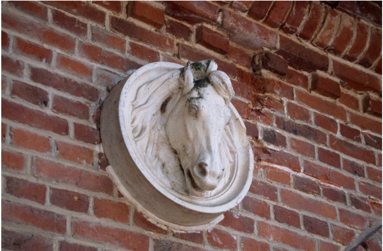
Ferme du château. Détail des écuries : médaillon avec tête de cheval.