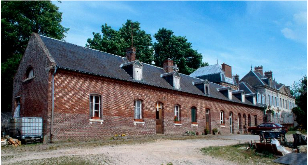
Ferme du château. Le logis.