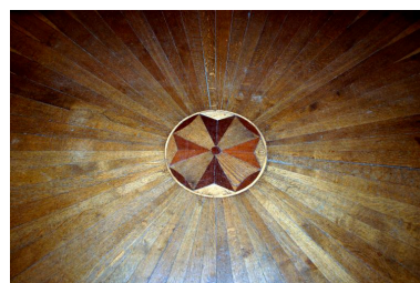
Décor en marquetterie sur le plancher du salon. IVR22_20018000084ZA