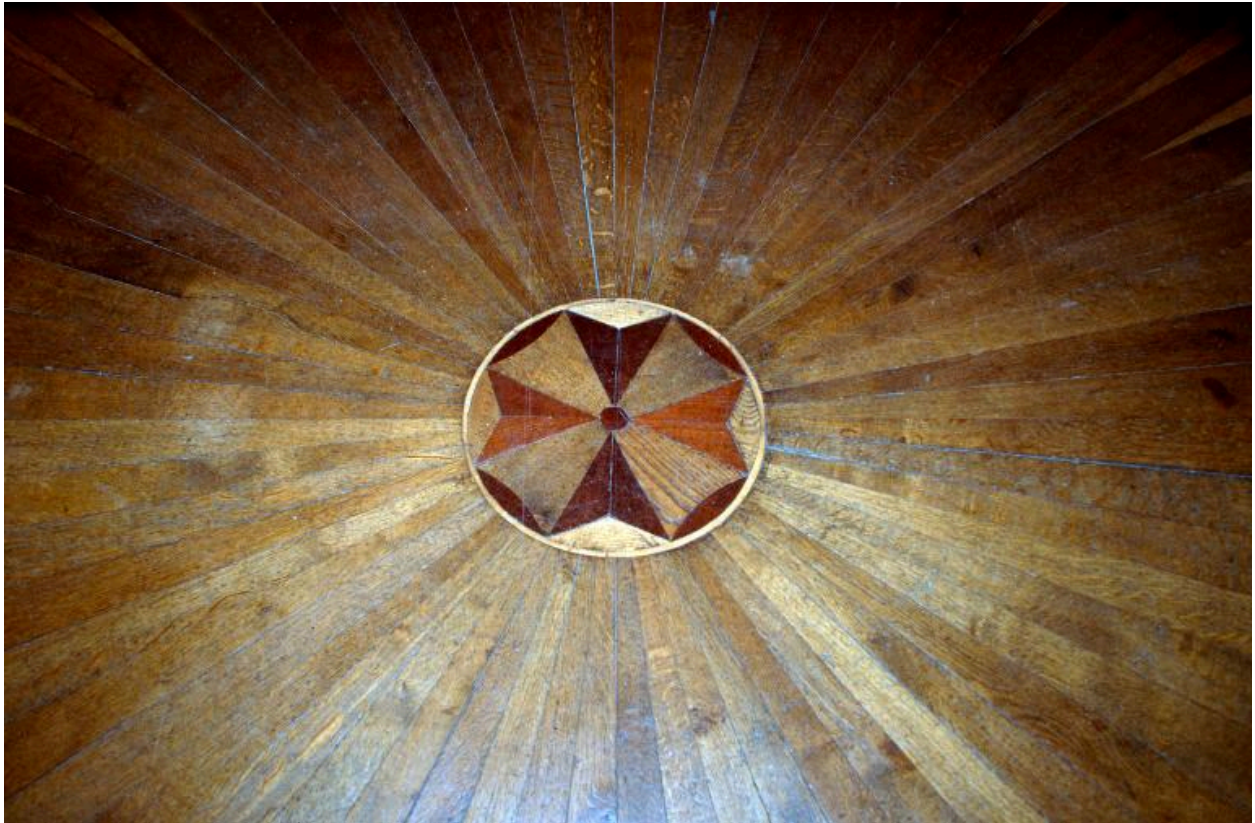
Décor en marquetterie sur le plancher du salon.