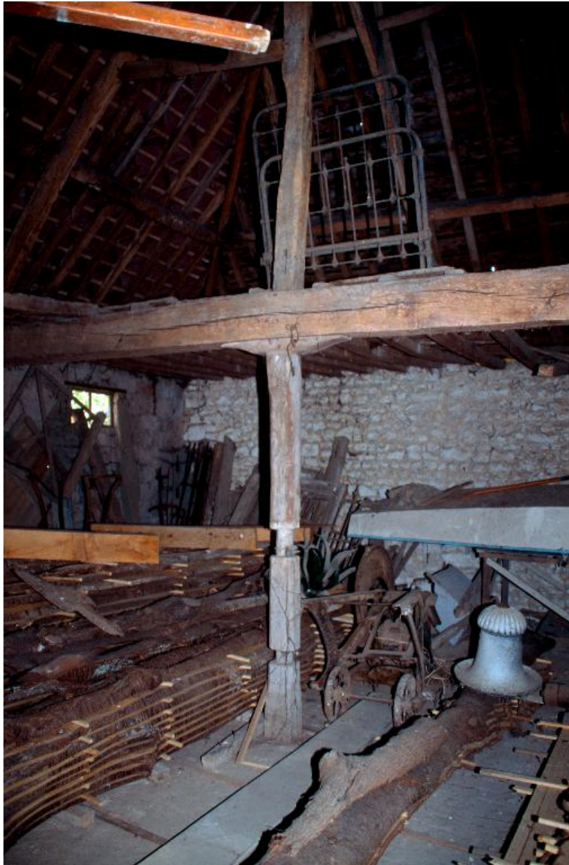
Vue du pressoir (1787), dans le bâtiment ouest.