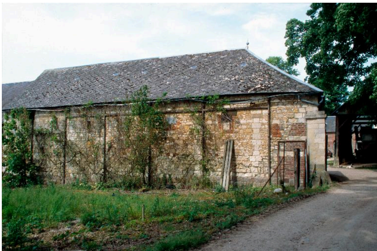
Ferme du château. Les écuries à l'entrée : élévation sur rue.