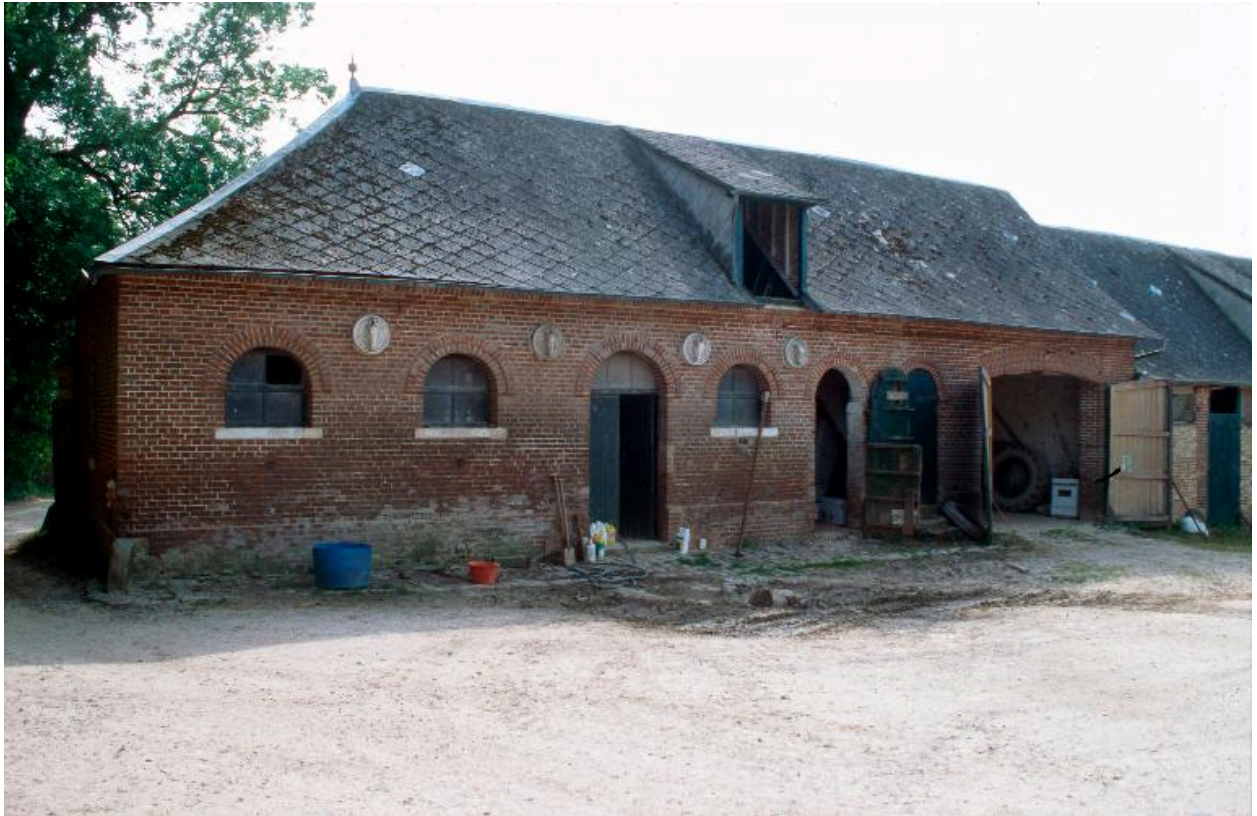
Ferme du château. Les écuries à l'entrée : élévation sur cour.