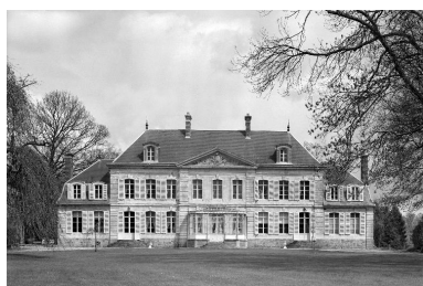
Façade antérieure.