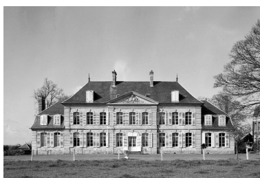
Façade postérieure.