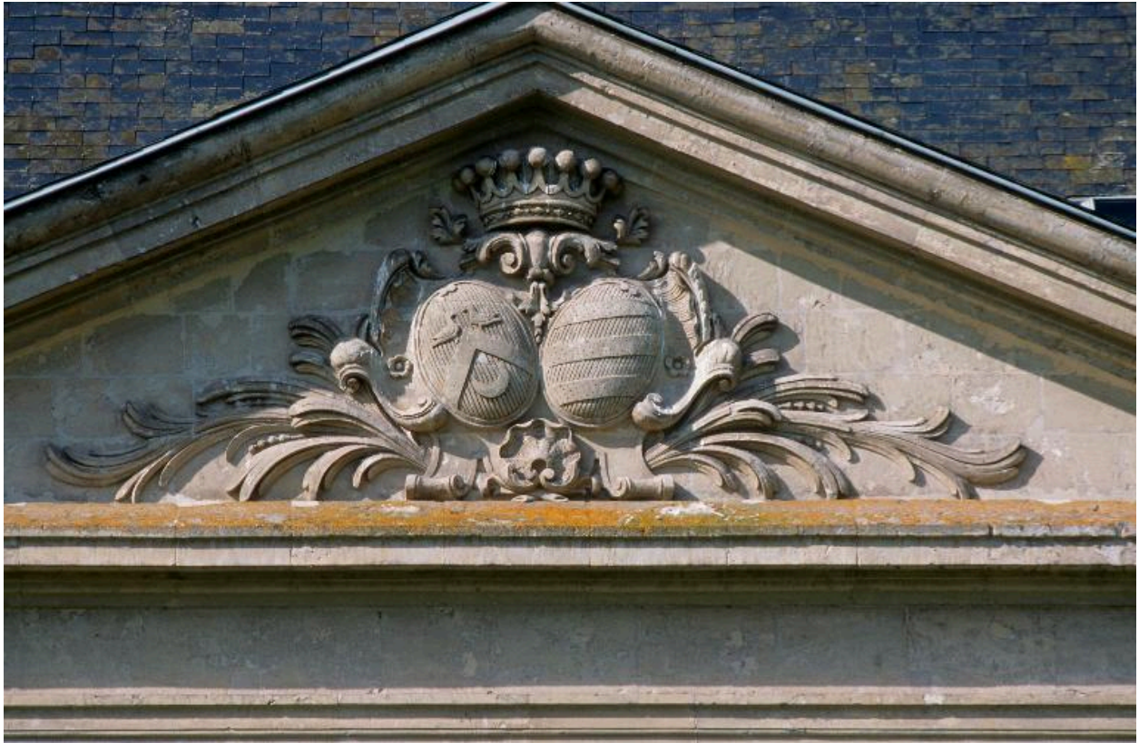
Armoiries de Monclin et d'Aquin sculptées au fronton de la façade postérieure.