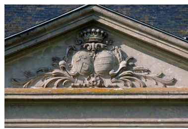
Armoiries de Monclin et d'Aquin sculptées au fronton de la façade postérieure.