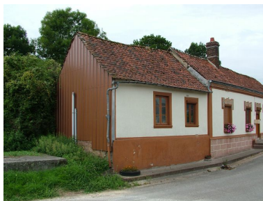
Vue générale. IVR22_20098005261NUCA