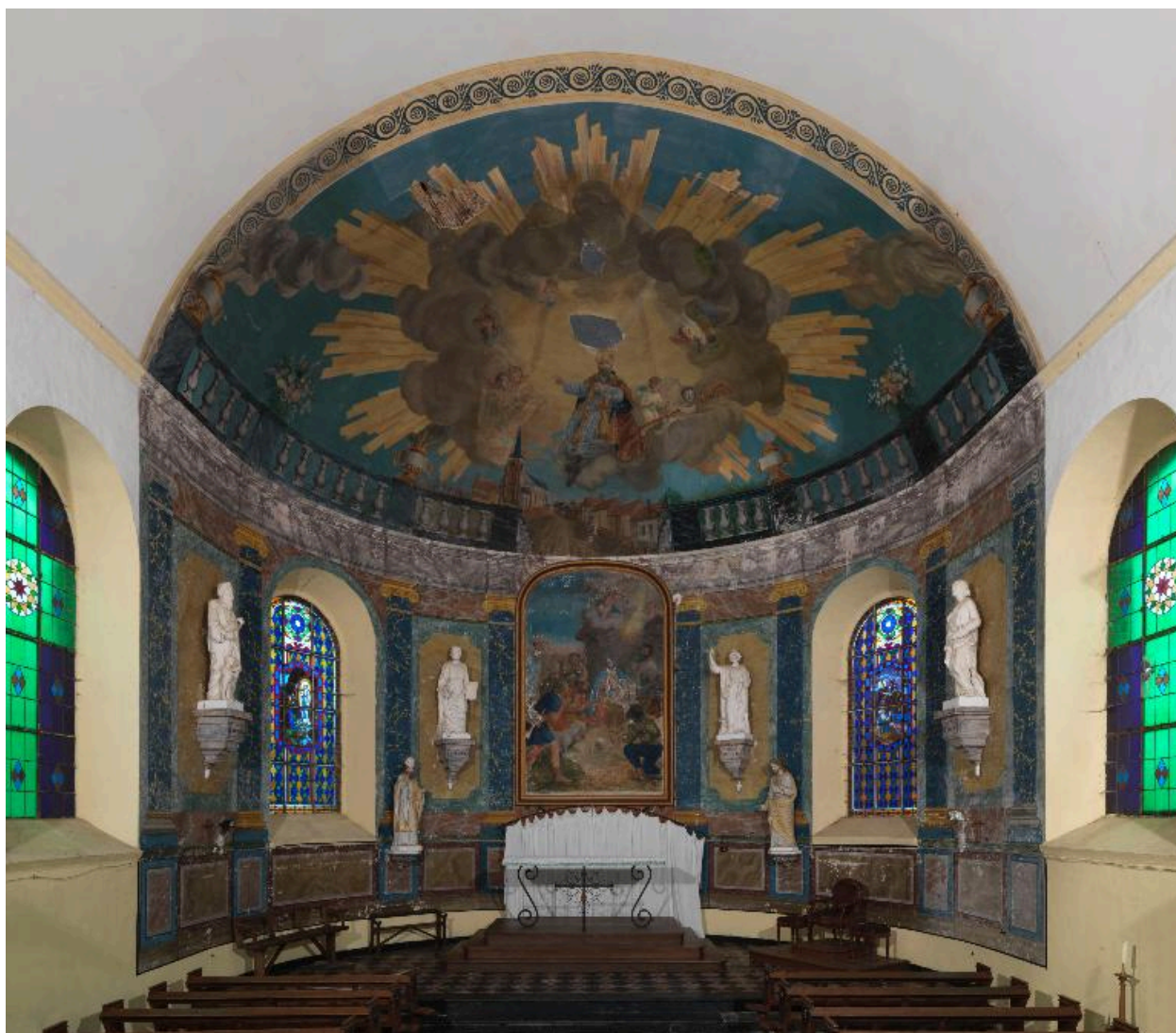
Vue générale du choeur.