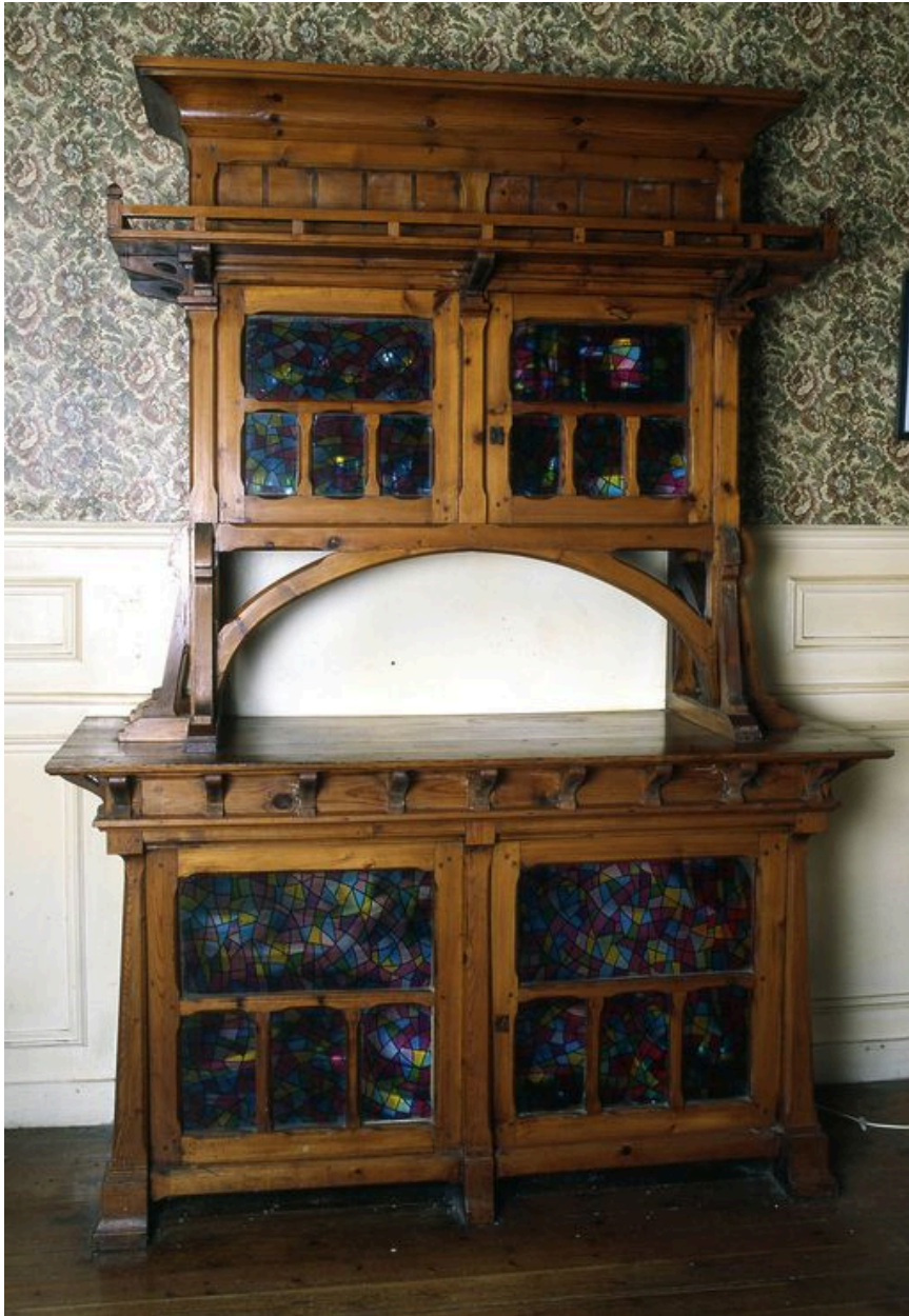
Buffet du 'hall'.