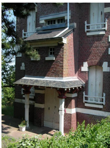
Détail du porche d'entrée.