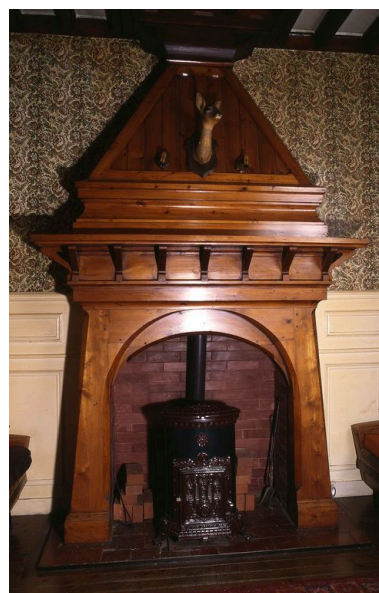
Cheminée du 'hall' ou pièce de réception.