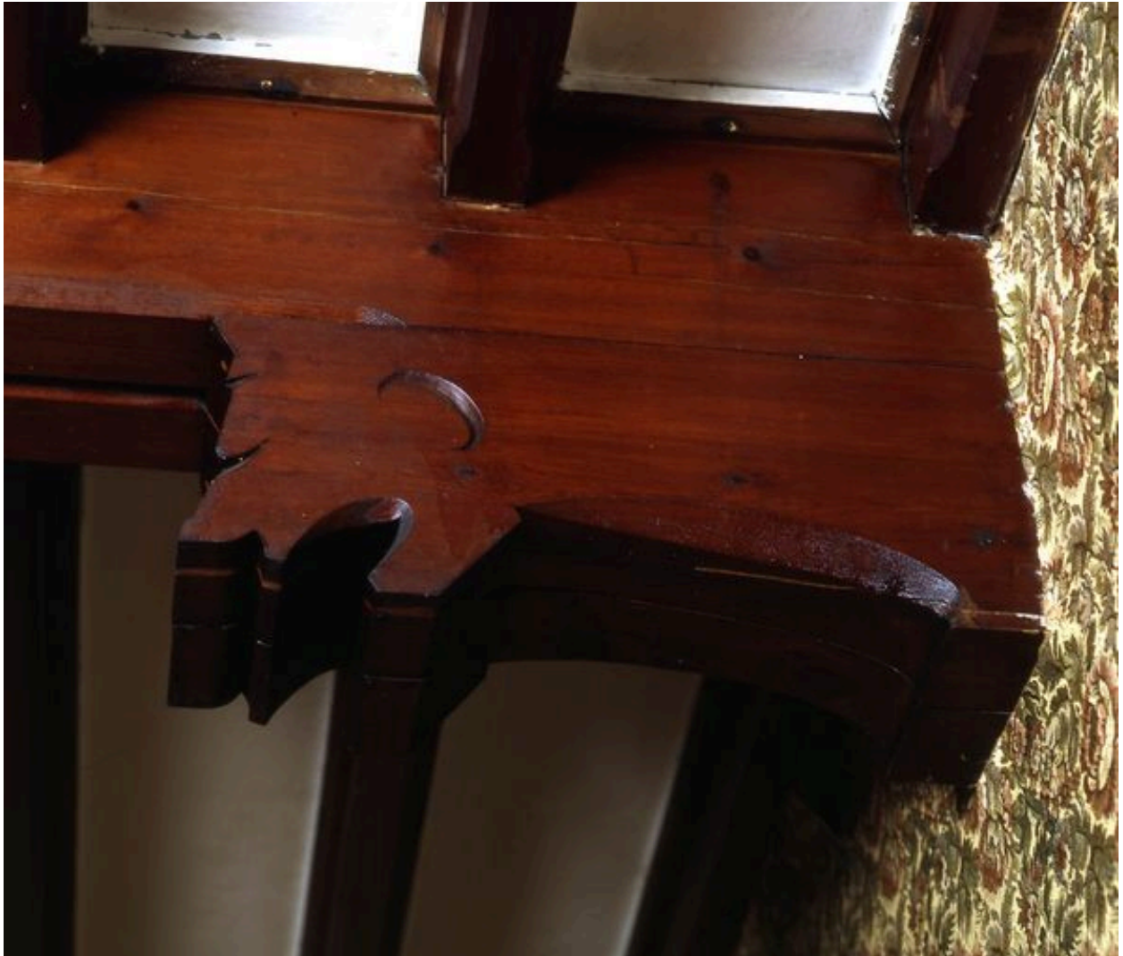
Détail d'une console du 'hall' figurant un animal.