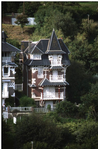
Elévation côté mer. IVR22_20048000181ZA