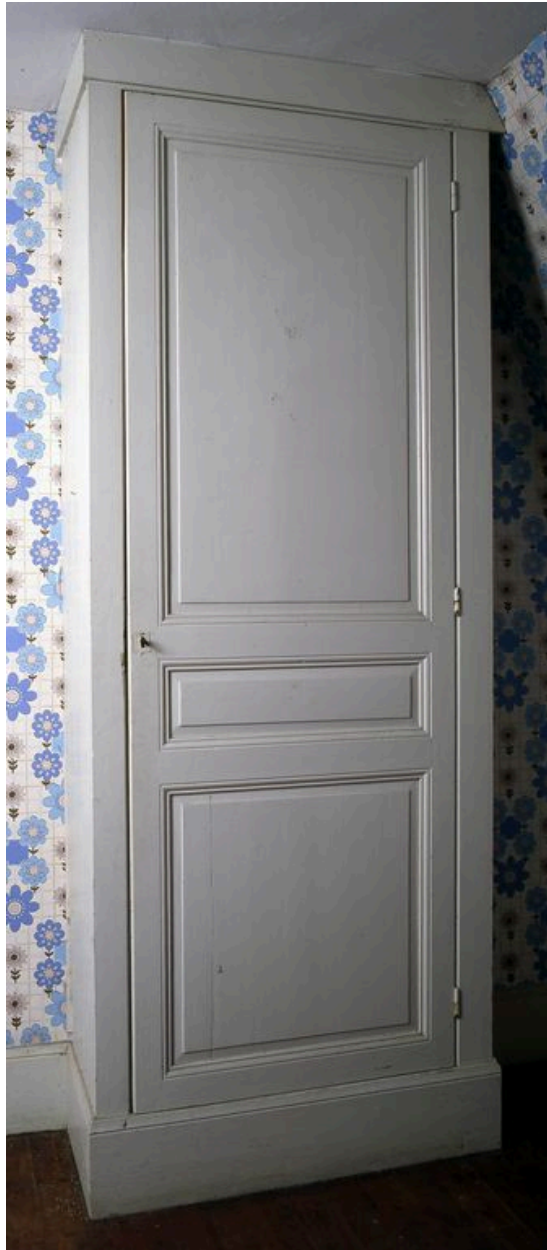
Détail d'un placard d'une chambre.