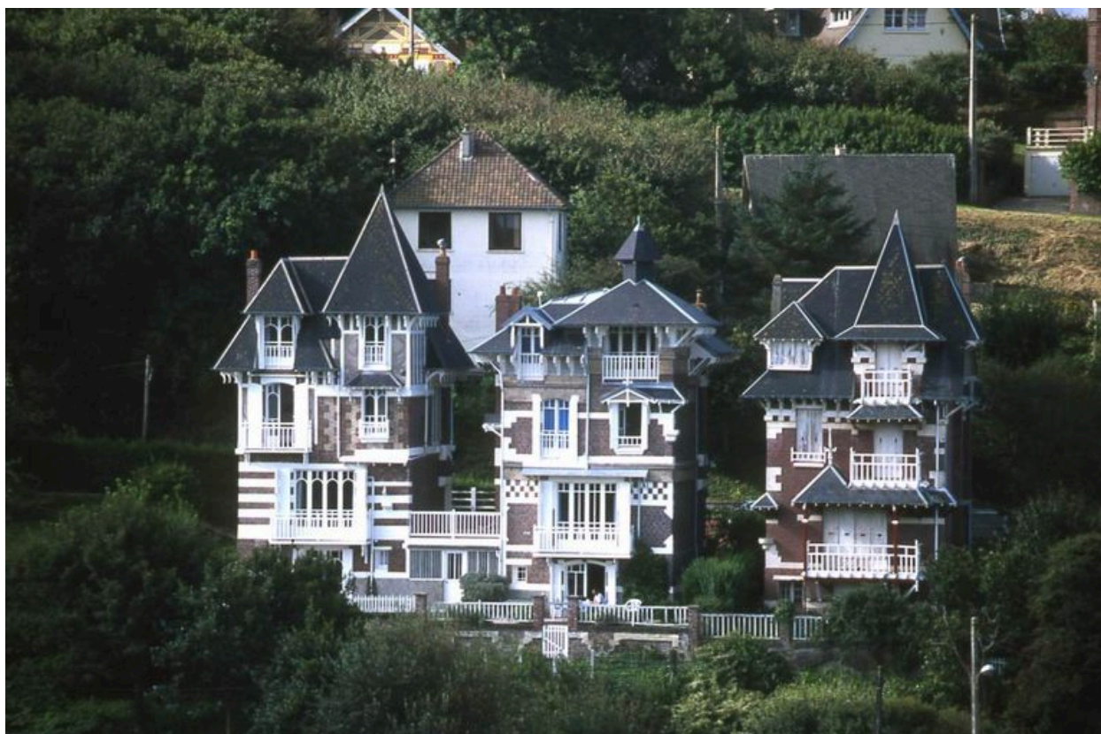
Vue générale des 'Trois chalets' avec Les Garamantes à droite.