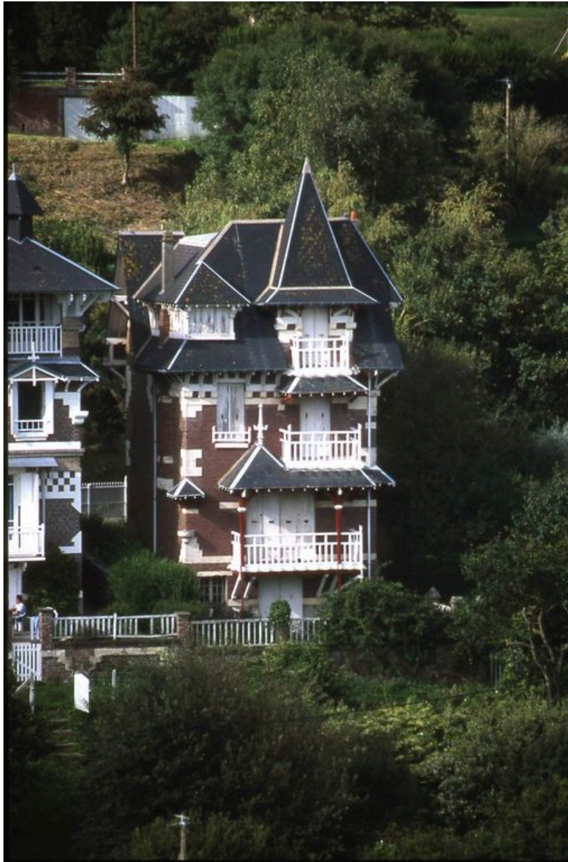
Elévation côté mer.