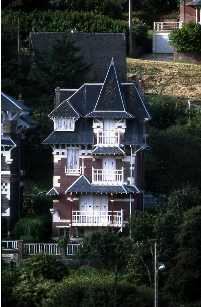
Elévation côté mer.