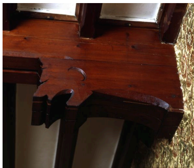
Détail d'une console du 'hall' figurant un animal. IVR22_20058001703XA

IVR22_20058001702XA