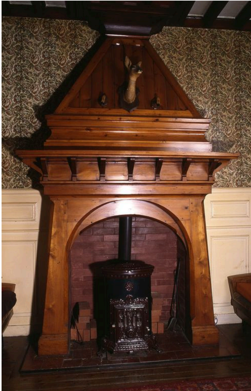
Cheminée du 'hall' ou pièce de réception.