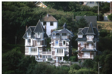
Vue générale des 'Trois chalets' avec Les Garamantes à droite. IVR22_20048000176ZA