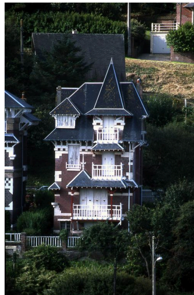
Elévation côté mer.