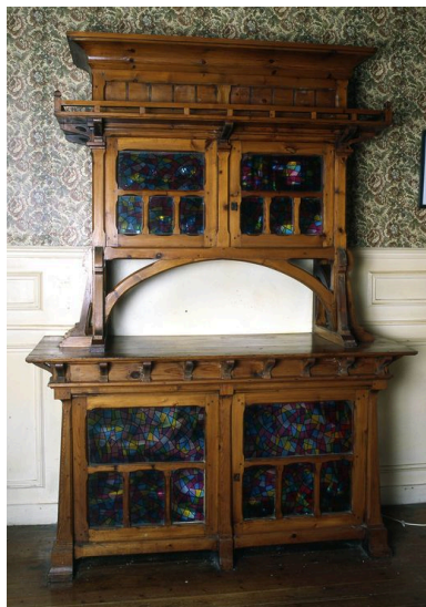
Buffet du 'hall'.

IVR22_20058001702XA