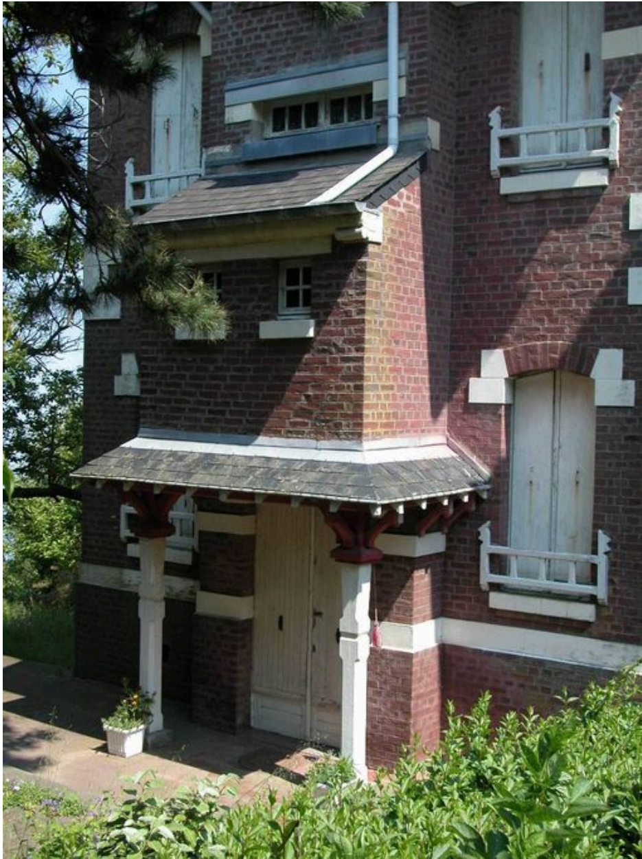
Détail du porche d'entrée.