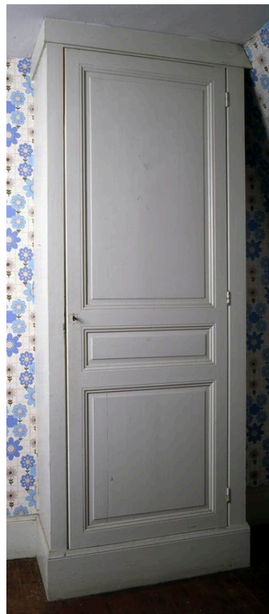
Détail d'un placard d'une chambre. IVR22_20058001705XA