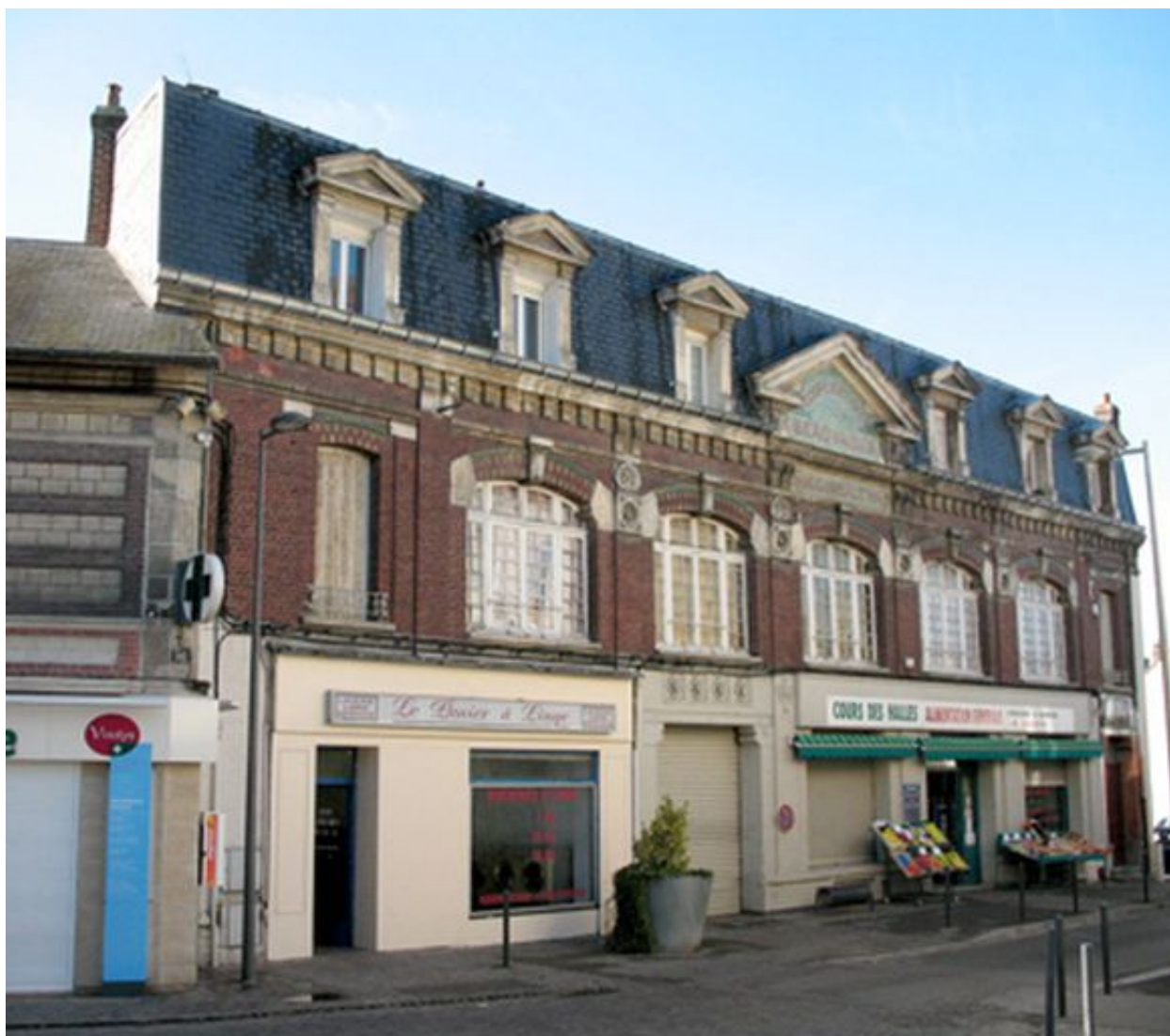
Vue générale de la succursale du Beauvaisis.