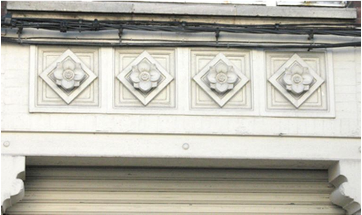
Détail de la façade de la coopérative.