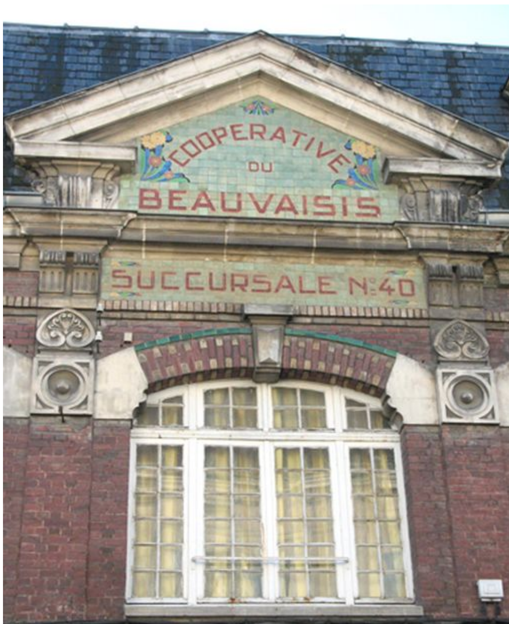
Fronton de la coopérative du Beauvaisis.