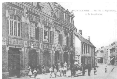
Le magasin coopératif porte la mention du siège social du syndicat des ouvriers métallurgistes de l'Oise (AC Montataire). IVR22_20086005121NUCAB