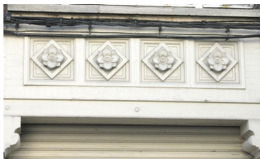
Détail de la façade de la coopérative.

IVR22_20076005559NUCA