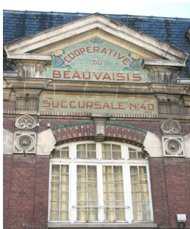
Fronton de la coopérative du Beauvaisis.

IVR22_20076005559NUCA