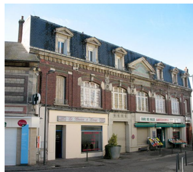
Vue générale de la succursale du Beauvaisis. IVR22_20076005558NUCAB