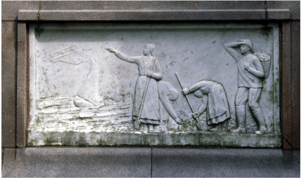
Vue du bas-relief représentant des pêcheurs à pied et des verrotières (face postérieure).