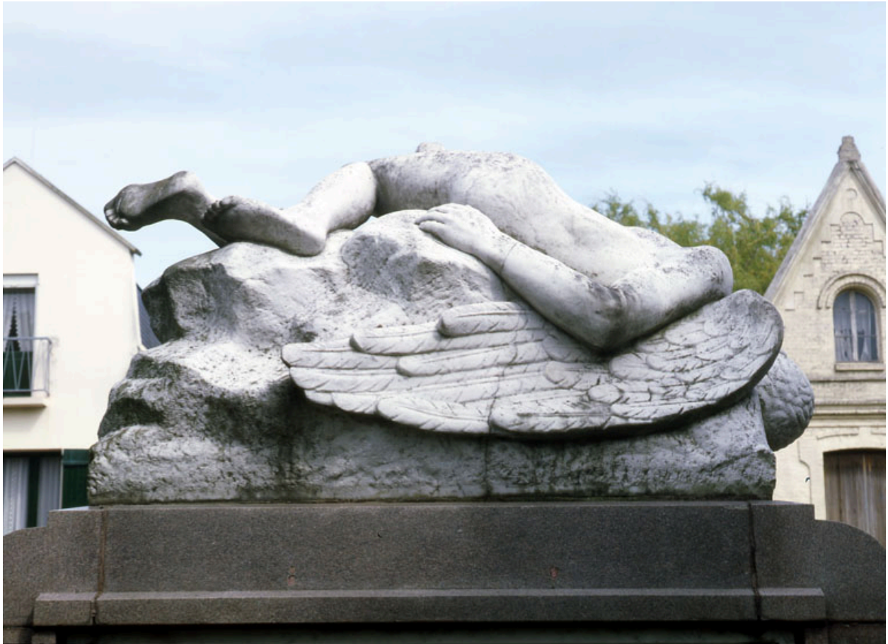
La statue en marbre représentant la chute d'Icare, face postérieure.