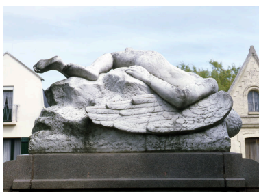
La statue en marbre représentant la chute d'Icare, face postérieure. IVR22_20048000085XA

IVR22_20048000084XA