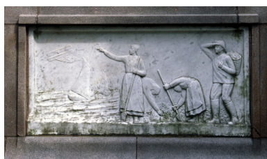
Vue du bas-relief représentant des pêcheurs à pied et des verrotières (face postérieure).

IVR22_20048000084XA