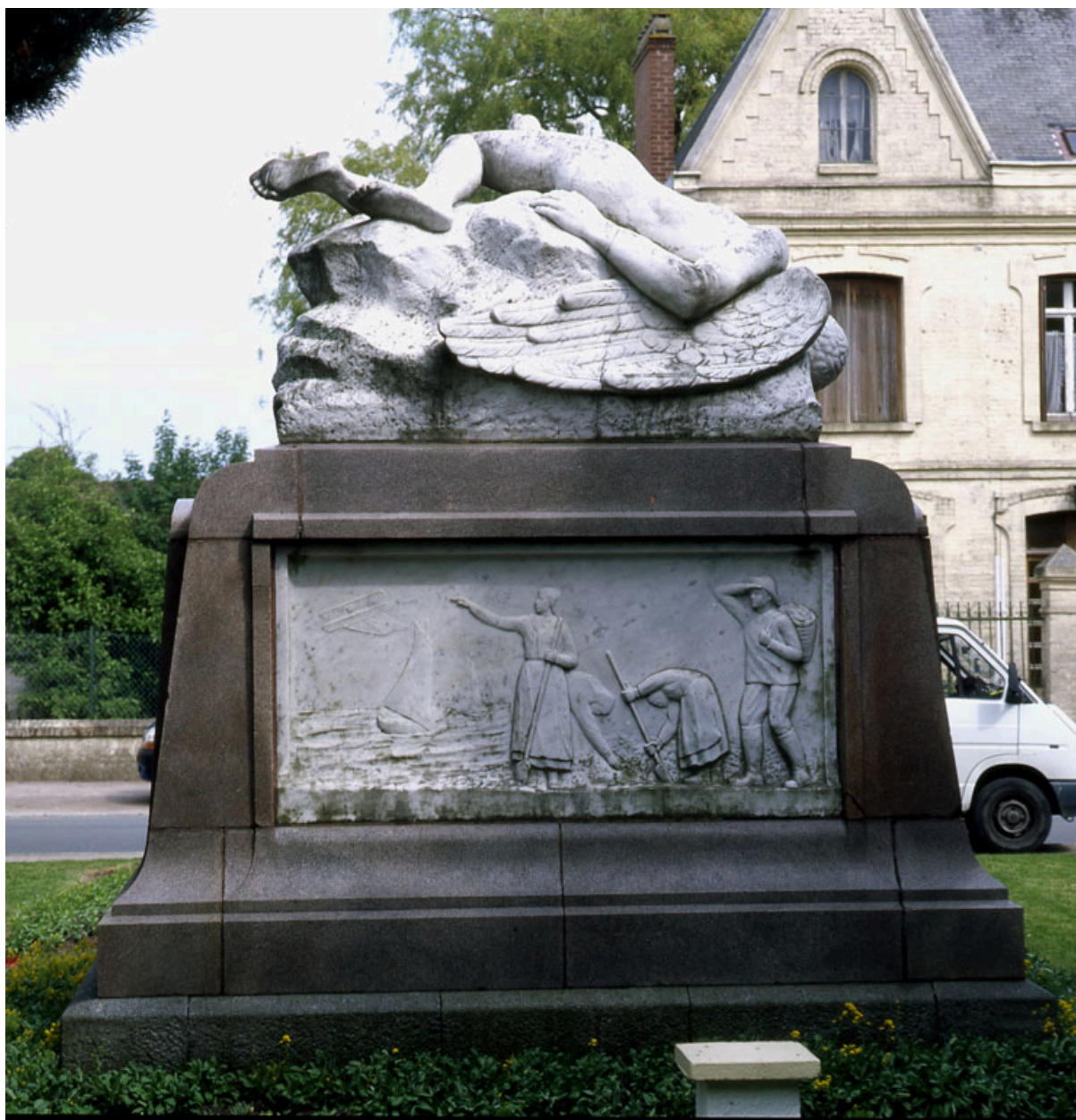
Vue générale, face postérieure.