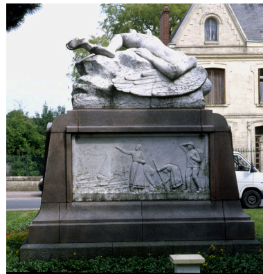
Vue générale, face postérieure. IVR22_20048000083XA