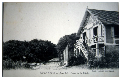
Carte postale, 1er quart 20e siècle (coll. part.).

Phot. Monnehay-Vulliet Marie-Laure IVR22_20058000564XAB