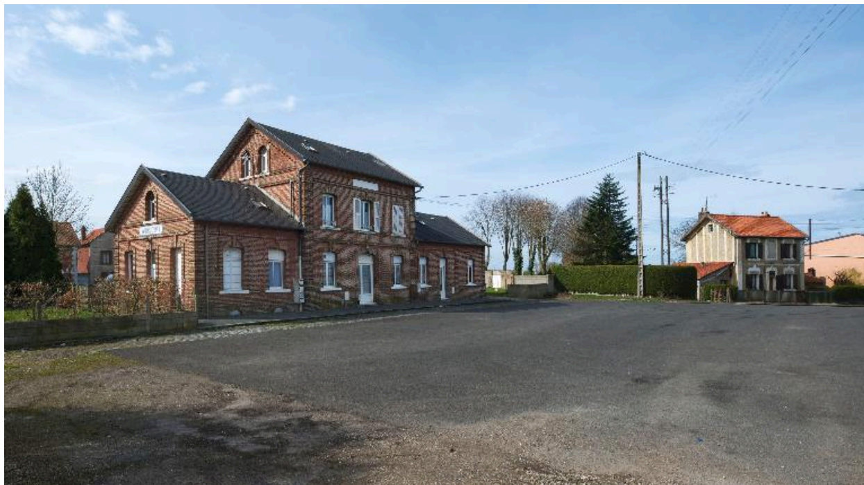
Vue générale depuis la place de la gare.