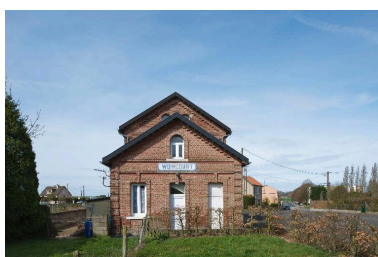
Le mur-pignon est. IVR22_20138000121NUC2A