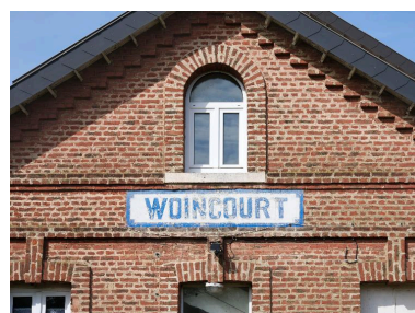
Détail du cartouche du pignon est. IVR22_20138000122NUC2A