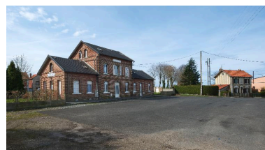
Vue générale depuis la place de la gare.