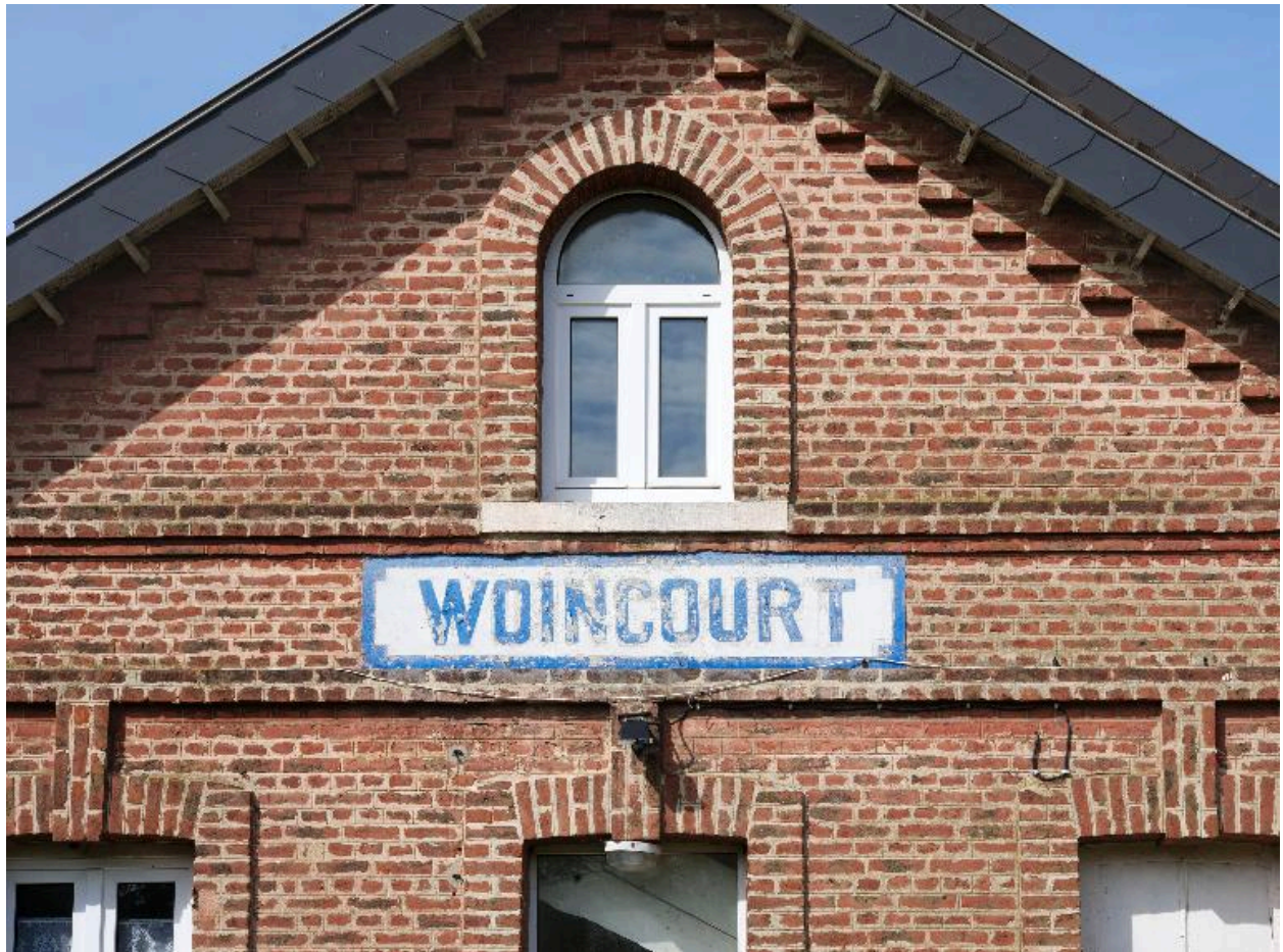
Détail du cartouche du pignon est.