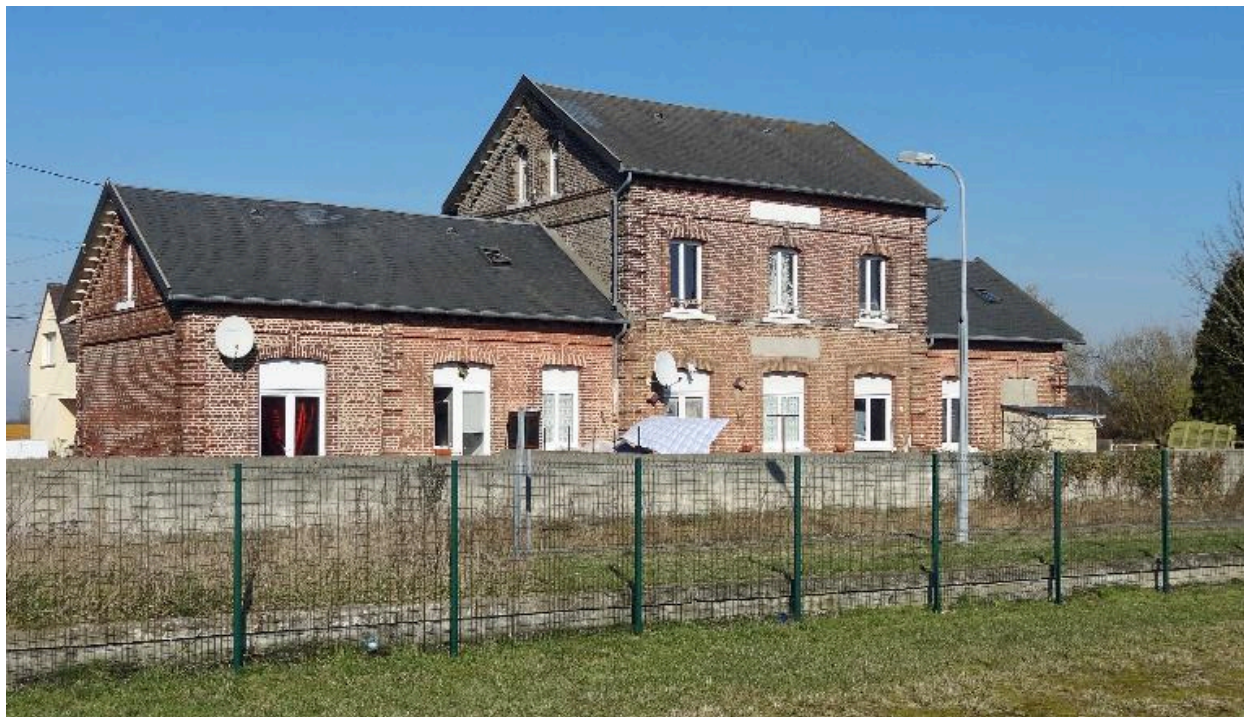
Vue générale de la façade sur voie.