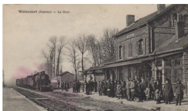
Vue du quai de la gare, début du 20e siècle (coll. part.).