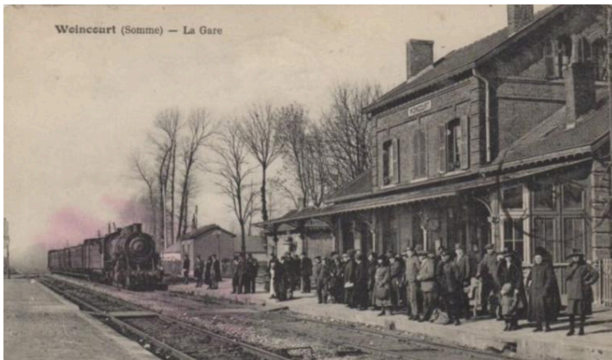
Vue du quai de la gare, début du 20e siècle.