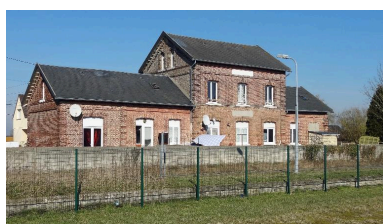
Vue générale de la façade sur voie. IVR22_20128015511NUCA