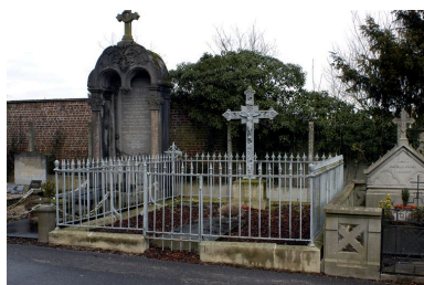
Vue générale. IVR22_20058000233NUCA