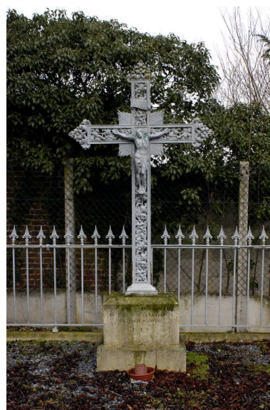
Vue de détail sur la croix en fonte.