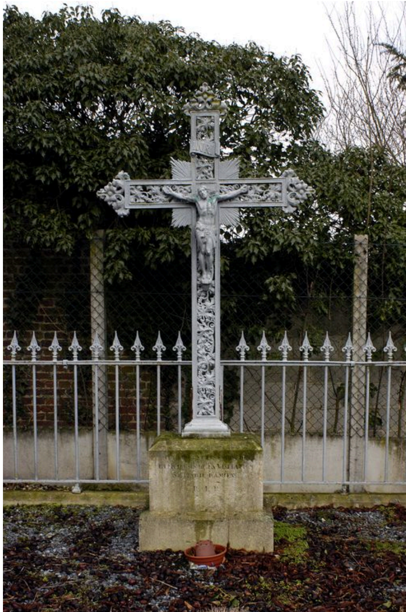
Vue de détail sur la croix en fonte.