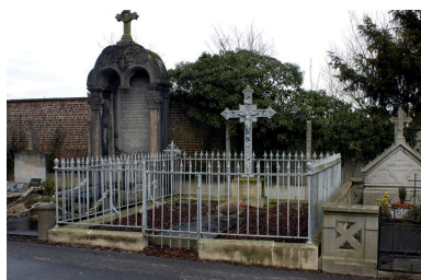
Vue générale. IVR22_20058000233NUCA