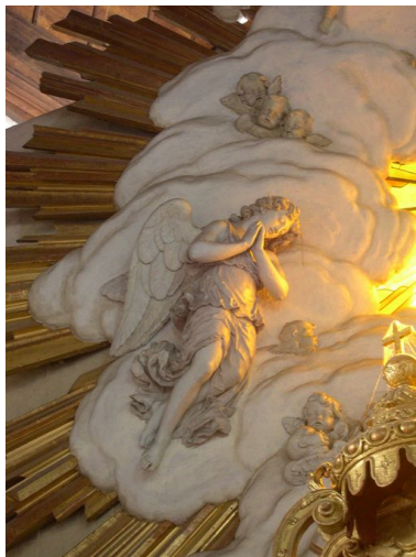
Détail de la gloire.