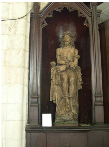
Statue du Christ aux liens (Cl. MH).