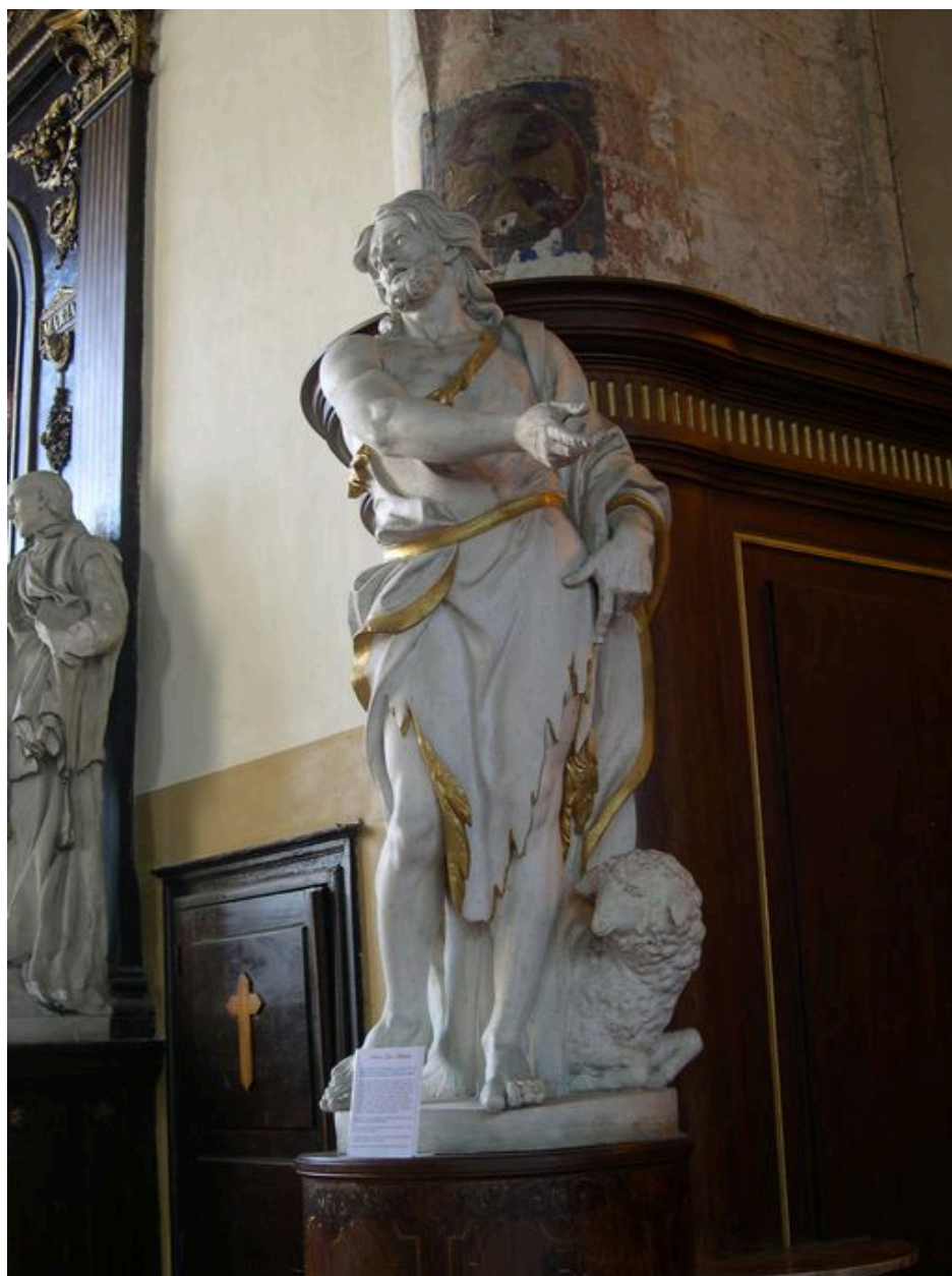
Statue de saint Jean-Baptiste (Cl. MH).