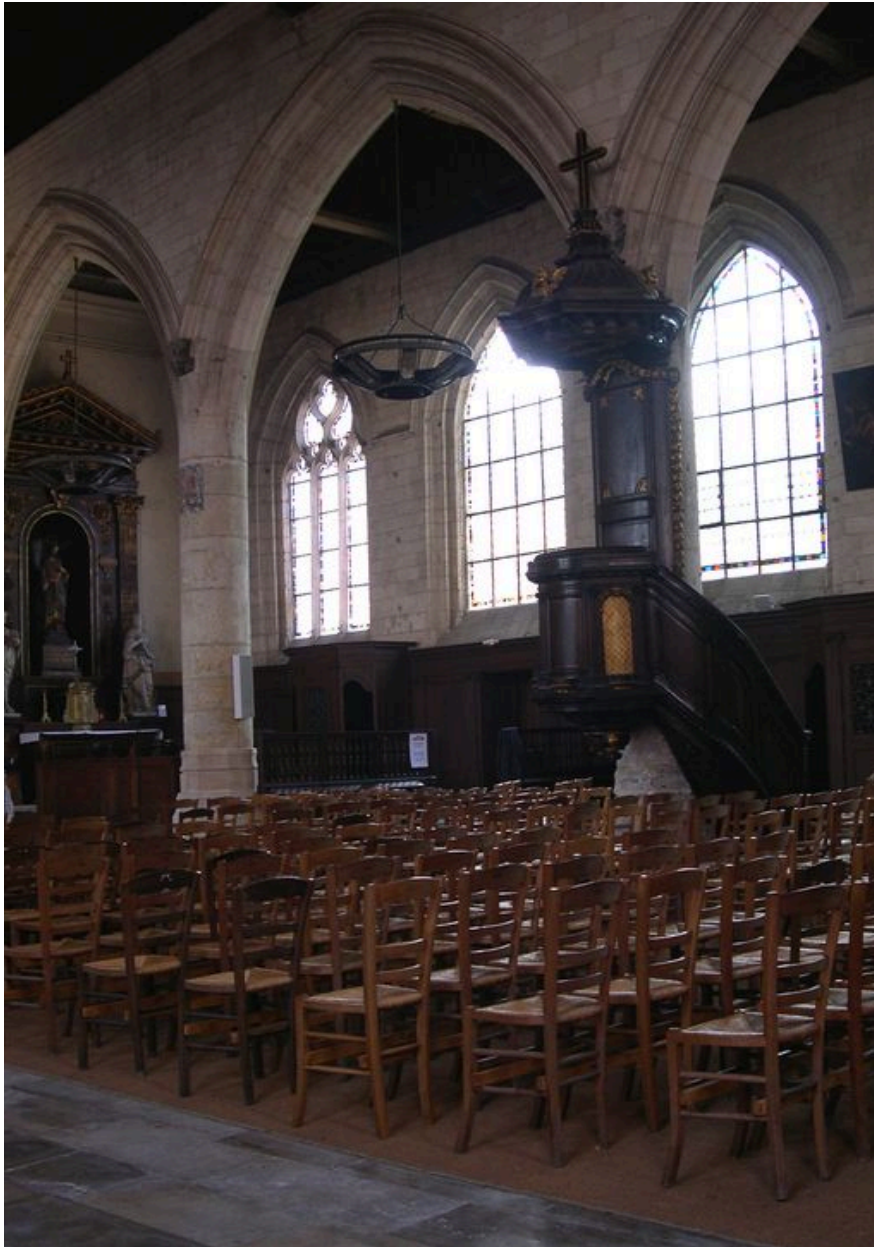
La chaire à prêcher.