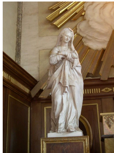
Statue de la Vierge