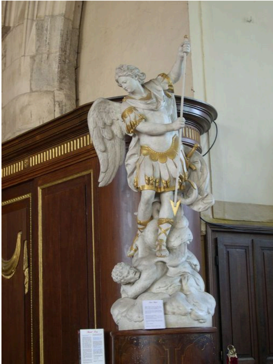
Statue de saint Michel (Cl. MH).