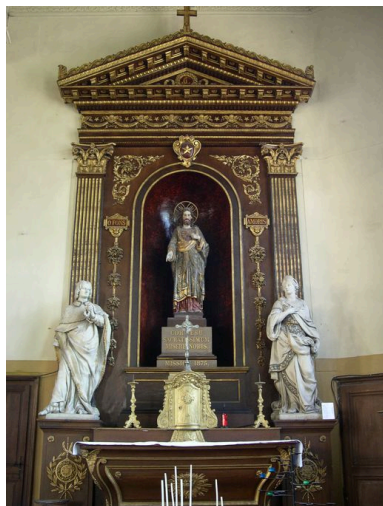
Autel du Sacré-Coeur. IVR22_20068010670NUCA