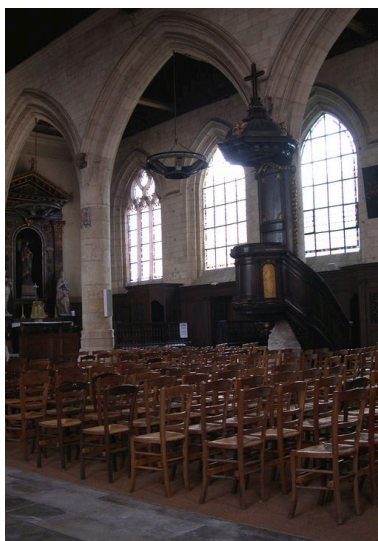
La chaire à prêcher. IVR22_20068010674NUCA