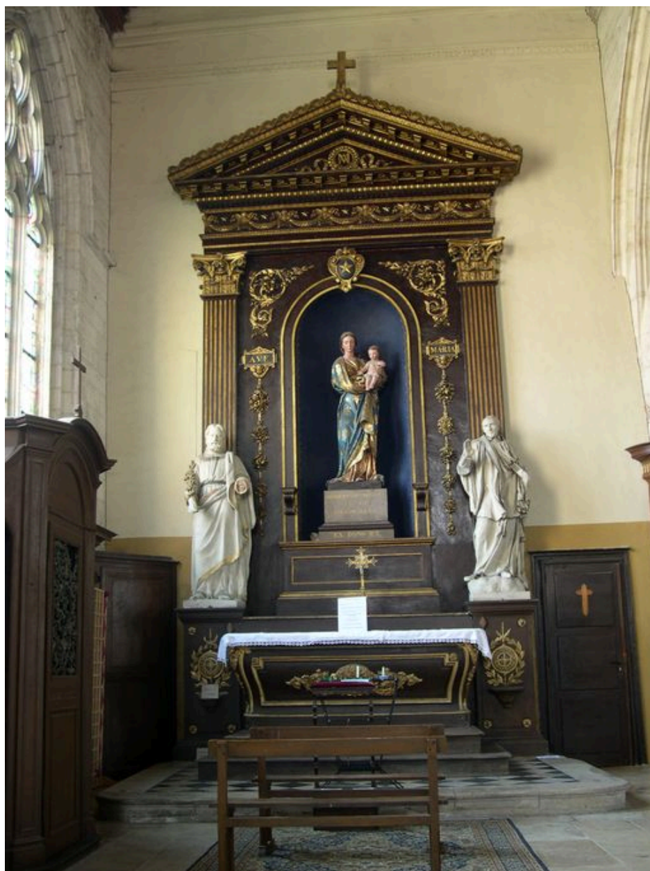
Autel de la Vierge.