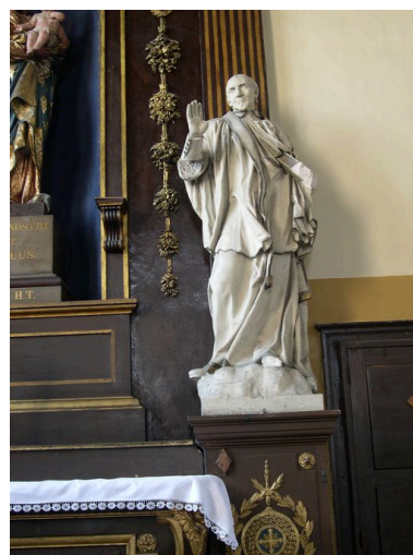
Statue de saint Vincent de Paul.