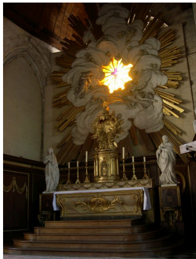
Vue du maître-autel. IVR22_20068010661NUCA