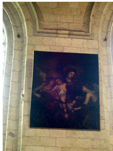
Tableau : Vierge et anges musiciens, copie d'après Anton Van Dyck. IVR22_20068010672NUCA