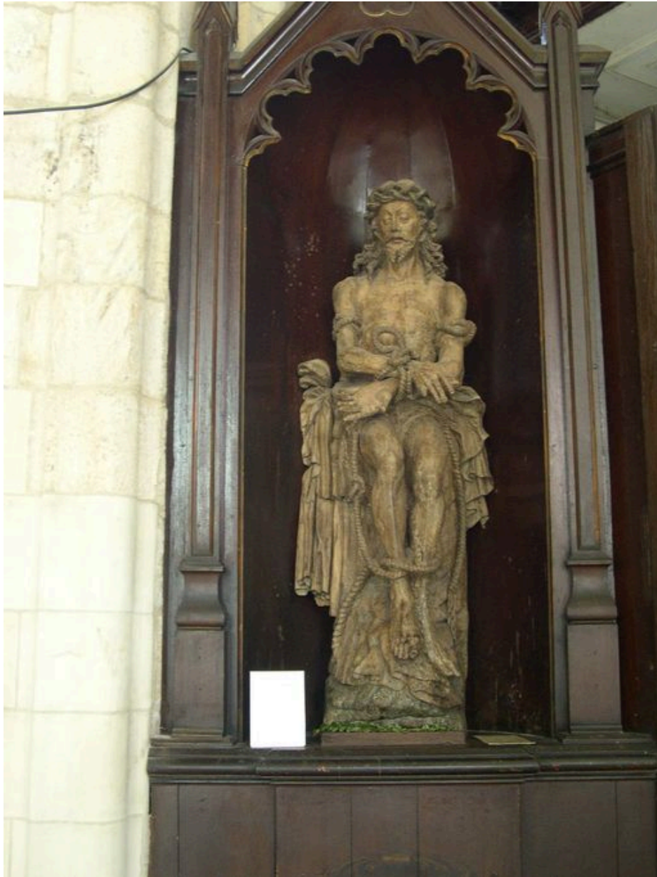
Statue du Christ aux liens (Cl. MH).