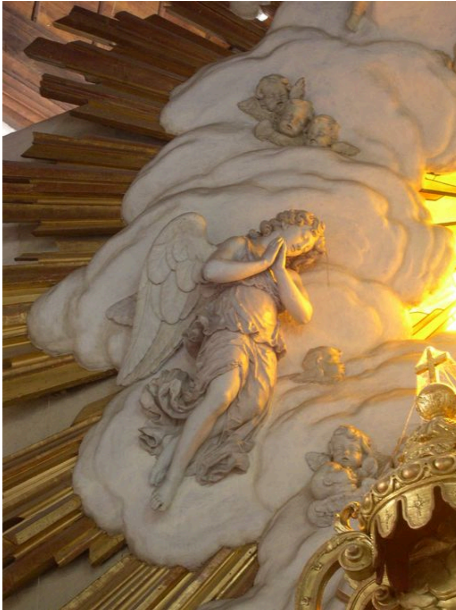
Détail de la gloire.