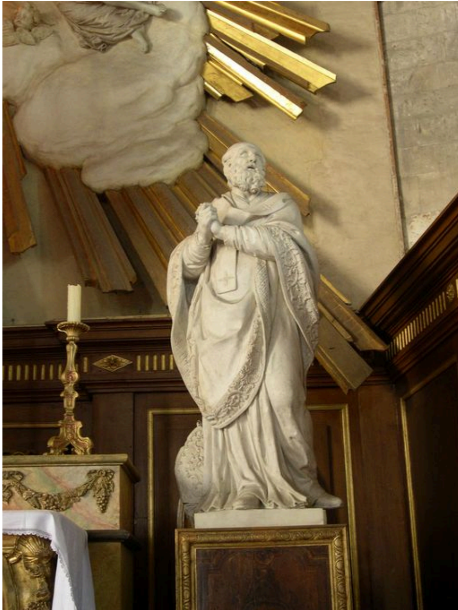
Statue de saint Augustin.