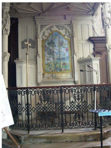
Chapelle des Fonts.