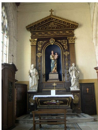
Autel de la Vierge.