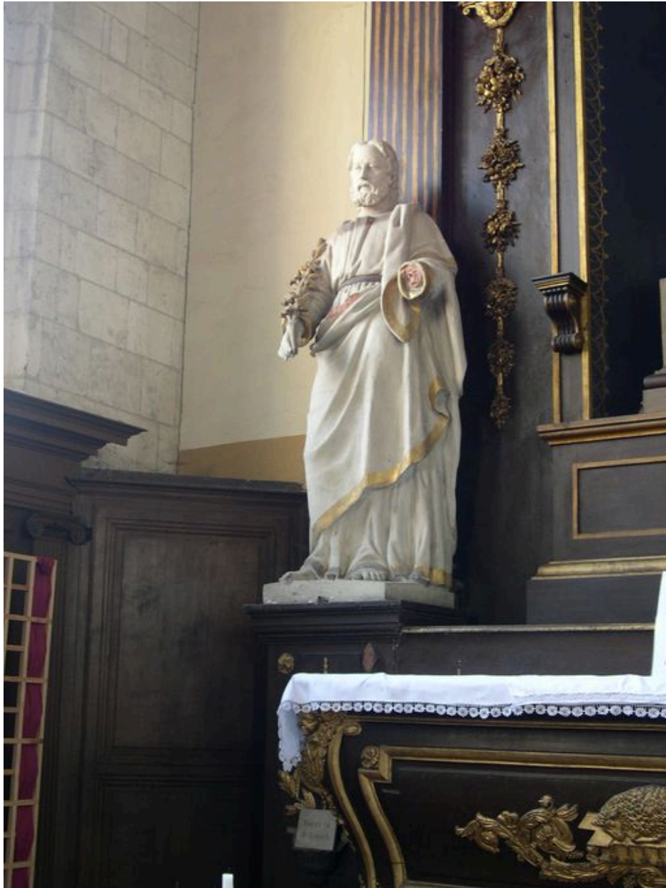
Statue de saint Joseph.