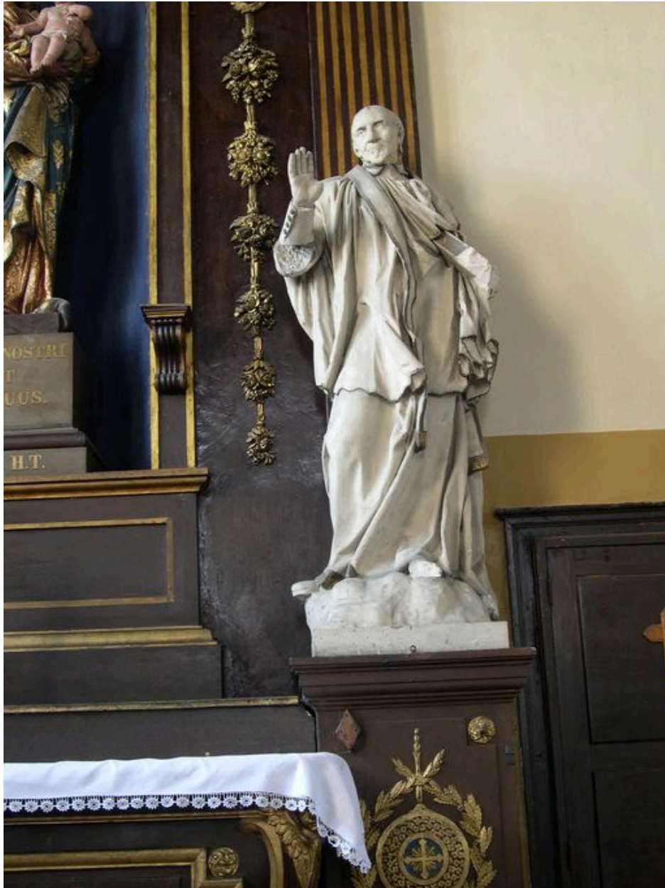
Statue de saint Vincent de Paul.