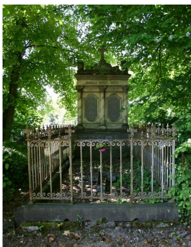
Vue générale. IVR22_20098001285NUCA