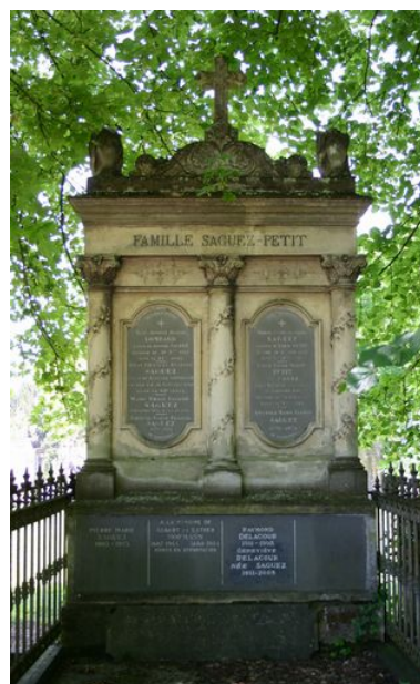
Stèle architecturée, à entablement et fronton à volutes.