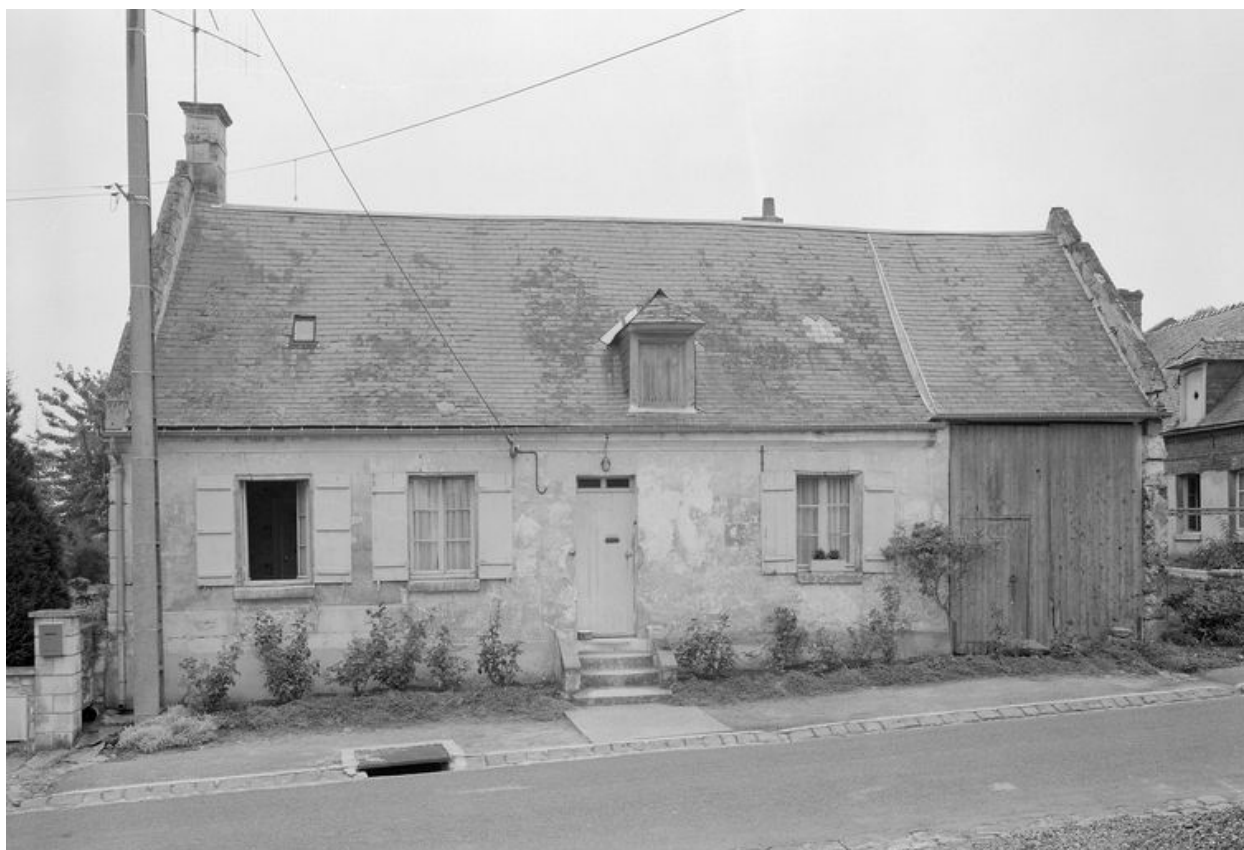
Logis. Elévation antérieure.