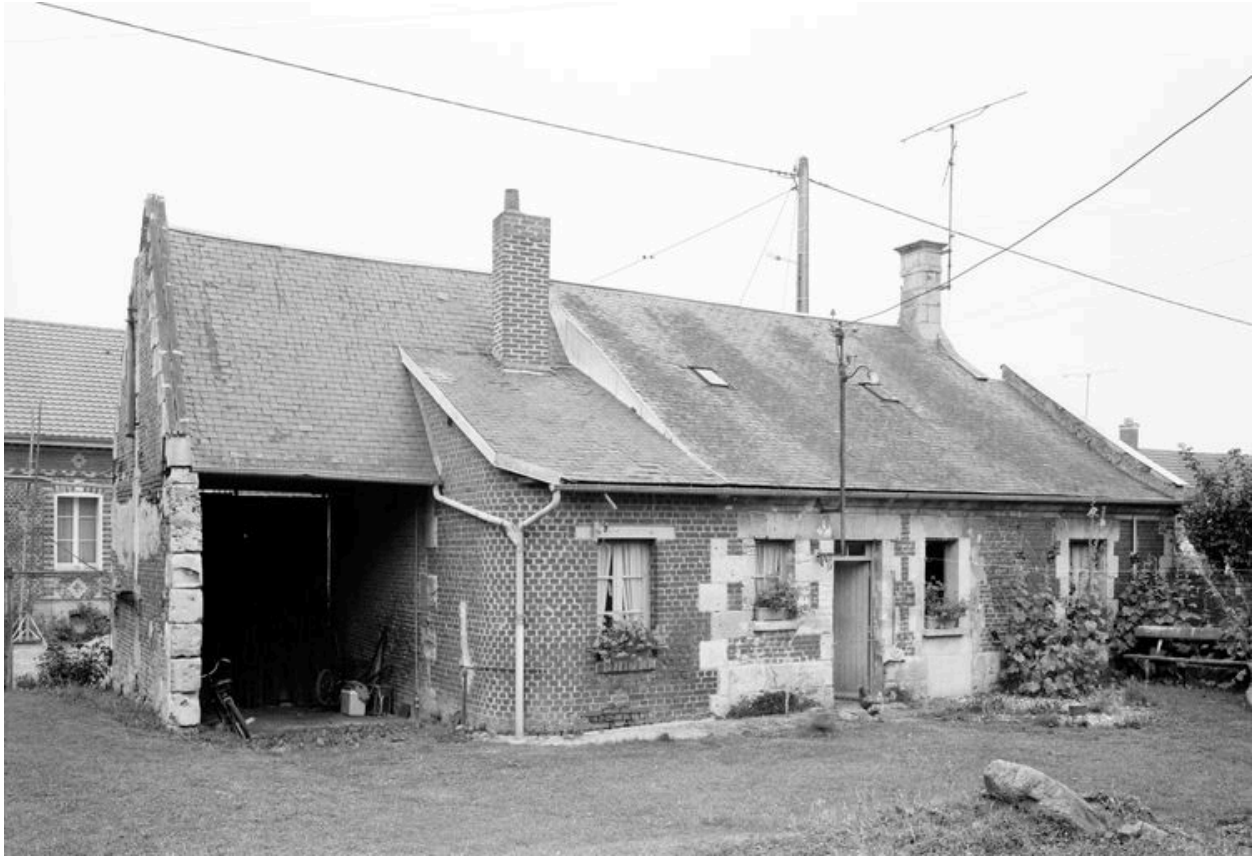
Logis. Élévation postérieure.