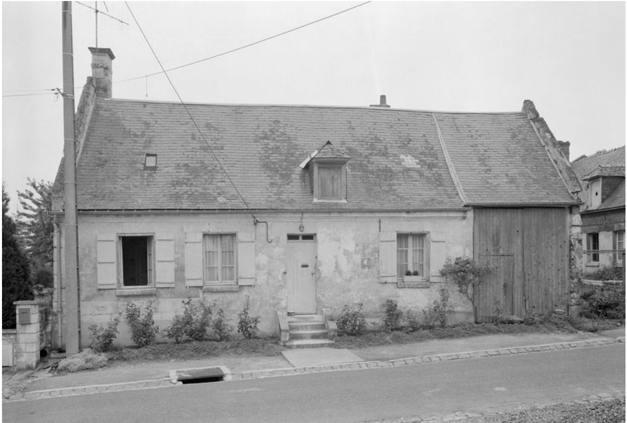
Logis. Elévation antérieure.