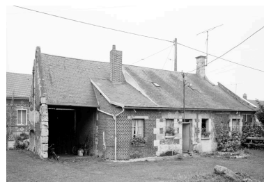
Logis. Elévation postérieure. IVR22_19846000995X