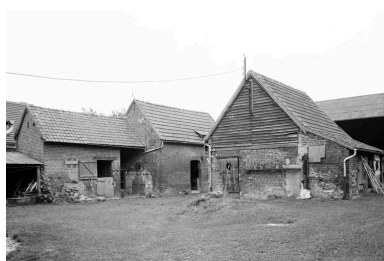
Bâtiments d'exploitation. IVR22_19846000996X