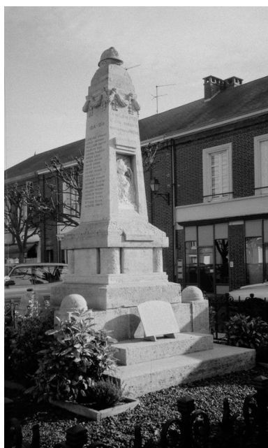
Vue générale. IVR22_19968000176Z