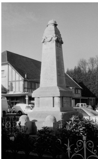
Vue postérieure.