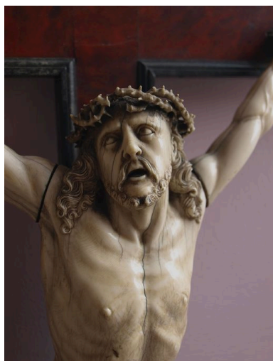
Vue de détail : visage du Christ IVR31_20106204573NUCA