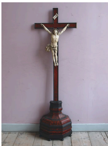
Vue générale IVR31_20106204571NUCA