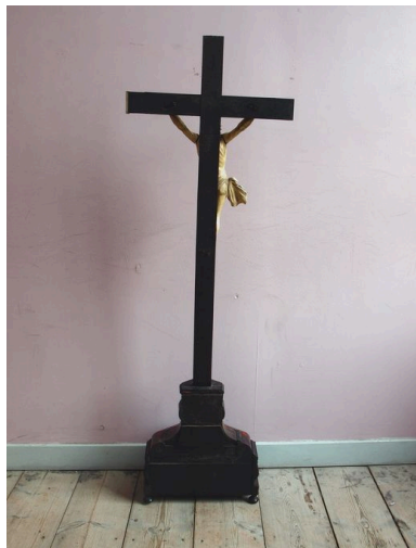
Vue générale, revers IVR31_20106204575NUCA