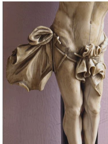
Vue de détail : perizonium IVR31_20106204574NUCA