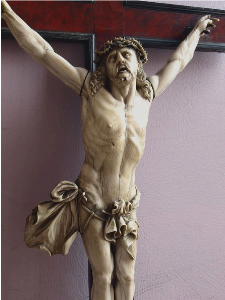
Vue de détail : Christ