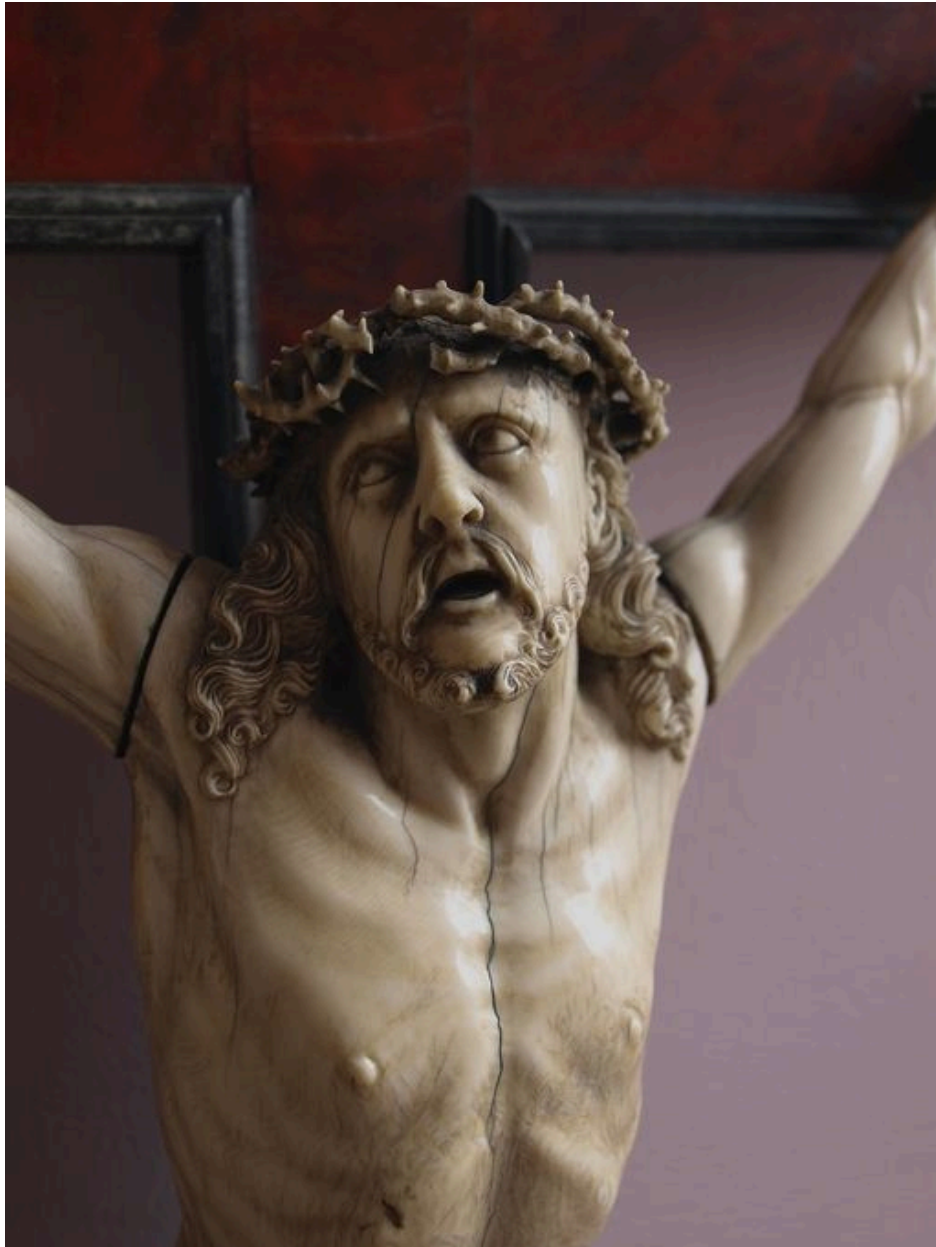
Vue de détail : visage du Christ