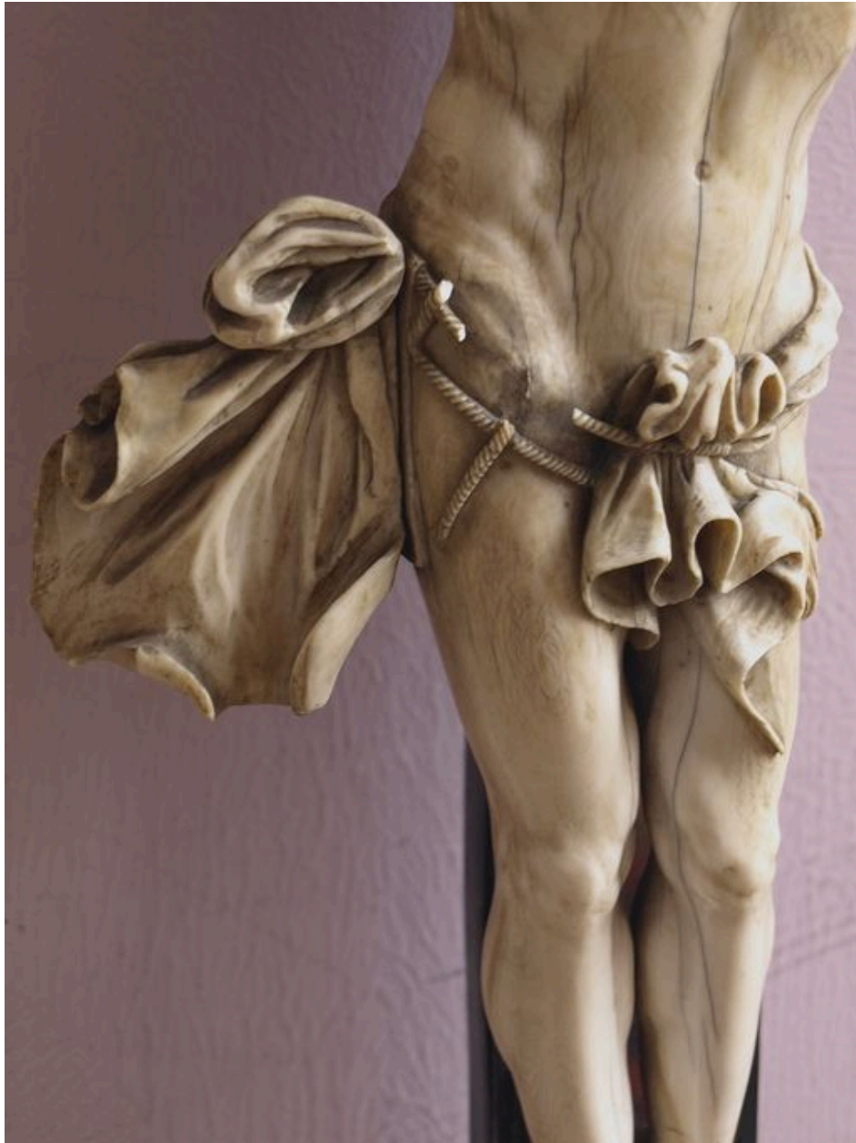
Vue de détail : perizonium