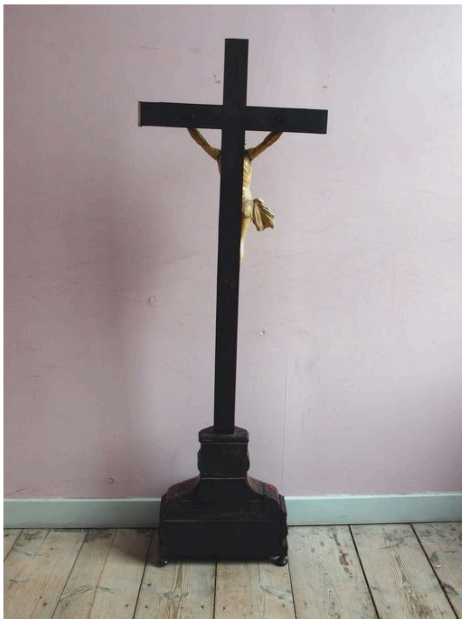
Vue générale, revers