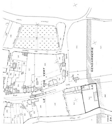
Plan de situation. Extrait du plan cadastral de 1986, section B.

Phot. Monnehay-Vulliet Marie-Laure IVR22_20080290198NUCA