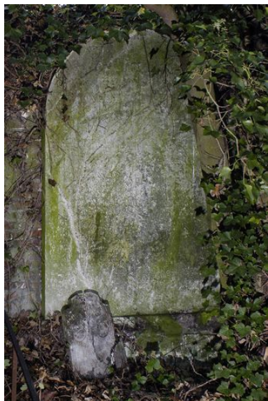
Stèle cintrée. IVR22_20058002030NUCA