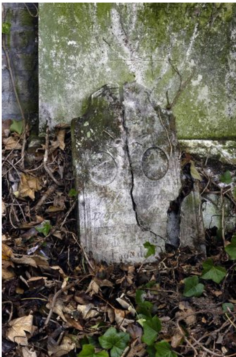
Petite stèle d'applique.