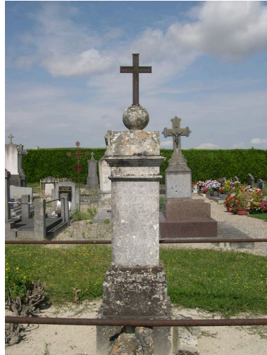
Vue du cippe. IVR22_20068011187NUCA