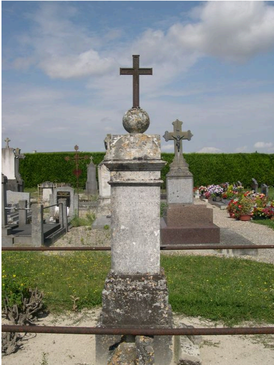
Vue du cippe.