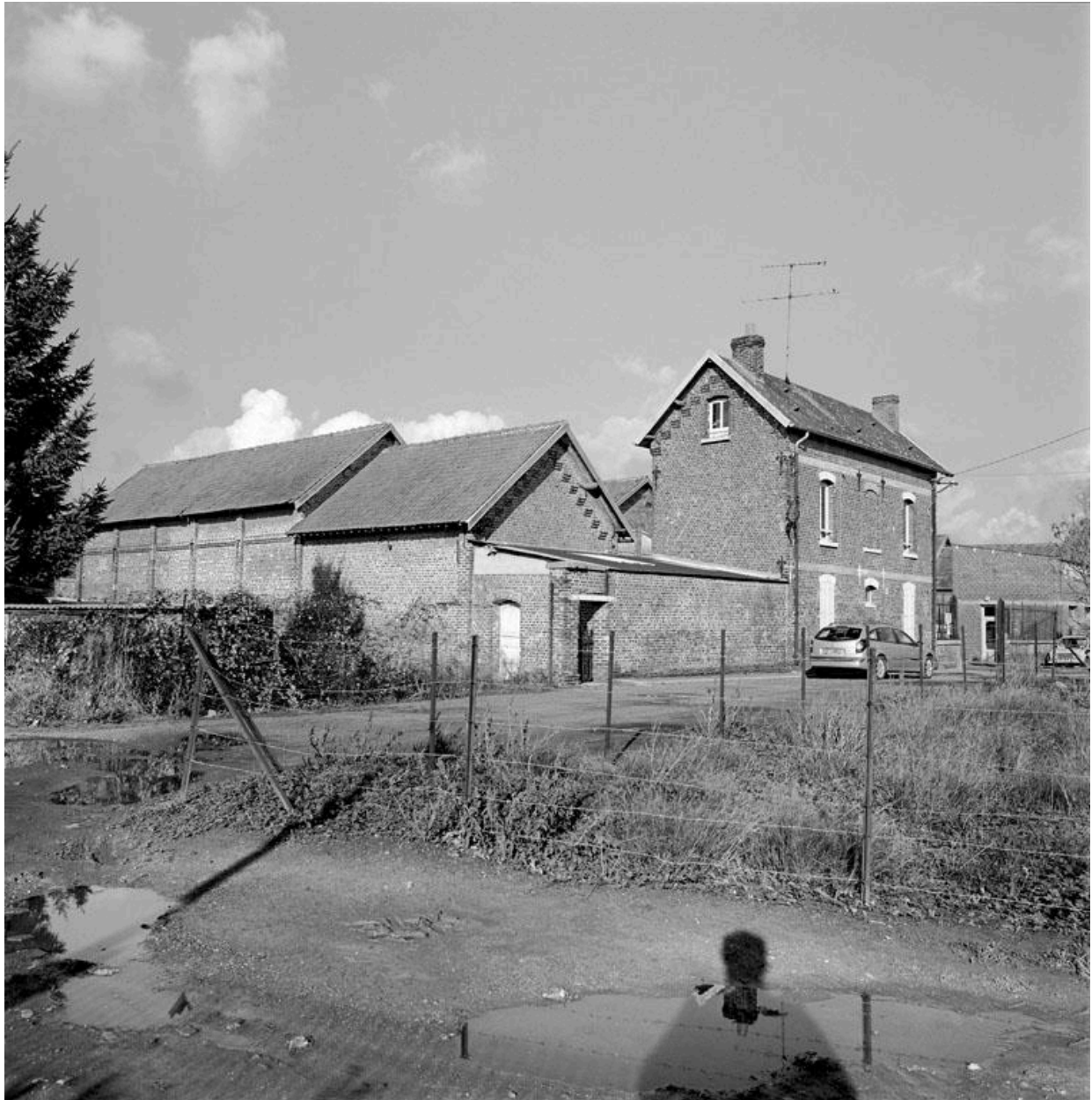
Vue générale des bâtiments, depuis la rue.