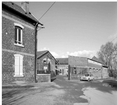
Vue partielle du bâtiment d'administration et de la cour de l'ancien abattoir.