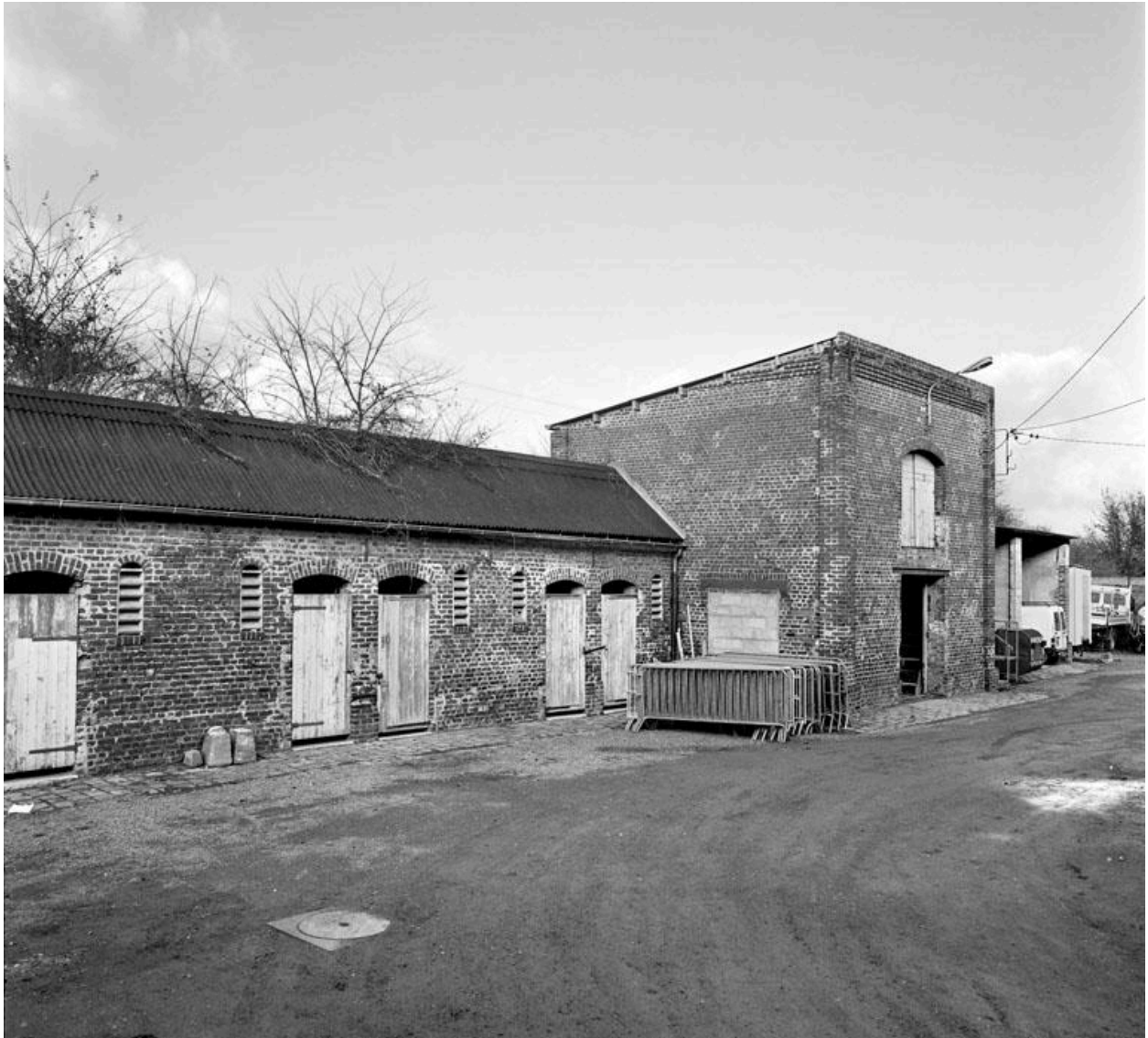
Vue des anciennes étables, dans la cour.