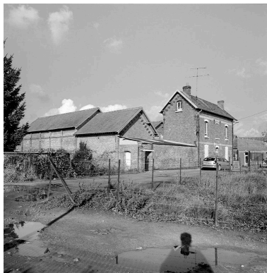
Vue générale des bâtiments, depuis la rue.