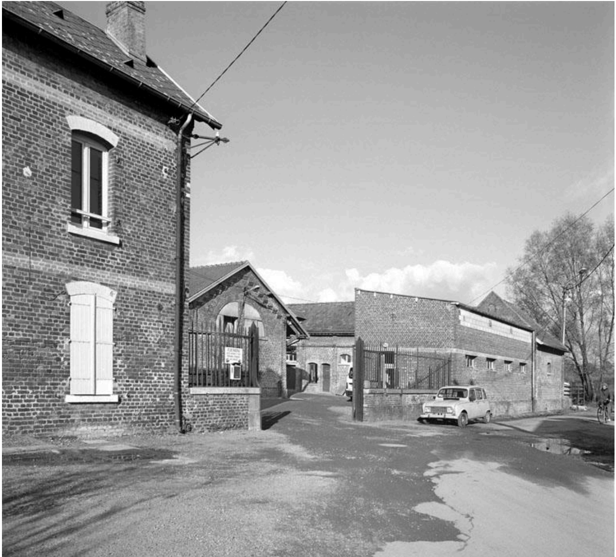
Vue partielle du bâtiment d'administration et de la cour de l'ancien abattoir.