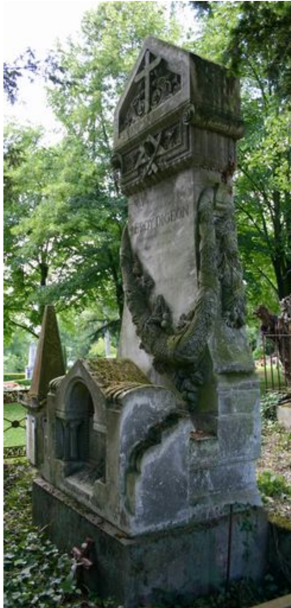
Tombeau de l'entrepreneur Leroy-Digeon, Edmond Duthoit (architecte), 1876, depuis le côté.