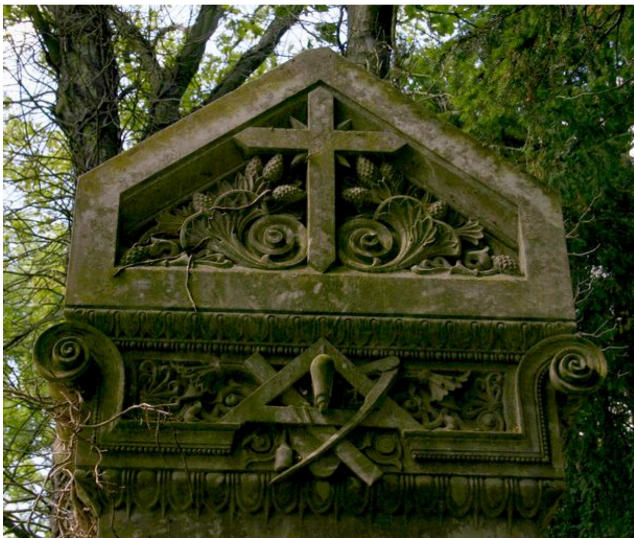
Tombeau de l'entrepreneur Leroy-Digeon, Edmond Duthoit (architecte), 1876 : détail du fronton sculpté.