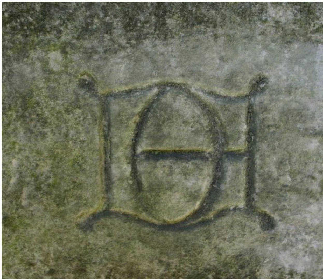
Tombeau de l'entrepreneur Leroy-Digeon, Edmond Duthoit (architecte), 1876 : monogramme de l'architecte Edmond Duthoit.