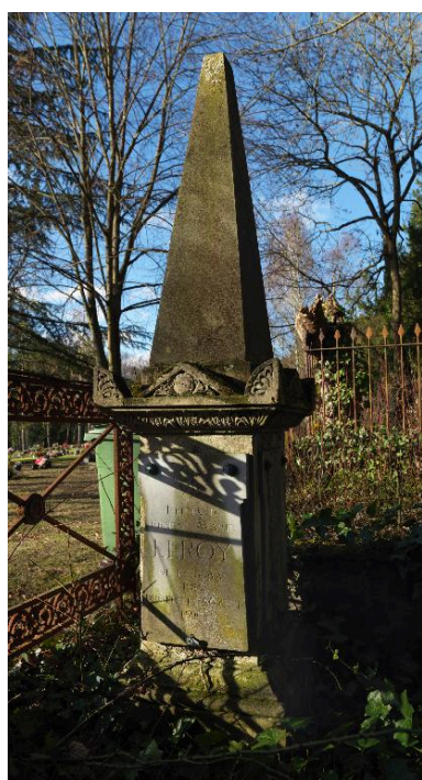
Obélisque de droite, vers 1843. IVR22_20148000163NUC2A