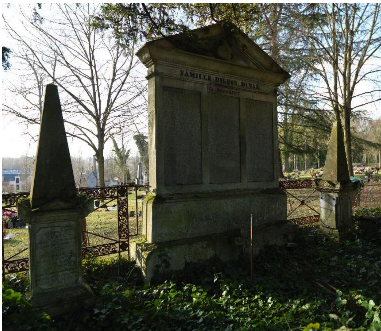
Stèle funéraire, vers 1837-1847. Obélisque situé à droite, vers 1843 et obélisque situé à gauche, vers 1857.