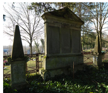
Stèle funéraire, vers 1837-1847. Obélisque situé à droite, vers 1843 et obélisque situé à gauche, vers 1857. IVR22_20148000160NUC2A

IVR22_20148000158NUC2A