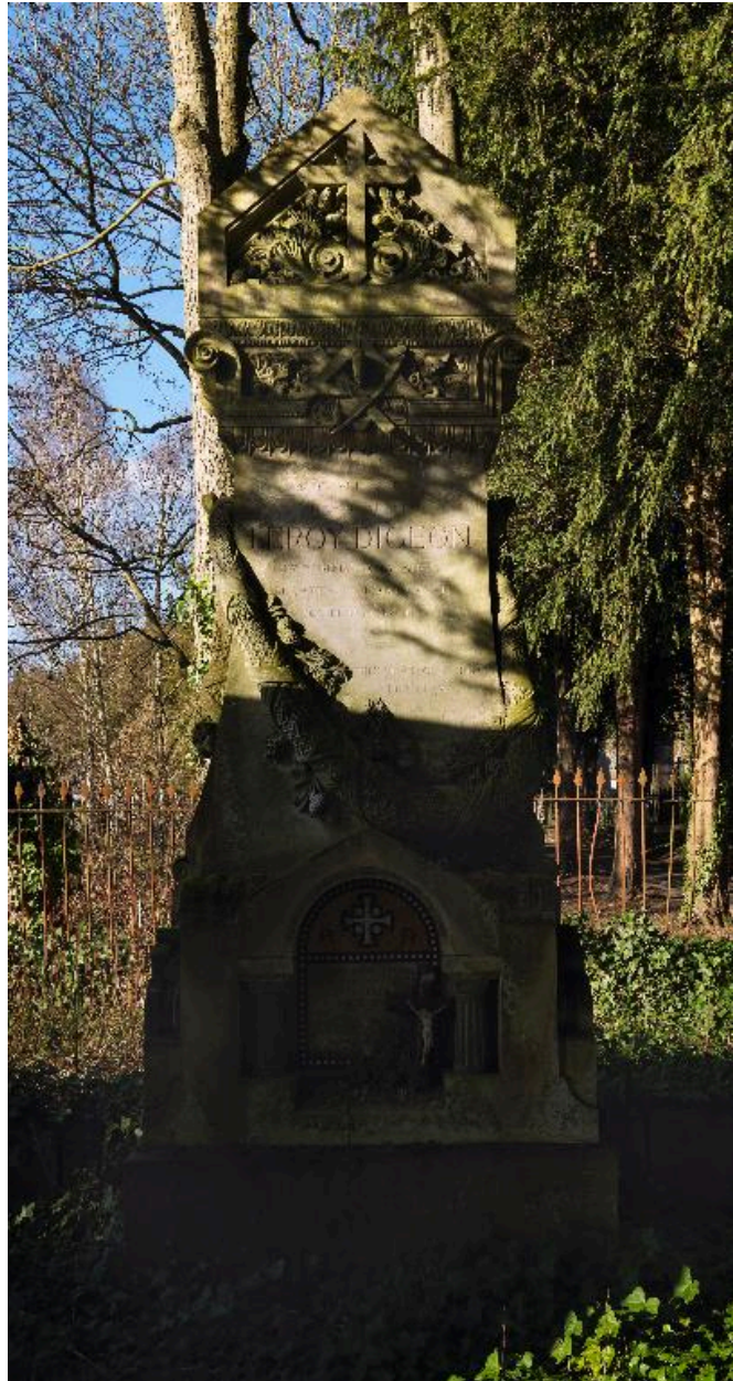
Tombeau de l'entrepreneur Leroy-Digeon, Edmond Duthoit (architecte), 1876.