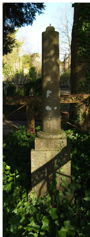
Colonne funéraire, Coënen (marbrier), vers 1876.