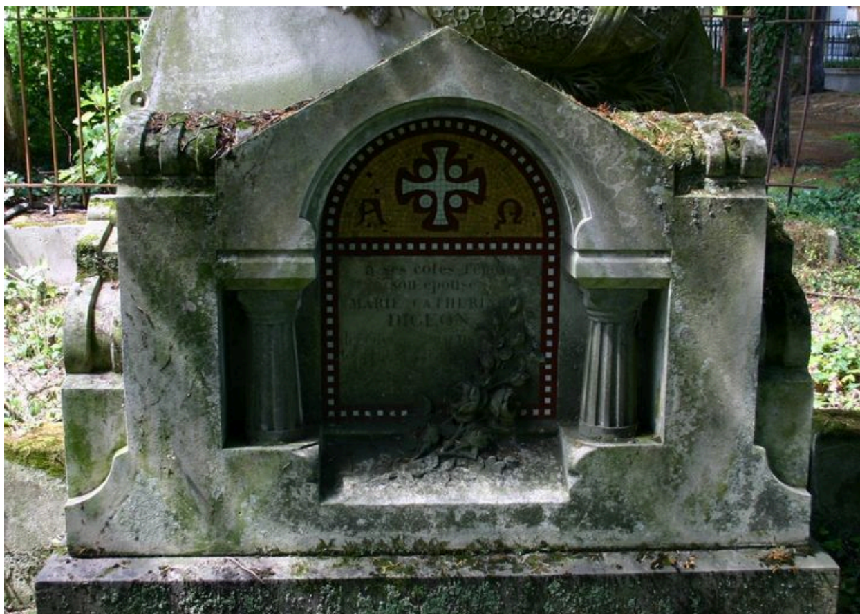
Tombeau de l'entrepreneur Leroy-Digeon, Edmond Duthoit (architecte), 1876 : partie inférieure (remaniement).