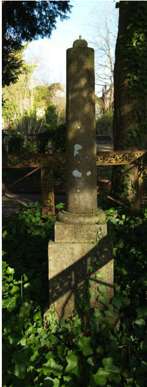
Colonne funéraire, Coënen (marbrier), vers 1876.