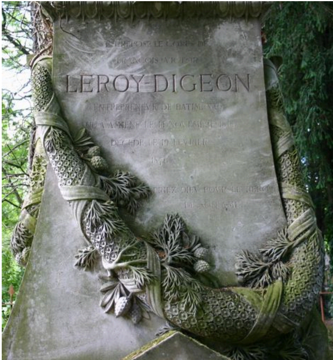
Tombeau de l'entrepreneur Leroy-Digeon, Edmond Duthoit (architecte), 1876 : détail de la guirlande végétale.