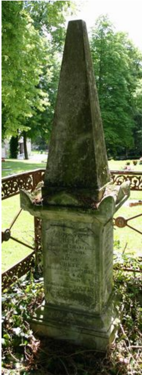
Obélisque de gauche, vers 1857.