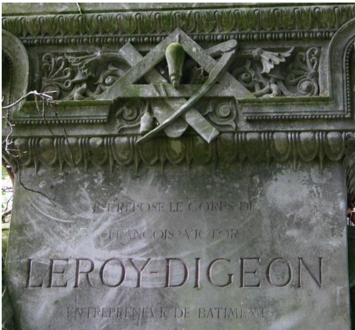
Tombeau de l'entrepreneur Leroy-Digeon, Edmond Duthoit (architecte), 1876 : détail des attributs professionnels sculptés (truelle, équerre, compas, règle, fil à plomb).