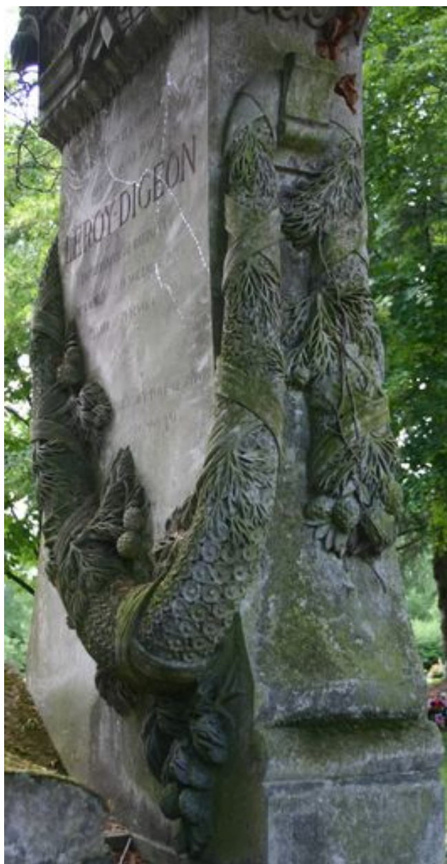
Tombeau de l'entrepreneur Leroy-Digeon, Edmond Duthoit (architecte), 1876 : détail de la guirlande végétale, depuis le côté.