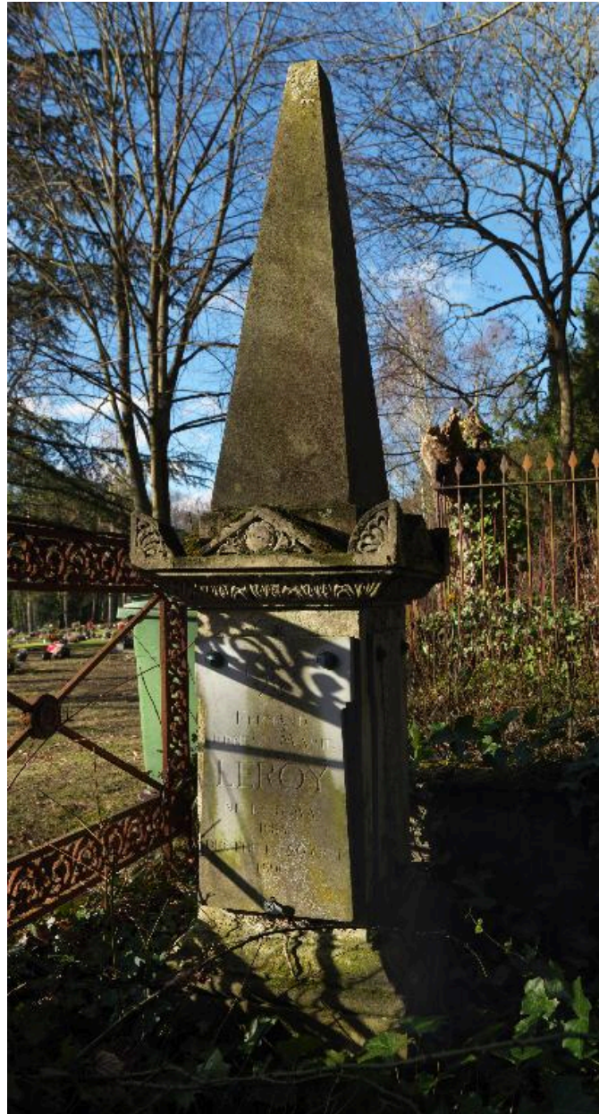
Obélisque de droite, vers 1843.