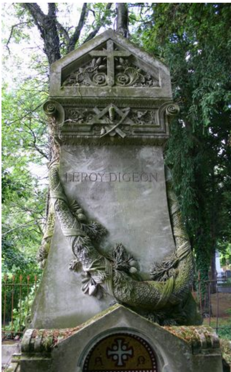
Tombeau de l'entrepreneur Leroy-Digeon, Edmond Duthoit (architecte), 1876 : partie médiane.