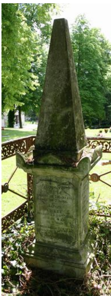
Obélisque de gauche, vers 1857. IVR22_20078000899NUCA