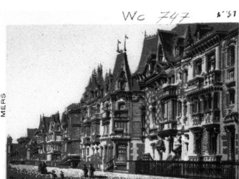
Les villas sur l'esplanade (îlots 20 et 21), dessin d'après photographie, par L.-P. Lefranc, 1892 (BNF Cartes et plans ; Sg wc 747/31).

Phot. Monnehay-Vulliet Marie-Laure IVR22_20048000423ZB