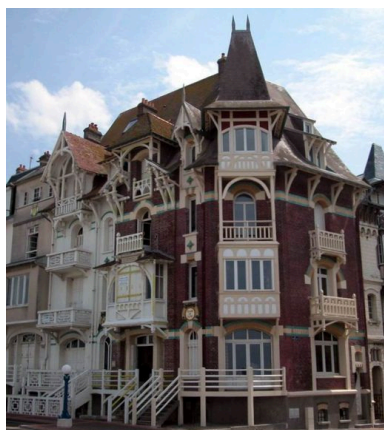
Les balcons des rez-de- chaussée surélevés (75 esplanade du Général-Leclerc).