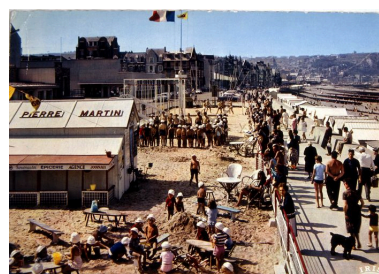
Le stade Pierre Martin et l'esplanade, 2e moitié 20e siècle (coll. part.).

Phot. Monnehay-Vulliet Marie-Laure IVR22_20048000516XB