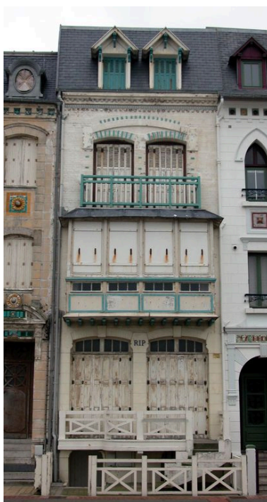
Clôture basse de séparation entre la voie publique et les jardinets (62 esplanade du Général-Leclerc).