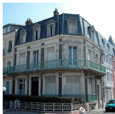
Clôture doublée d'une haie végétale (18, esplanade du Général-Leclerc).