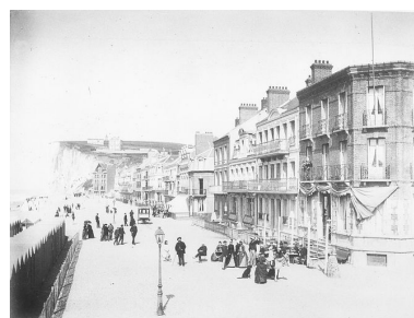
L'esplanade et l'ancien Hôtel du Casino au premier plan (îlot 9), photographie, [s.n.], limite 19e 20e siècles (BNF Estampes ; Mers, H 157897).

Phot. Monnehay-Vulliet Marie-Laure IVR22_20048000531XB