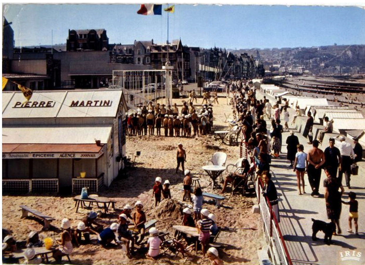
Le stade Pierre Martin et l'esplanade, 2e moitié 20e siècle (coll. part.).