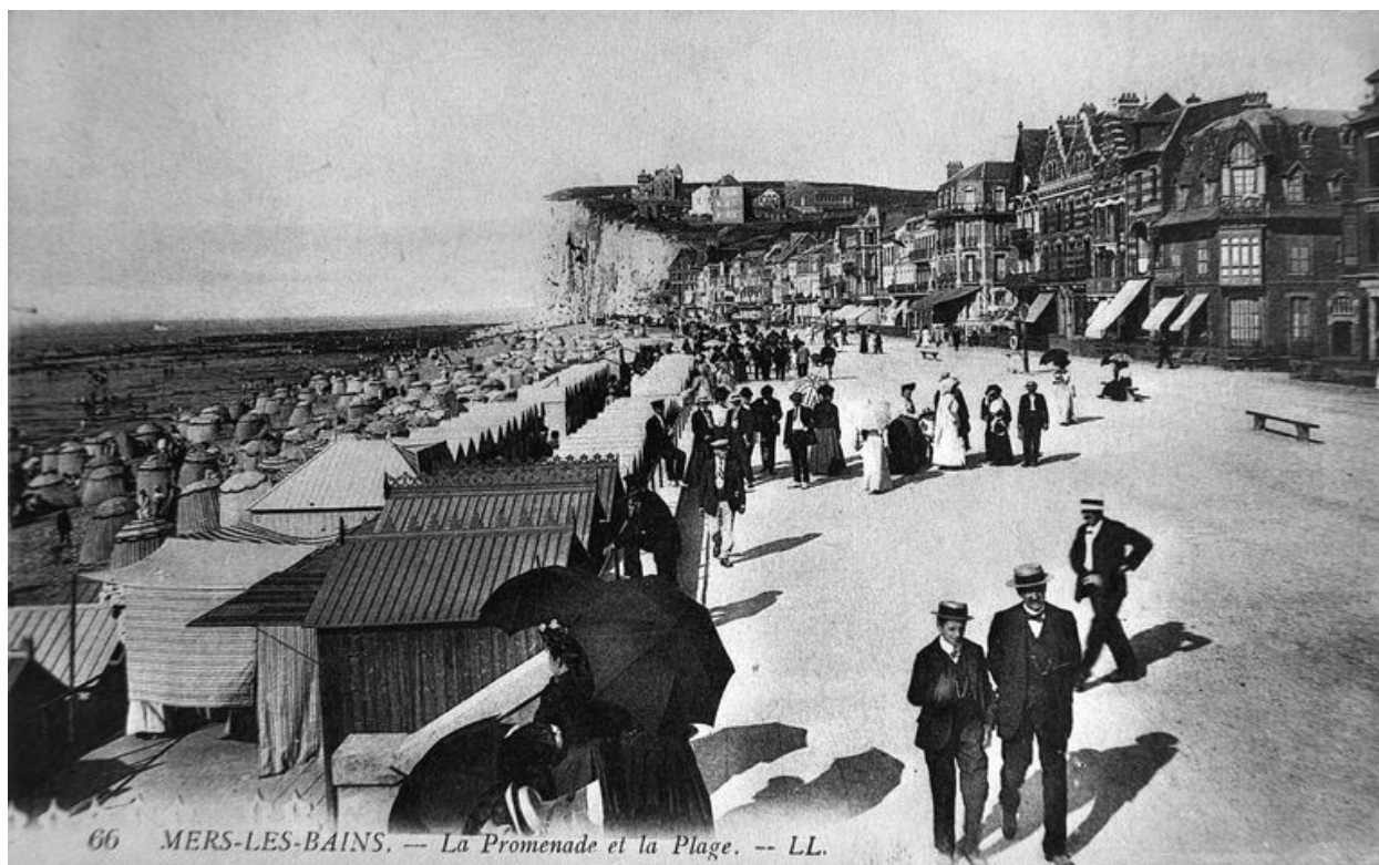
L'esplanade les cabines de l'établissement de bains froids, carte postale, 1er quart 20e siècle (coll. part..)