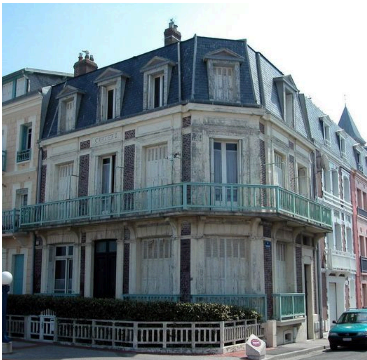
Clôture doublée d'une haie végétale (18, esplanade du Général-Leclerc).