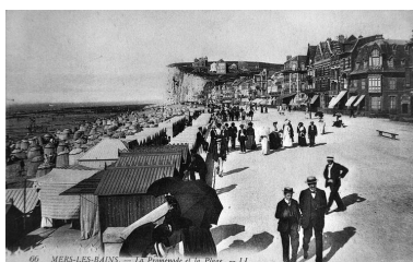
L'esplanade les cabines de l'établissement de bains froids, carte postale, 1er quart 20e siècle (coll. part.)

Phot. Monnehay-Vulliet Marie-Laure IVR22_20048000482NUCAB