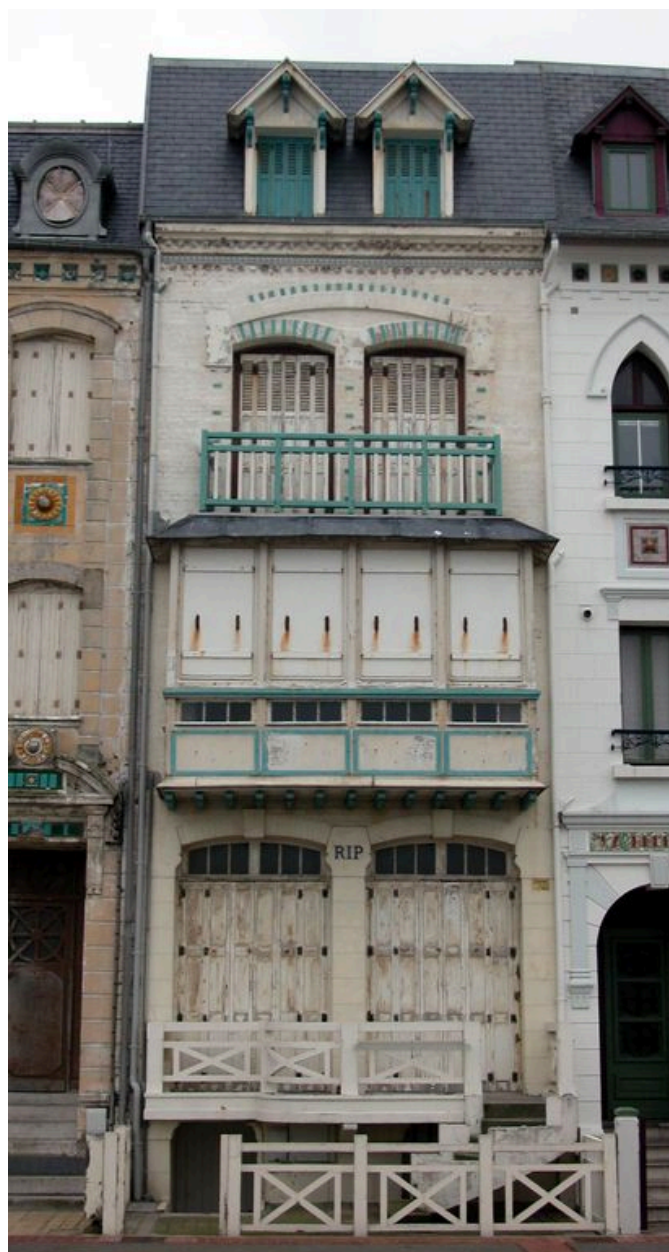
Clôture basse de séparation entre la voie publique et les jardinets (62 esplanade du Général-Leclerc).