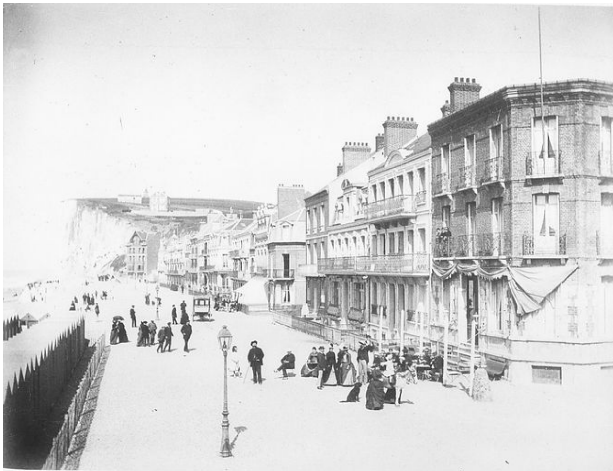
L'esplanade et l'ancien Hôtel du Casino au premier plan (îlot 9), photographie, [s.n.], limite 19e 20e siècles (BnF Estampes ; Mers, H 157897).