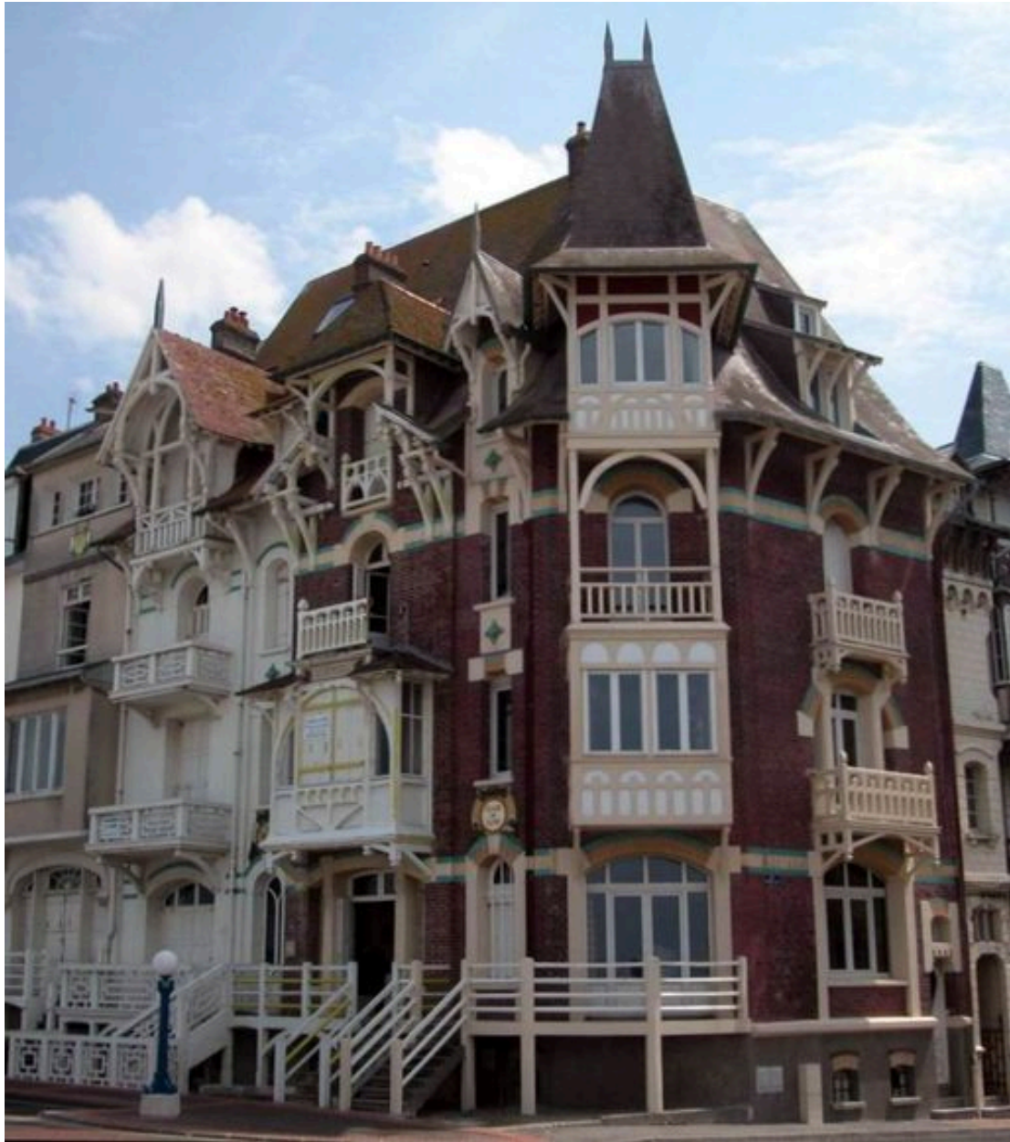
Les balcons des rez-de-chaussée surélevés (75 esplanade du Général-Leclerc).