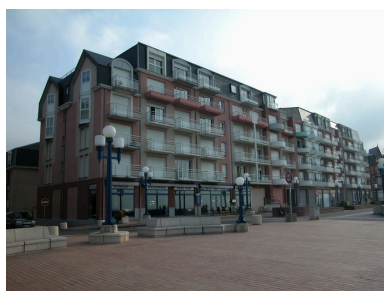
Le 'site casino', vue actuelle. IVR22_20058003437NUCA