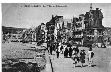
L'esplanade depuis le sud, carte postale, 2e quart 20e siècle (coll. part.).

Phot. Monnehay-Vulliet Marie-Laure IVR22_20038001184XAB