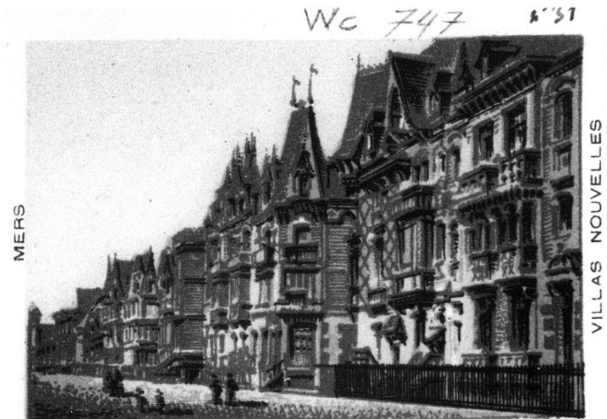
Les villas sur l'esplanade (îlots 20 et 21), dessin d'après photographie, par L.-P. Lefranc, 1892 (BnF Cartes et plans ; Sg wc 747/31).