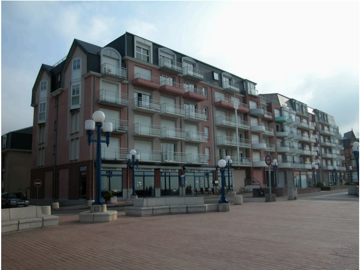
Le 'site casino', vue actuelle.