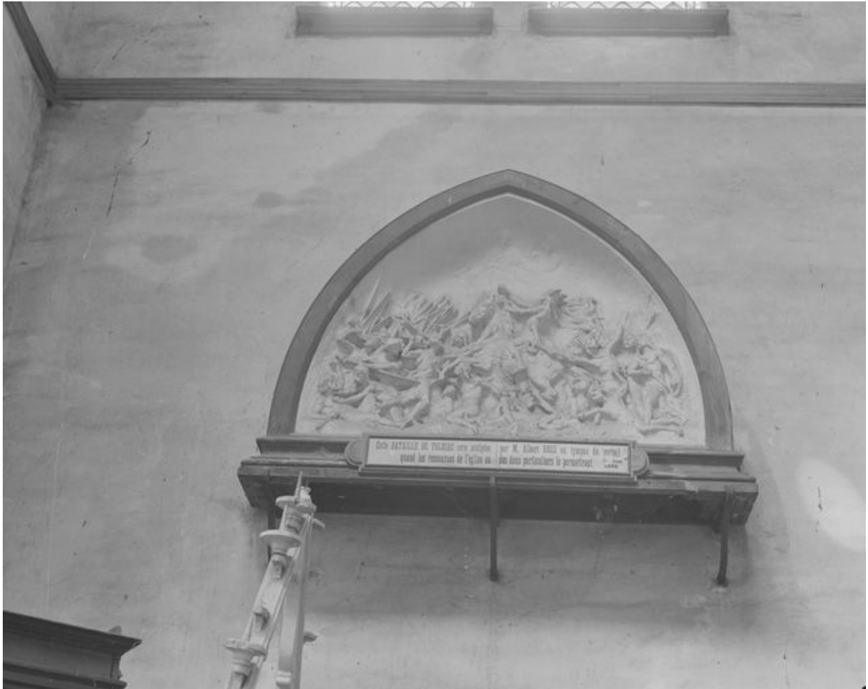
La Bataille de Tolbiac (ISMH 1982), maquette du bas-relief d'Albert Roze destiné à orner le tympan du porche de l'église, 1899.