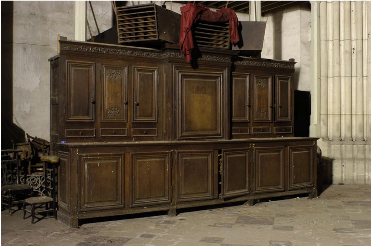
Ancienne armoire de sacristie.