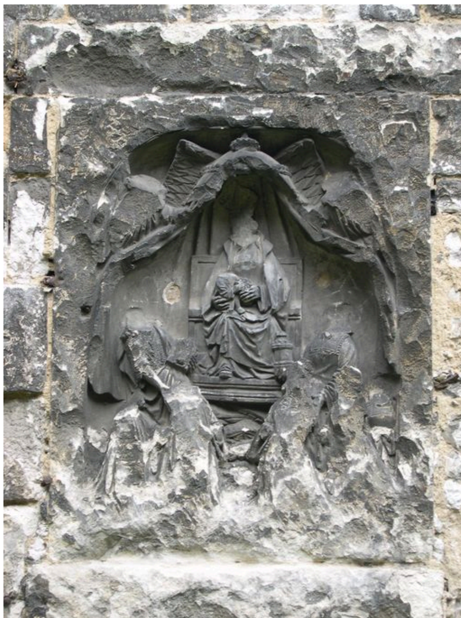
Bas-relief (mur sud de l'ancienne église conventuelle).