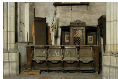
Stalles et confessionnal. IVR22_20068000290NUCA