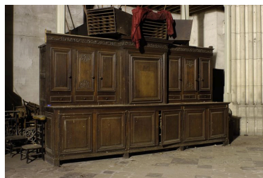
Ancienne armoire de sacristie. IVR22_20068000306NUCA