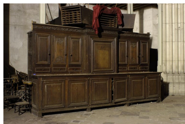
Ancienne armoire de sacristie. IVR22_20068000306NUCA