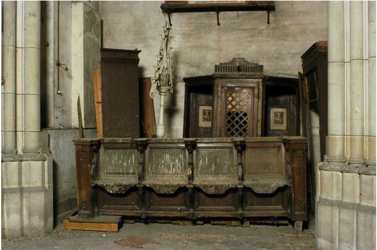
Stalles et confessionnal.