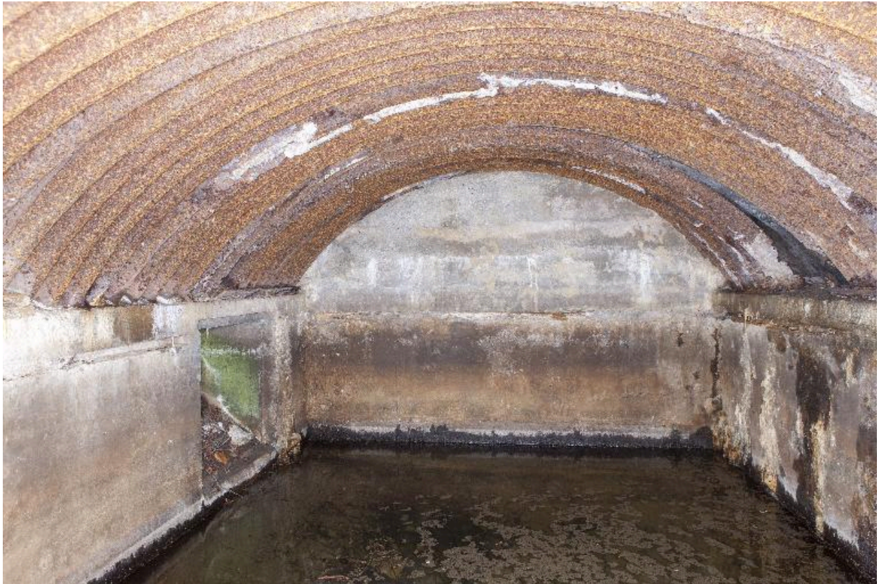
Vue intérieure de l'abri à personnel. A gauche le toboggan à mitrailleuse