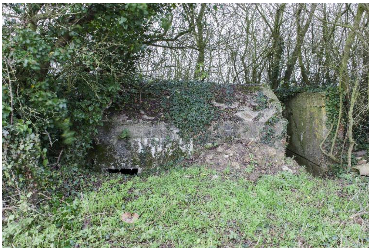
Elévation sud. A gauche l'entrée, au centre, le toboggan permettant d'escamoter la mitrailleuse