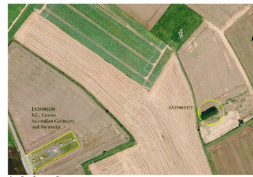
Position de l'édifice (cercle) sur une photographie aérienne de 2004. A gauche l'actuel mémorial australien de Fromelles