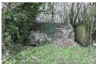
Élévation sud. A gauche l'entrée, au centre, le toboggan permettant d'escamoter la mitrailleuse