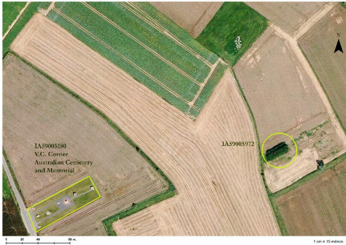
Position de l'édifice (cercle) sur une photographie aérienne de 2004. A gauche l'actuel mémorial australien de Fromelles