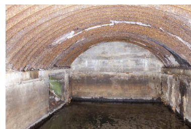
Vue intérieure de l'abri à personnel. A gauche le toboggan à mitrailleuse