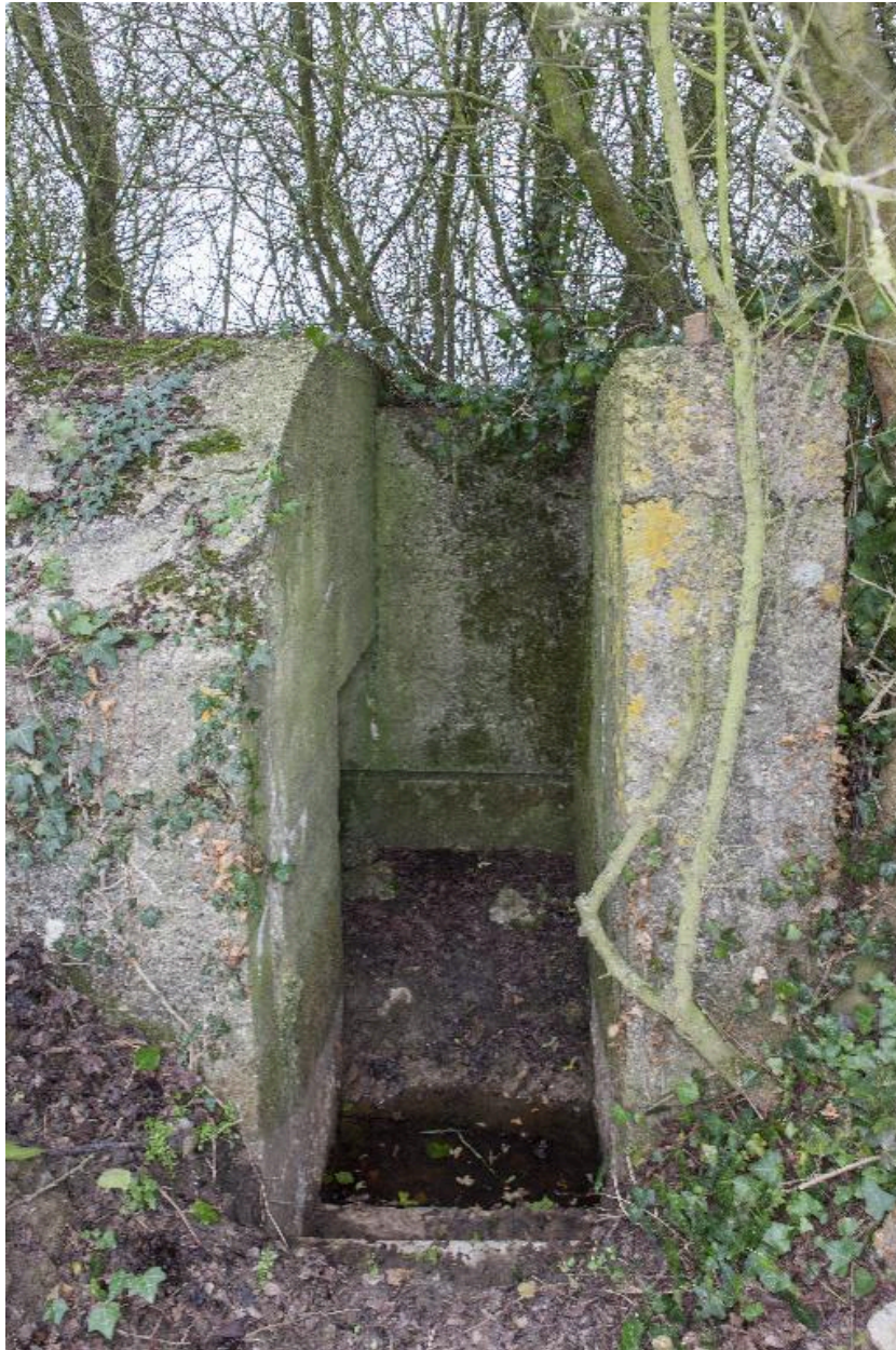
L'escalier latéral et l'entrée sont protégés par un mur pare-souffle