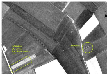
Position de l'édifice (cercle) sur une photographie de 1969. On remarque la présence d'un second. A gauche, l'emprise de l'actuel mémorial australien de Fromelles