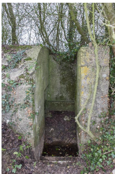
L'escalier latéral et l'entrée sont protégés par un mur pare-souffle