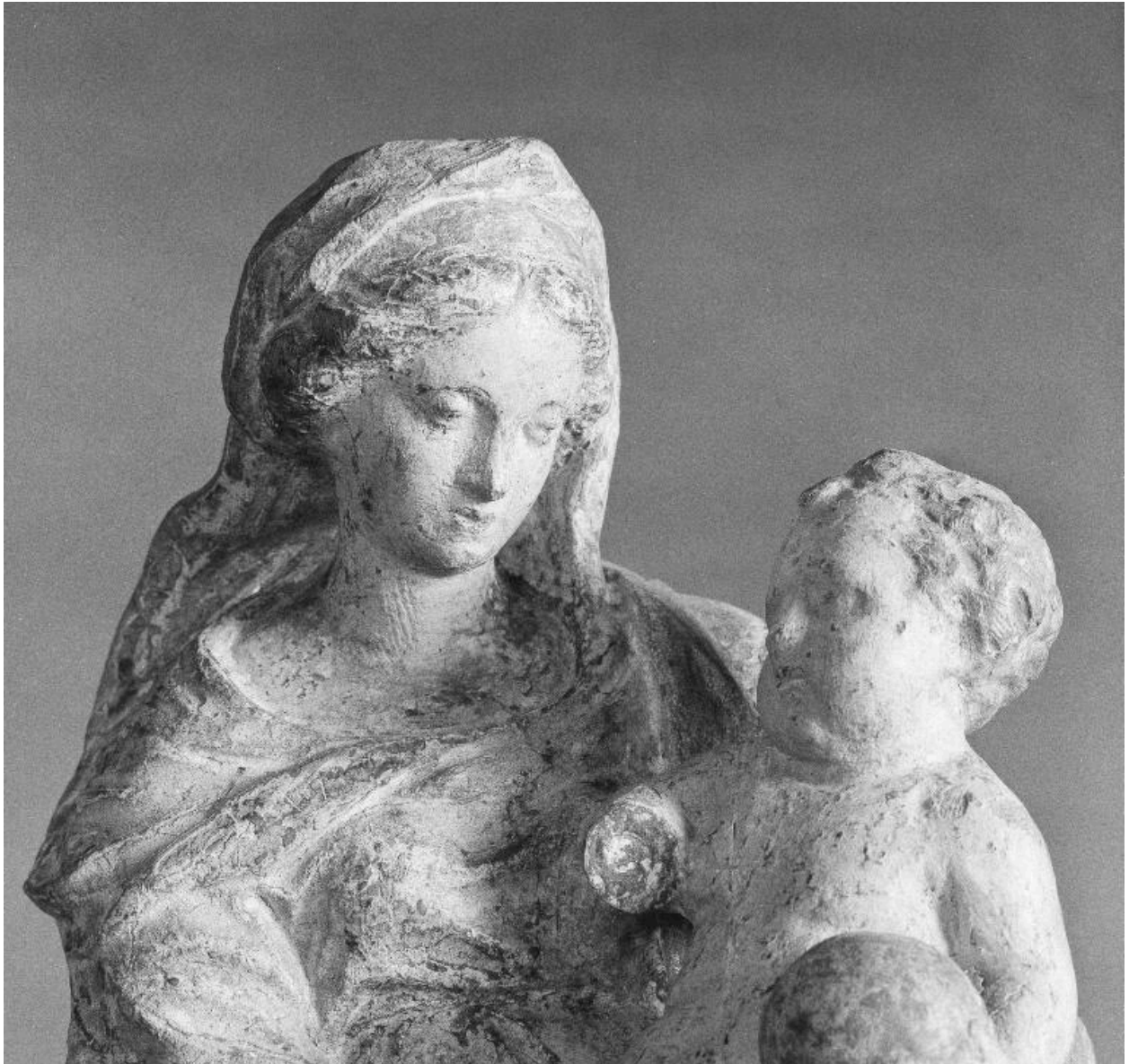
Vue à mi-corps de la Vierge à l'Enfant.